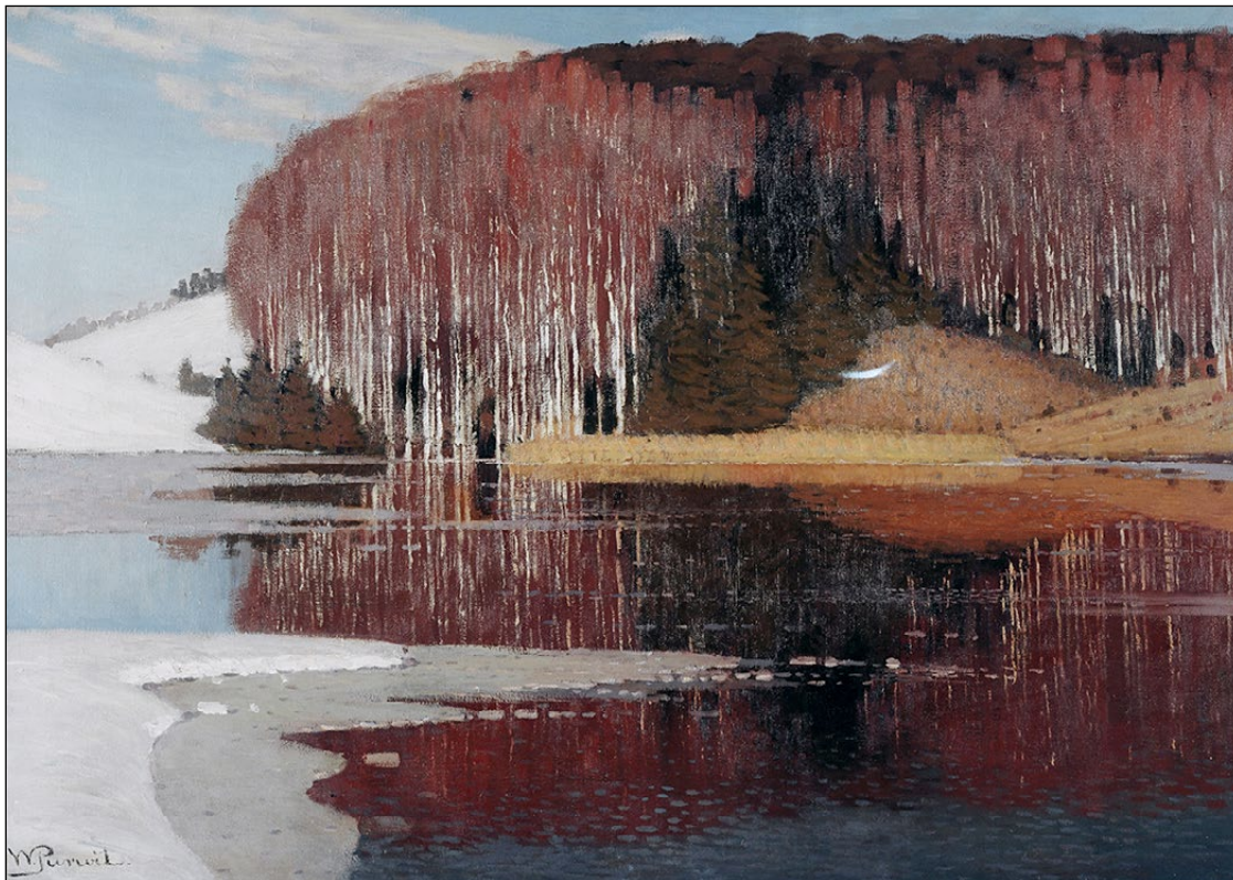
Pavasara ūdeņi (1910)