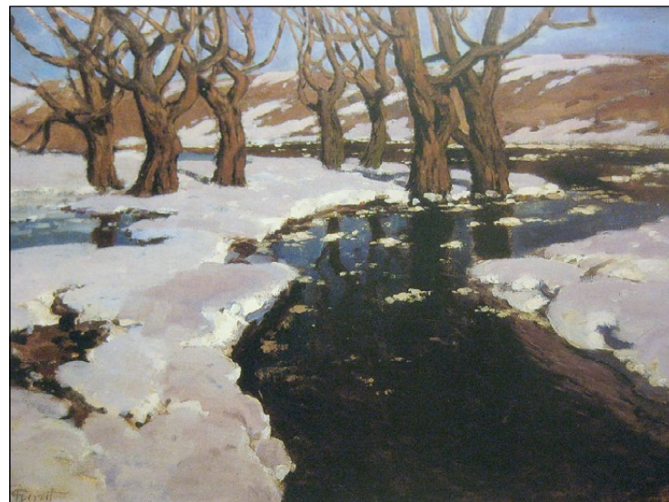
Agrs pavasaris (1898–1899)