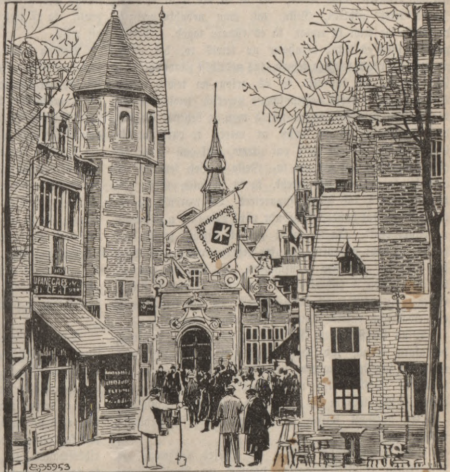
Wcz-Brijele. Istahdes galwenā ispreezas weeta.

Tagad behrna mahte, Gestu eeraugot, nesajuta wairs agrako, ar waru aistraujoscho juhtu pluhduma, ka senat. Wina jutās, tikai pahrssteigta, ka winsch rahdijas wehl domajot par winu paschu, kur tatschu tam wajadseja saprast,