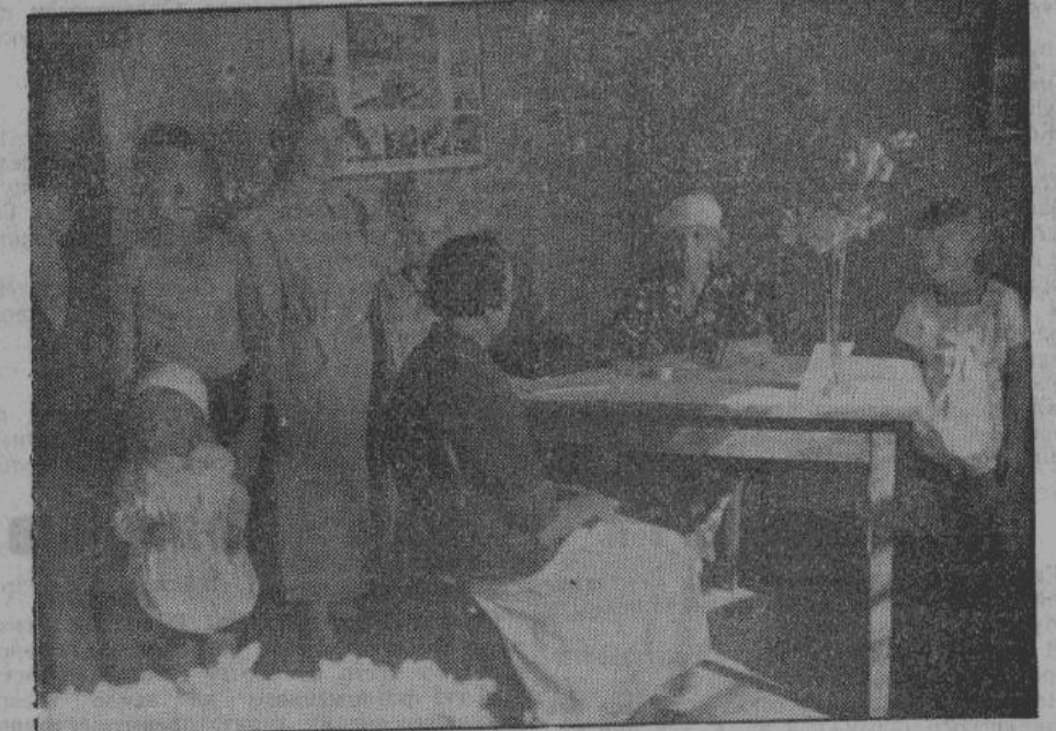
В одной из школ Пскова. Матери заявляют своих детей. За столом сидит начальница школы.

ются 38 школ, в которых будут обучаться дети в возрасте от 8 до 12 лет.