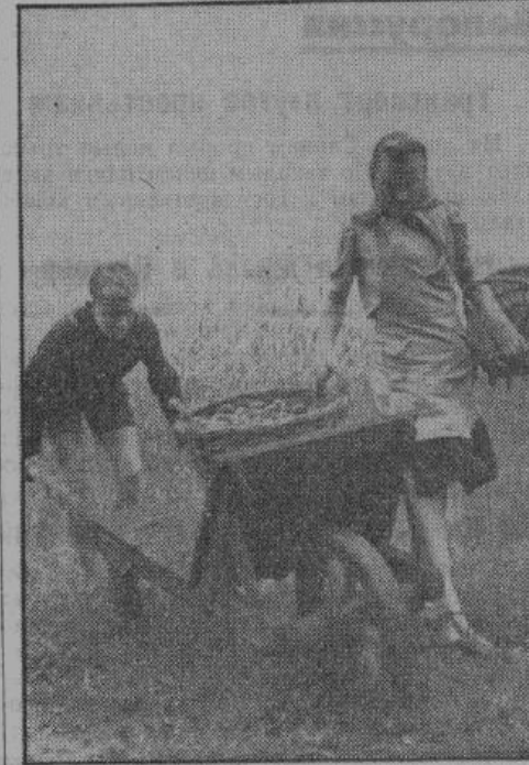
При сборе картофеля. Молодежь помогает повсюду.

случить помощь при уборке урожая, особенно в эту осень. Горожан насильно выгоняют в деревни, такого принуждения в Германии не существует. Помощь во время уборки урожая в Германии — долг чести каждого и поэтому горожане, мужчины и женщины, служащие и студентки, директора и рабочие, осенью предлагают германскому крестьянину свои услуги. Там они целый месяц гостят у крестьян, одевают их платье, косят, молотят, роют картофель и пашут, покрываясь здоровым загаром и нарабатывая трудовые мозоли.