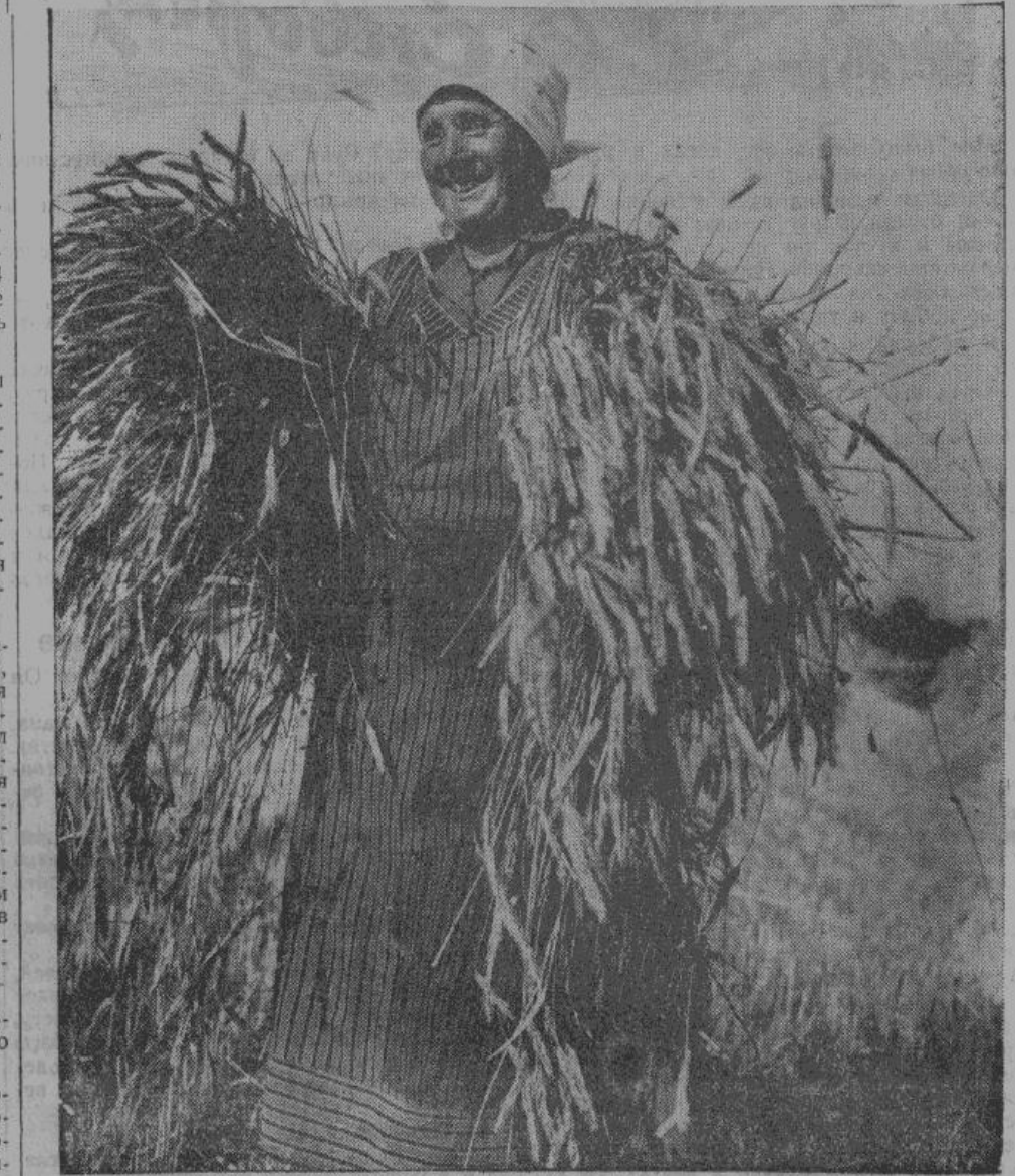
Тяжелые колосья золотистой ржи сулят Германии хороший хлеб.

Германская помощь при уборке урожая является прекраснейшим доказательством германского духа общественности, выражающегося окончательно в понятии «народ». В Германии нет классовых различий, есть только один объединенный, крепко спаянный, германский народ.