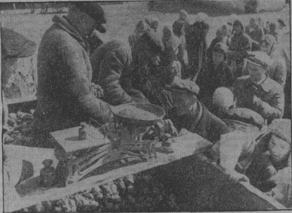
Бойко идет торговля на рынке Симферополя. — Семечки подсолнуха для ребят.

ская власть выкачивала из этой крымской житницы буквально все. Вывозились фрукты и виноград для кремлевских сагарапов, вывозился табак, а урожай грабили так же, как и во всем Союзе. Официально Крым объявлен был местом отдыха «трудящихся», а на крымских курортах жили