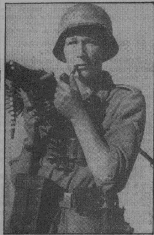
Германский солдат под Сталинградом

Советская авиация потеряла 16 и 17 сентября 146 самолетов. Германская авиация 6. Ночные налеты немецких бомбовозов были направлены против военных объектов на юге и востоке Англии. В Ламанше авиобомбами уничтожен один британский разведывательный катер. Морская артиллерия сбивла два британских самолета.