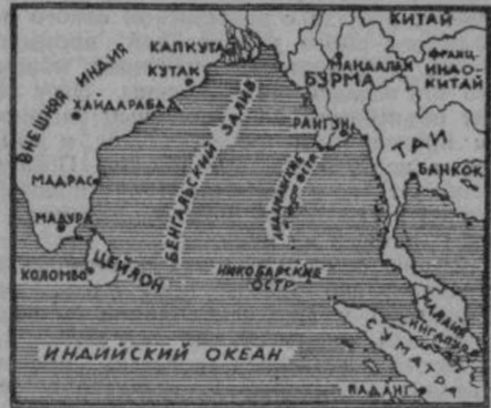
Наша карта Индийского океана и Индии

Одному германскому танковому корпусу на Кавказском фронте недавно удалось захватить «тайный приказ Сталина защиты СССР № 227 от 28 июля 1942 года». Этот приказ проливает свет на катастрофическое положение Москвы. В самом приказе, между прочим, говорится: «Области, ко-