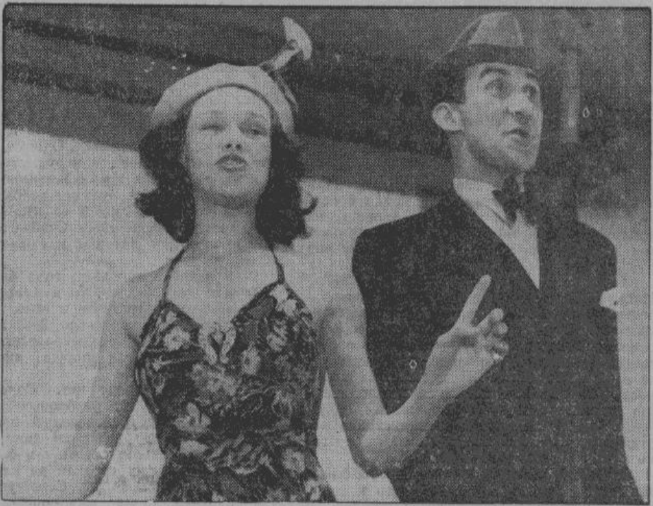
Знаменитые французские кабарежные артисты — Бруни и Кергоф — вызывают бурю аплодисментов

дня в день дают восточному фронту танки и самолеты, орудия и винтовки.