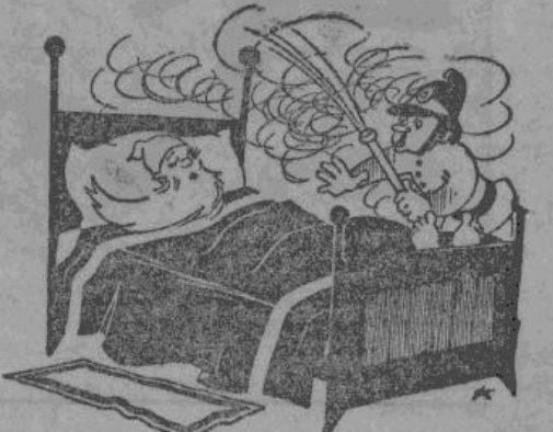
— Господи профессор, вставайте скорее. В третьем этаже пожар. — Ну так что же? Мы ведь живем в четвертом.