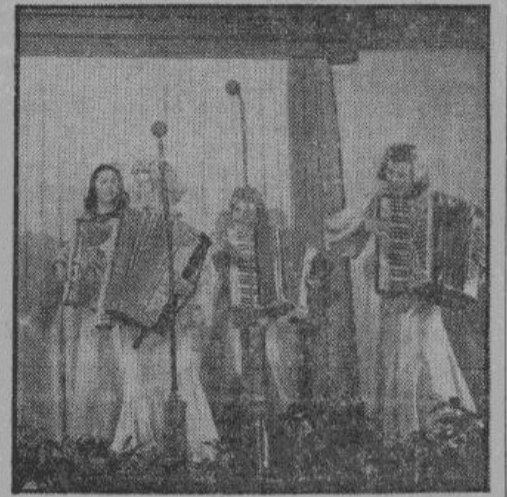
Звезды парижского реву — на аккордеонах исполняют популярные французские песни

Но число иностранных рабочих постоянно увеличивается. Ежедневно тысячи новых приезжают в Германию. Только что мы получили сообщение, что сегодня опять перешел германскую границу специальный поезд с 800 французскими рабочими. Французская пресса, занимающаяся теперь вопросом о рабочей силе, сообщает, что среди них находится целая семья, поступающая рабочими на один химический завод. Француз-