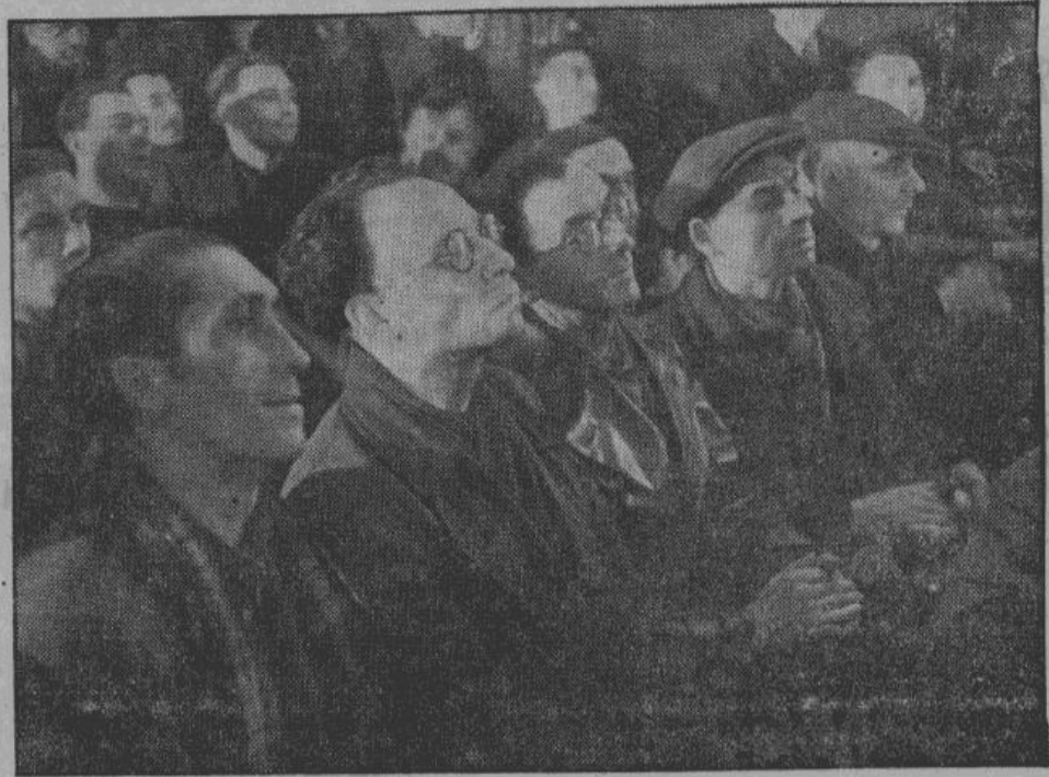
На вечерах для французских рабочих в Германии выступают лучшие парижские артисты. На снимке — рабочие с увлечением следят за игрой актеров