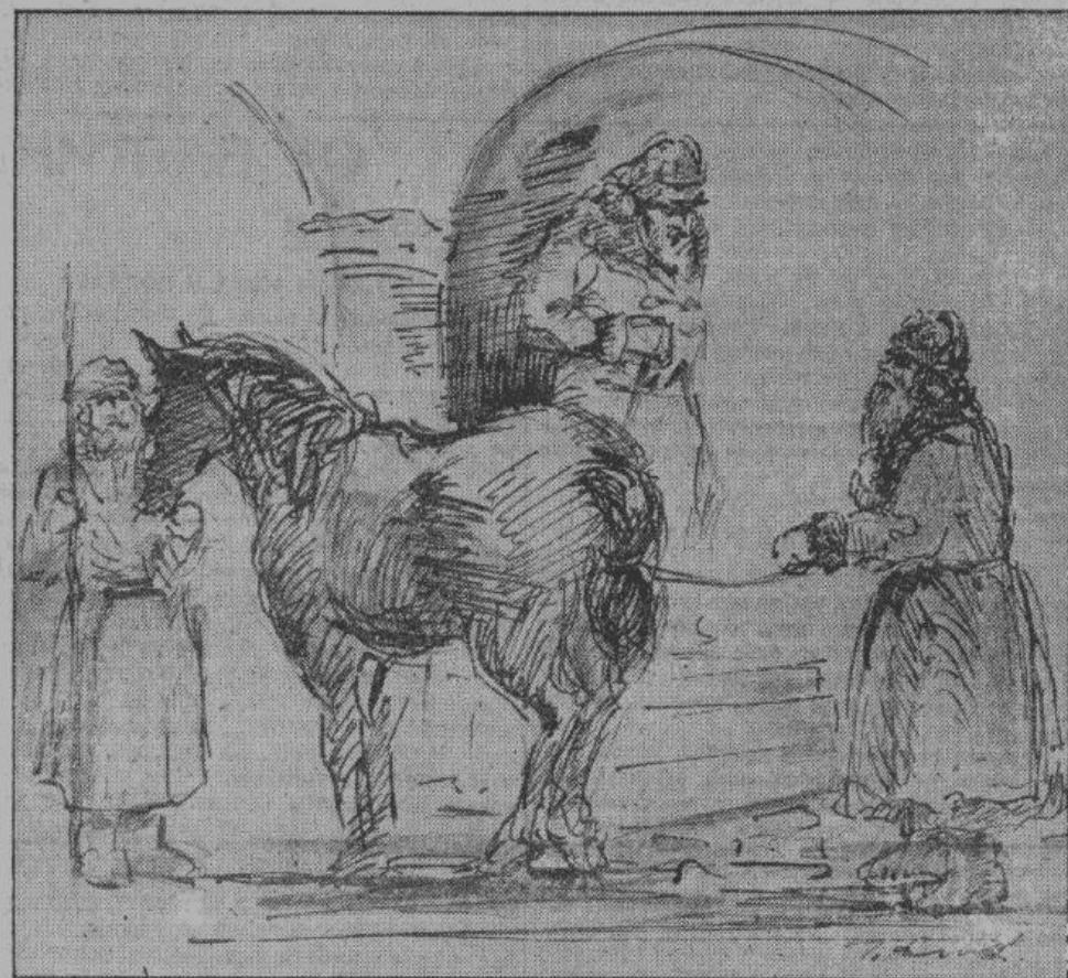
«... Поганкин спрятавшись, было, от царя в погреб, но был вытаскн оттуда и приведен к Грозному привязанным рукою к хвосту лошади.»

Поганкины палаты сообщались тайным ходом с католическим костелом. Ход этот начинался от древних городских стен и случайно был открыт ксезвдом Битковским. По всей вероятности, существовали и другие тайники, забытые потомством и к настоящему времени обвалившиеся.