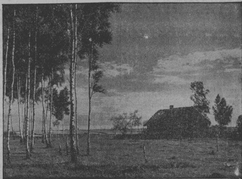
Типичный облик Белоруссии — селение, примыкающее к березовой рощице