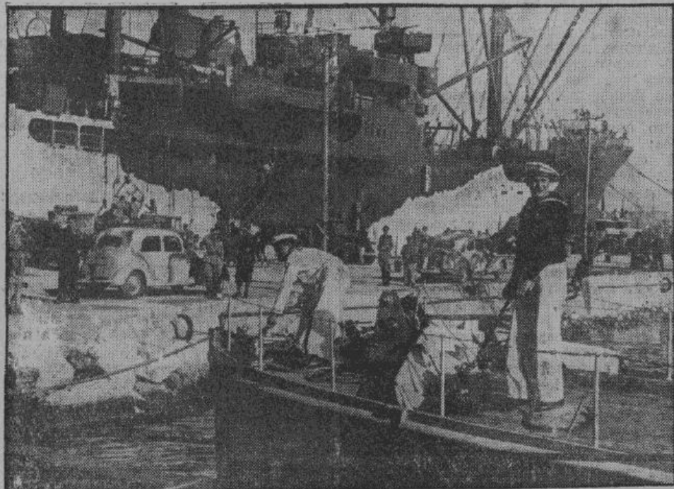
В то время, как на восточном фронте, Сталинград охвачен железным кольцом, и немцы по берегу Черного моря продвигаются в Туапсе; достигнуты новые успехи на Терек и стальная клин приближается к Каспийскому морю. Германские части в северной Африке, находящиеся на египетской территории, ежедневно беспрепятственно снабжаются боеприпасами и продовольствием. Скоро там забушует новый ураган!