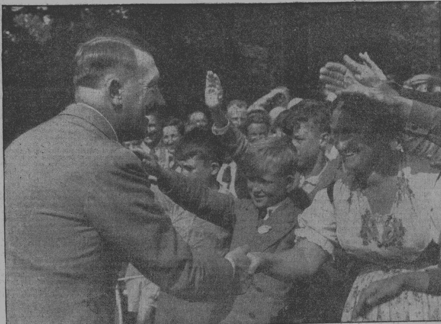
Германский народ всем сердцем своим любит Адольфа Гитлера. Вождь и его идея являются залогом победы. Войска Великогермании и ее союзников создадут Новую Европу и достигнут того, что все народы смогут вести свободную жизнь