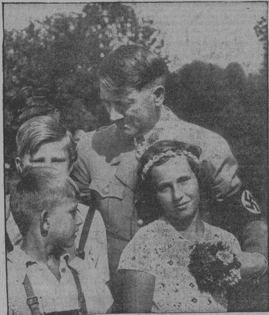
Адольф Гитлер — друг молодежи. Он любит не только германскую молодежь, но является вождем и тех молодых народов, молодежь которых с оружием в руках борется на фронте. Борется, чтобы юноши и девушки всей Европы, веря в лучшую будущность, могли бы радостно для нее жить и работать