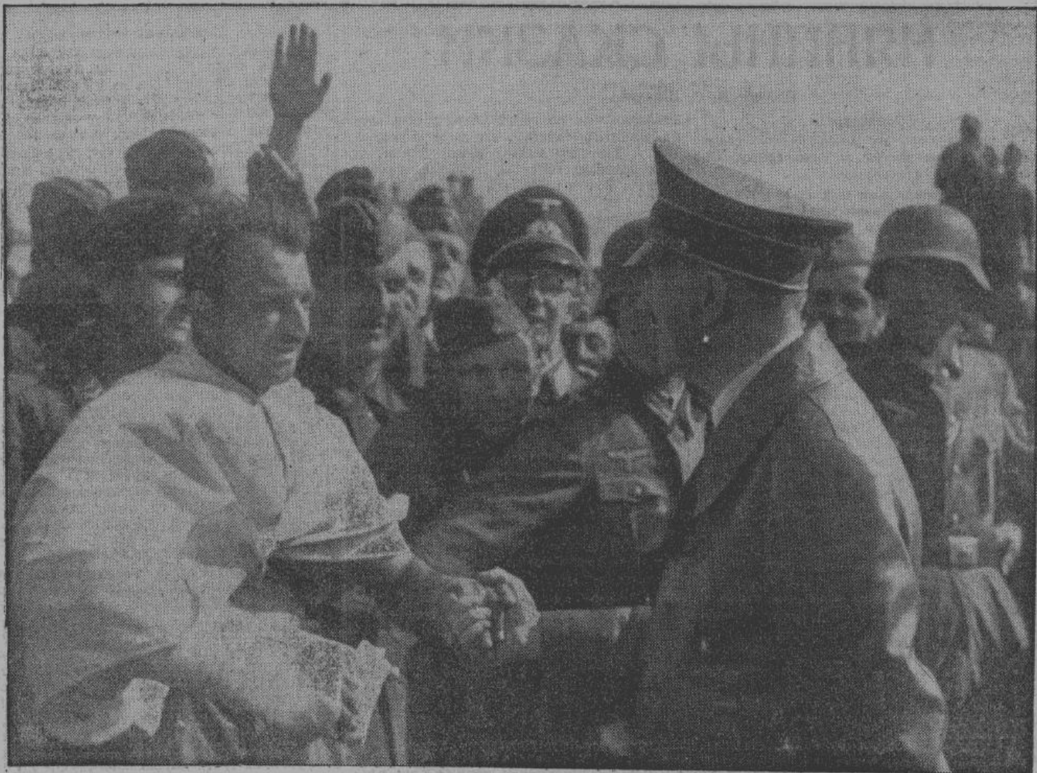
Адольф Гитлер среди своих товарищей. Во время первой мировой войны он был простым солдатом, а сегодня он полководец Новой Европы. Это превращение является символом. В Новой Европе считаются только с работой и достижениями. Такими же социальными образцовыми государствами, как Германия, должны стать и все остальные государства Европы, население которых тогда сможет мирно и радостно жить