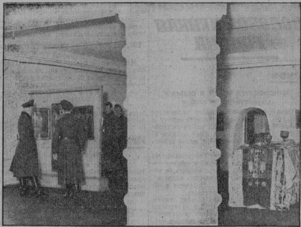
Одна из верхних палат, где хранятся иконы. Среди них мастера русской иконописи — Рублев, Дионисий, Феофан Грек

Иконы писались по строгому уставу (правилу), так же, как пишутся композиторами фуги, сонаты, прелюдии. Фугой нельзя назвать вещь, написанную как соната, так и иконой нельзя назвать изображение Божественного, если не соблюдены вековые правила иконописи. В основном, надо указать, что изображение святого или Божества не должно быть реально жизненным и земным, а как бы иррациональным. Движение и позы должны быть нарочито искусственными. В ок-