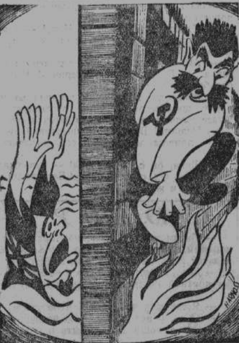
«Папаша» Сталин: — Помогите, г. Черчилль, я горю! Английский «полюковец» Черчилль: — Помогите, товарищ Сталин, я же тоню!