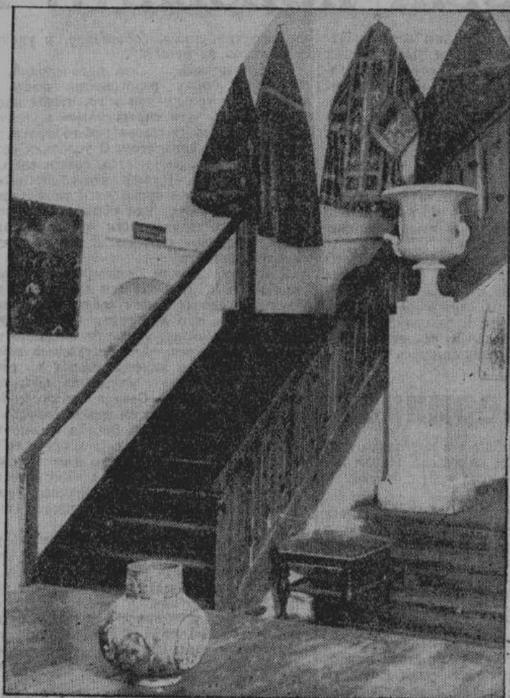
Нижнее помещение Поганкиных палат. По середине комнаты стоит большая ваза-амфора, работы Императорского фарфорового завода времен Николая I.

палат, где хранятся иконы. Еще очень, очень многим древне-русские иконописцы, мало что говорят. Немногие знают о существовании Рублева, Дионисия, Феофана Грека — великих мастеров иконописи. Русская светская живопись XVIII и XIX веков вышла из этого своеобразного рода искусства.