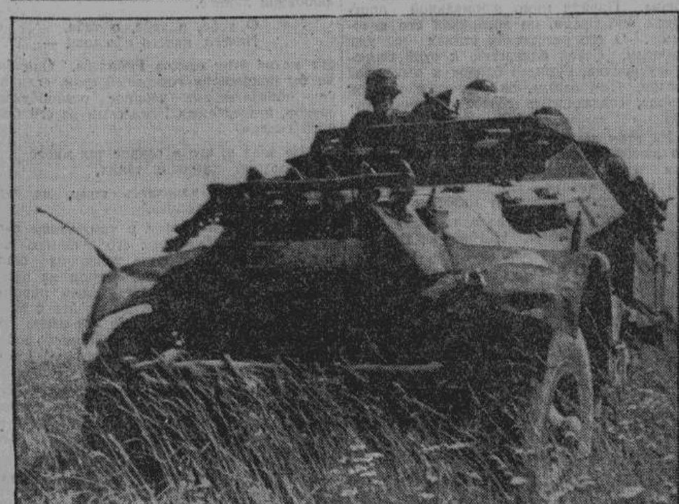
Смелой атакой гренадеры броневых частей врываются в линии противника. Особо выдающуюся роль они играют в боях под Сталинградом