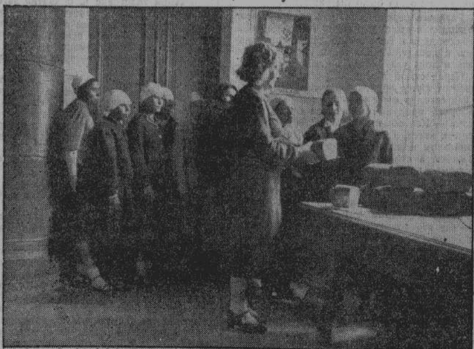
В каждом освобожденном русском городе находится большое количество беженцев. Они попали туда частью спасаясь из «советского рая», частью уходя из районов военных действий. Эти беженцам не хватает одежды, не хватает хлеба. Германские военные власти и местные самоуправления делают все возможное для их благополучия. На снимке — раздача хлеба волховским беженцам в Луге