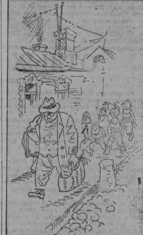
«...Уличные мальчишки изобрели увлекательную игру «в диверсантов»...» Рис. автора

произведение природы. На эту должность е издавна принято сажать самых bestолоковых, самых неграмотных партийцев. Но даже и их не хватает. Поэтому среди управдомов много беспартийных олухов. Сменяются они калейдоскопически.