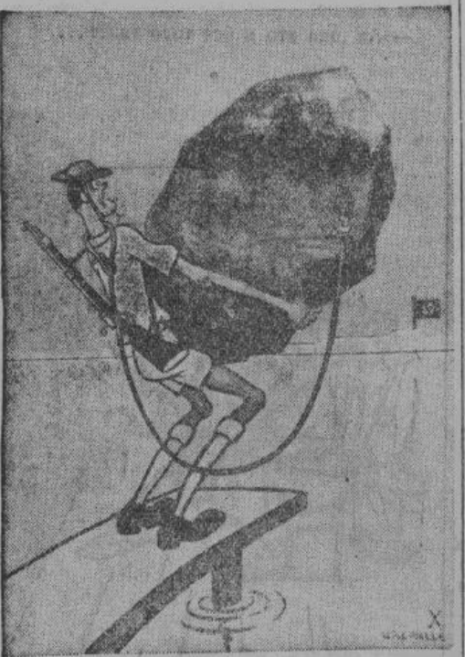
Английский солдат — Черчилль прикрепил к моей шее тяжелый камень — второй фронт. Он давит меня. Не бросить ли камень в воду?..