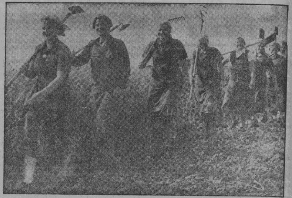
Эти украинки весело и бодро отправляются в поле, где будут оказывать ценную помощь германскому крестьянину.

Работы о быте рабочих взяла на себя обширная организация германского рабочего фронта. Если принять во внимание, что число рабочих достигло шести миллионов, и продолжает неизменно увеличиваться, то можно представить, каких это требует организаторских талантов. Здесь встречаются рабочие всех стран Европы. На германских фабриках работают сейчас: норвежцы, датчане, финны, шведы, голландцы, бельгийцы,