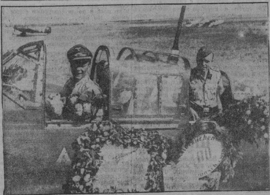
Число сбитых неприятельских самолетов растет с каждым днем. На лице кавалера ордена Железного Креста рыцарской степени сияет радость победы.