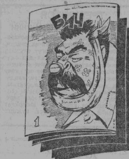
Сталин на обложке первого номера журнала «Бич».

Грозным смехом отвечаем мы врагу. Первый удар «Бича» достался Сталину. С обложки глядит тупое, изрытое острой рыло: низкий лоб, горбатый нос, одуловатые щеки; все залезено кусками пластыря, — это следы побоев, нанесенных «великому полководцу» под Минском, Смоленском, Вязьмой