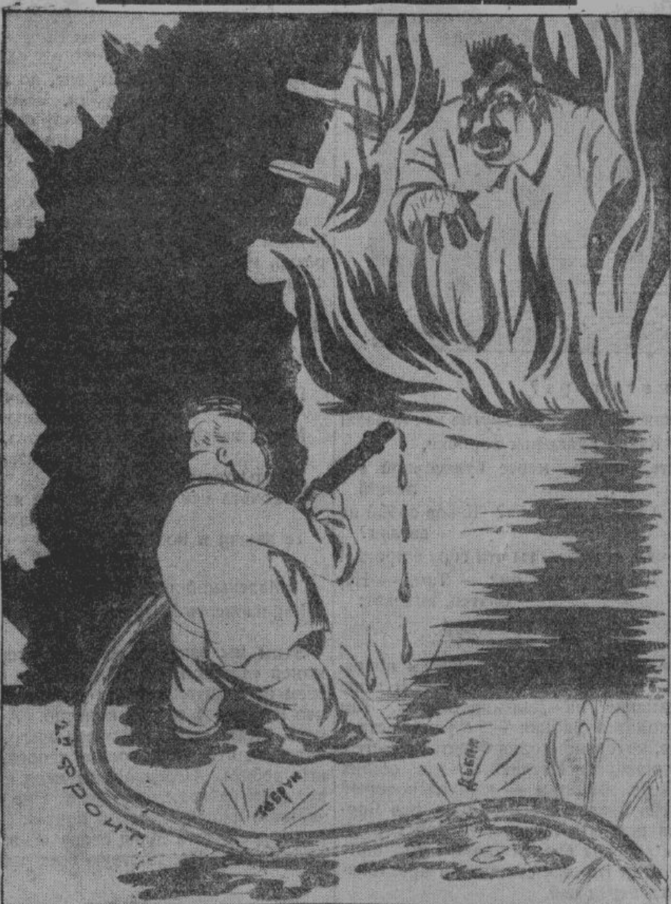
Английский премьер Черчилль был в Москве, чтобы помочь Сталину, которому угрожала смерть в огне у Сталинграда. Теперь газеты пишут, что Сталин возмущен слабой помощью, оказываемой англичанами.