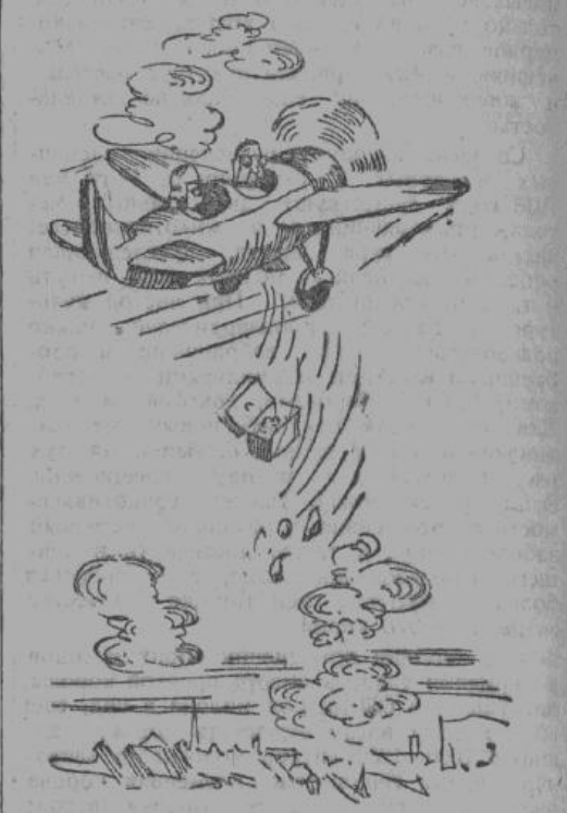
— Идиот, ты же выбросил наш завтрак вместо бомбы. — Ничего, они и этим будут довольны.