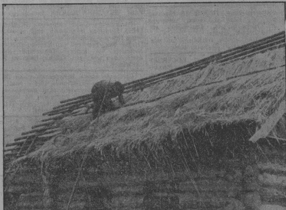
К особенностям большевистской деревни принадлежали дырявые крыши: у крестьян отнимали не только сено, но и солому, так что им не оставалось материала для починки крыш. Теперь, когда впервые на собственной земле, сжата крестьянская рожь, в деревнях началась энергичная починка дырявых крыш.