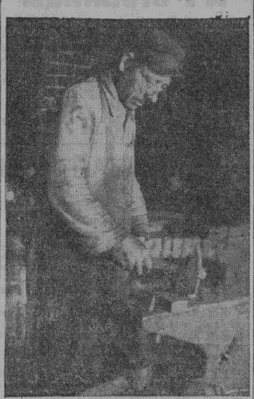
Деревенский кузнец выковывает из послушного железа угольник для телеги. Разоренная большевиками кузница снова приведена в порядок и в горне снова пылают раскаленные угли.

ать и украшения для крестьянского дома и нарядную вазу для цветов и чернильницу и пепельницу.