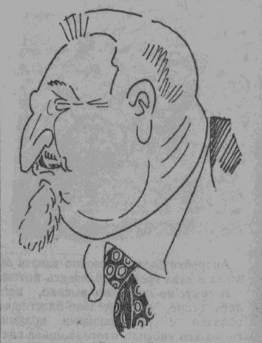
Лозовский. Рисунок автора.

Откуда такая люта я ненависть, на чем она основывается? Ведь, в хаосе отступления большевики чаще всего лишены возможности отправить в тыл не только укло-