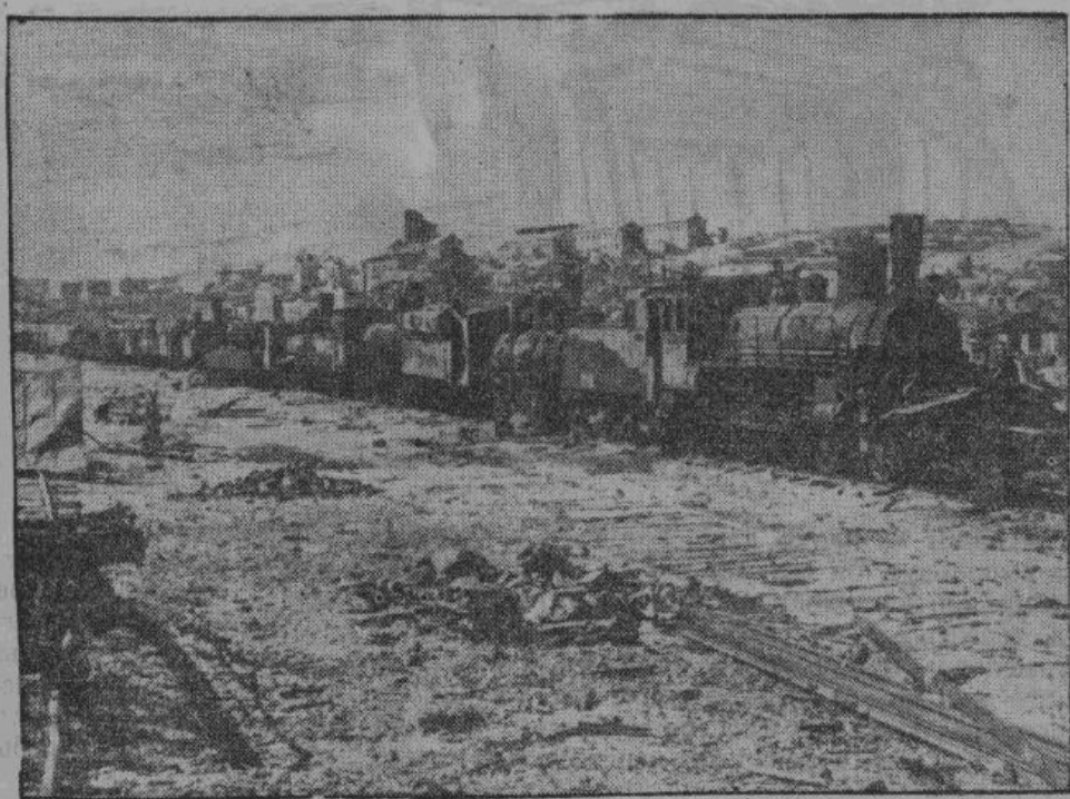
Град бомб германских самолетов обрушивается на советские пути снабжения. На снимке — большевистский состав, разбитый на пути к Ленинграду

от НАШЕГО ВОЕННОГО ОБОЗРЕВАТЕЛЯ АНДРЕЯ КЛИМОВА.