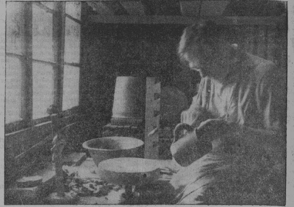
Глиняная кружка в опытных руках горшечника после обжига появится на крестьянском столе.

Большевиком создан еще одну профессию — разрушителей, в чем некоторые специалисты оказались на такой высоте, что удивили весь мир. Взорвать храм и не оставить от него камня на камне (храм Христа