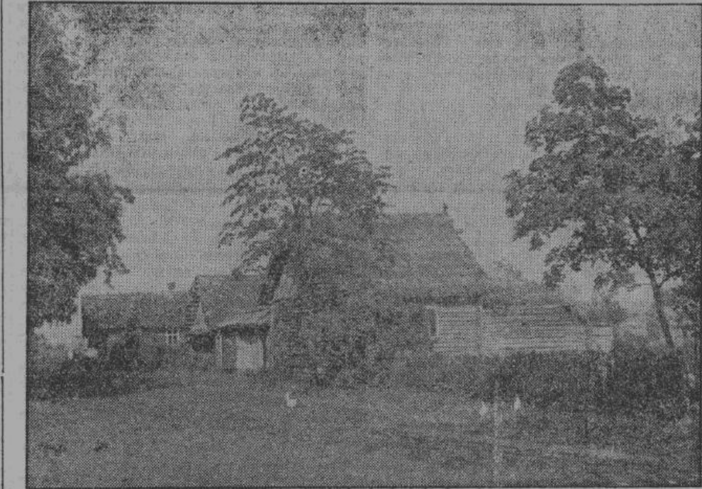
«...Жилые помещения стали удивительно чисты, перед домами — березовые изгороди...»

гих лет, ибо то, что зреет на солнце, больше не для коллектива, а для себя. Оно больше не идет разным лодырям, которые в коллективном хозяйстве мешали прилежному труду крестьян, и которых надо было зря кормить. Этот урожай всецело принадлежит крестьянину — это награда за его труд и прилежание. Вечером крестьяне воз-