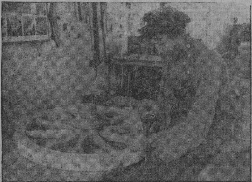
Ровное и прочное колесо, без которого не обойтись ни одному крестьянину, в опытных руках веснянского колесника.

да дана будет населению возможность избирать себе профессию, свободно учиться и заниматься ею, а это может быть лишь тогда, когда будет уничтожен большевик — этот гробкопатель личной инициативы. М. Петрович.