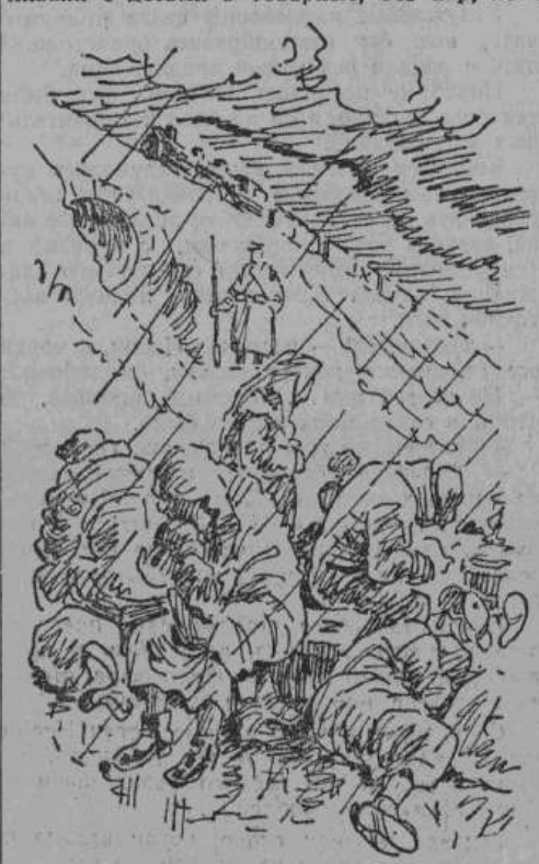
«Люди располагались в поле».

Пассажирыские вагоны, по большей части, монополизировались ГПУ и военным ведомством. В гражданском обиходе их предоставляли ответственным работникам эвакуирующихся учреждений. Остальных упихивали с детьми в товарные, без нар, но с