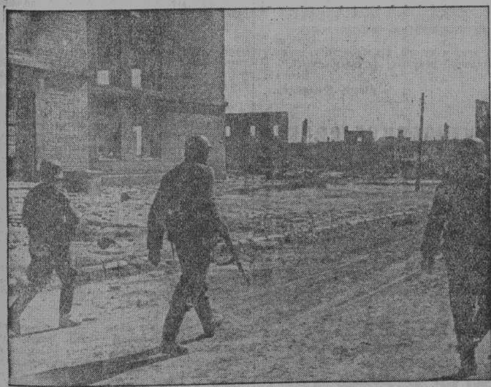
С невызойлой жестокостью Сталин заставляет истекать кровью красную армию в Сталинграде. Германским войскам в упорных боях приходится занимать каждый отдельный дом в этом городе. После невероятно мощного артиллерийского ураганного огня, вступают взятые значительные оборонительные пункты города: тракторный завод им. Дзержинского и оружейный завод «Красная Баррикада». Временами до тысячи штуркасов кружатся над Сталинградом. На снимке: передовые ударные отряды продвигаются вперед.