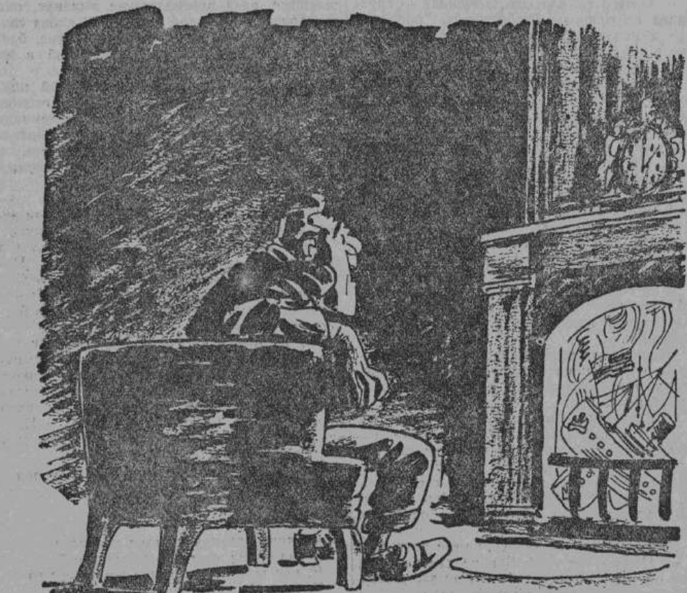
«Ты сидишь одиноко и смотришь с тоской, как печально камин догорает...» Рис. Земляка (Из популярного романа)

Рузвельт периодически произносит по радио «успокоительные беседы у камина». Тон этих бесед с каждым разом делается все менее успокоительным. (Из газет)