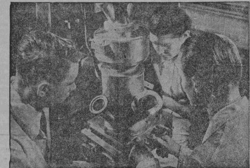
«Сверхмикроскоп» — сенсационное германское изобретение. С помощью особых лучей достигается увеличение в сто тысяч раз, благодаря чему открывается новый мир мельчайших микро-организмов, которые до сих пор были невидимы.

вщихся уже промышленных предприятий, к улучшению и постройке новых фабрик и заводов, опять таки Германия снабжала их необходимыми техническими специалистами. Большевики приглашали из Германии в Со-