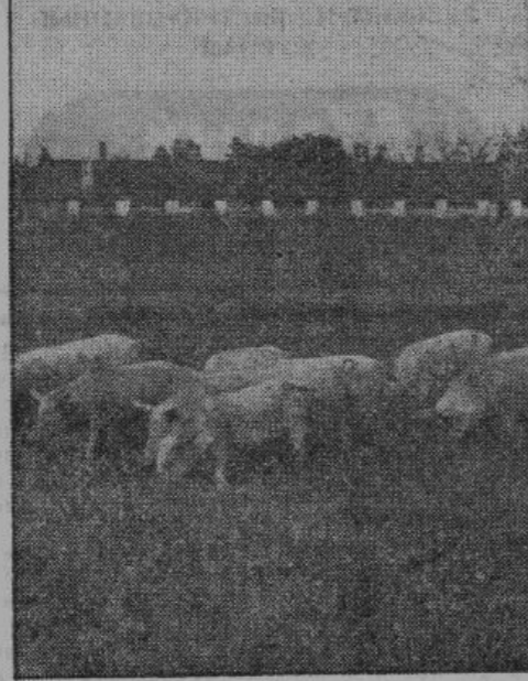
В бывшем совхозе «Диктатура», недалеко от Пскова, устроено образцовое государственное хозяйство для разведения племенных свиней. На снимке — стадо свиней на пастбище.

земли в личную собственность. В настоящее время в нашем Псковском районе уже производятся землеустроительные работы — разбивка на широкие полосы в волостях: Каменской, Корловской, Ворошиловской и