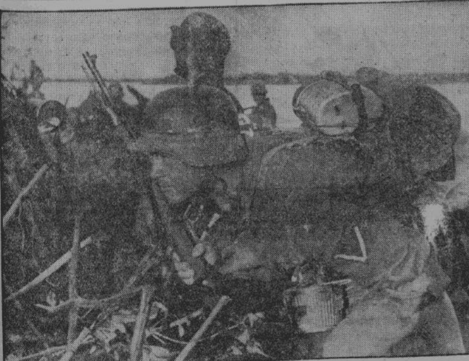
В предгорьях Кавказа наступающим германским войскам особенно много приходится переправляться через горные реки и ручьи. На снимке — пригнувшиеся фигуры и напуганные лица германских солдат, занимающих неприятельский берег реки. — Из-за яркого света каждого куста может раздаться выстрел или стук пулемета...