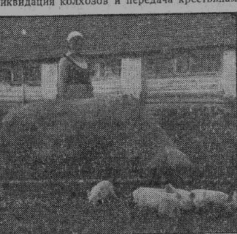
Племенная свинья со своими поросятами.

В освобожденных областях самым первым мероприятием германских властей была ликвидация колхозов и передача крестьянам