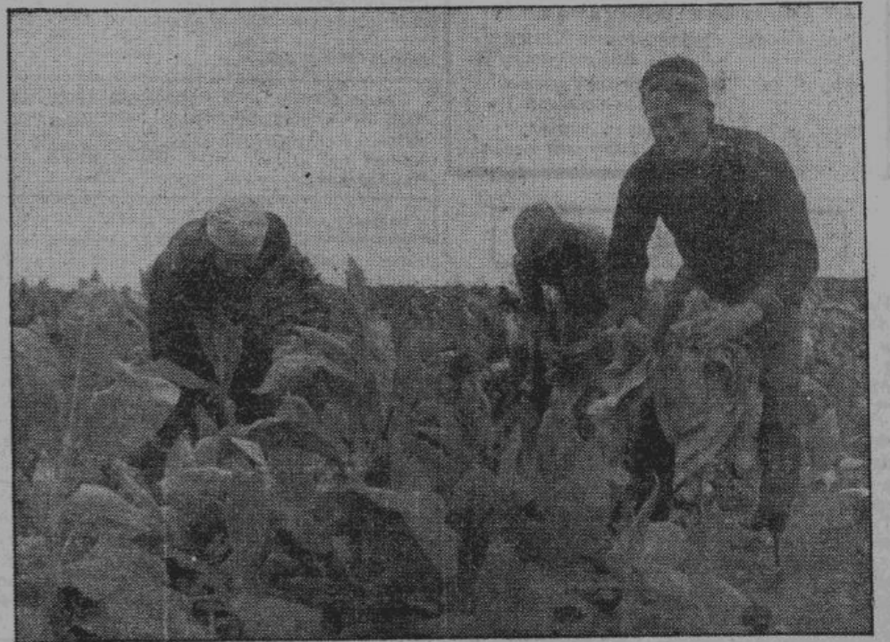
В этом году в освобожденных северных областях много курляшских разводили собственный табак. Табак уродился хорошо. Теперь нужно подвергнуть его правильной обработке. На снимке — сбор урожая табака в одном из госимений недалеко от Пскова.

Уборка табака начинается в то время, когда листья становятся желтовато-зелеными.