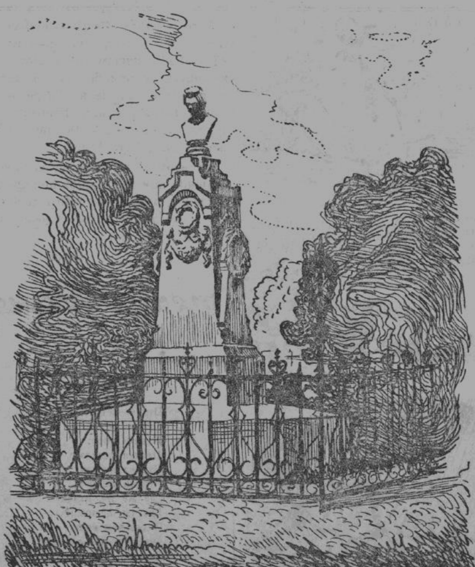
Памятник Кольцову в Воронеже

Белинский прав, отражением природы, любви, бытовыми картинками из жизни деревни не ограничивается поэтический мир Кольцова. В его стихах, песнях и думах ярко отобразил творческий соиздательный труд. Глеб Успенский, которому была особенно близка и знакома крестьянская действительность, писал о Кольцове: «В русской литературе есть писатель, которого невозможно иначе назвать, как поэтом земледельческого труда... Это Кольцов. Никто не исключая и самого Пушкина не трогал