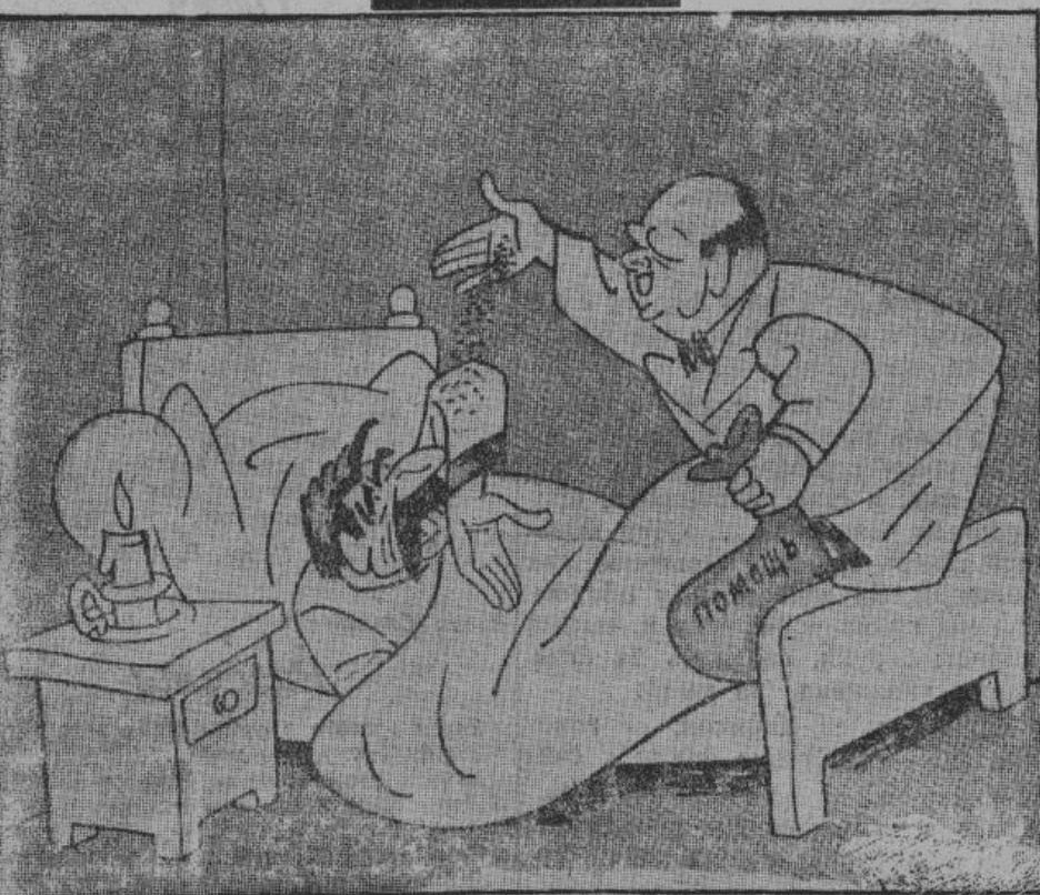
Черчилль: — Смотри, как я исполняю свои обещания. Сталин: — Песок, всего лишь песок... А на этот морской песок навеки погружаются целые пароходы с танками, пушками и самолетами...