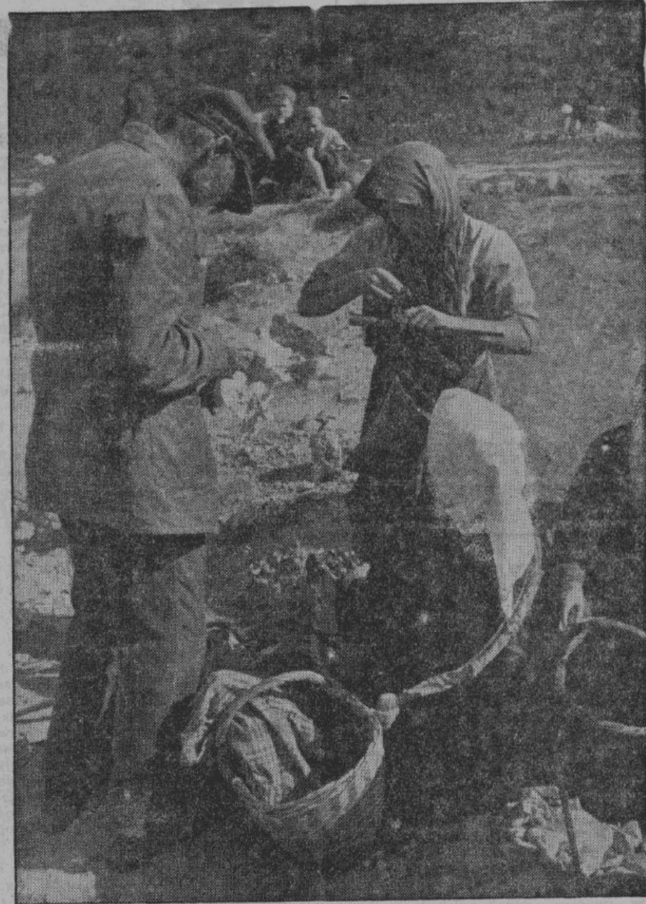
Каждая торговая сделка кончается взвешиванием товара и уплатой за него денег.

толпу и не верится, что еще год тому назад здесь хозяйничали большевики, забиравшие все в свои лапы и вытрававшие всякую частную инициативу.