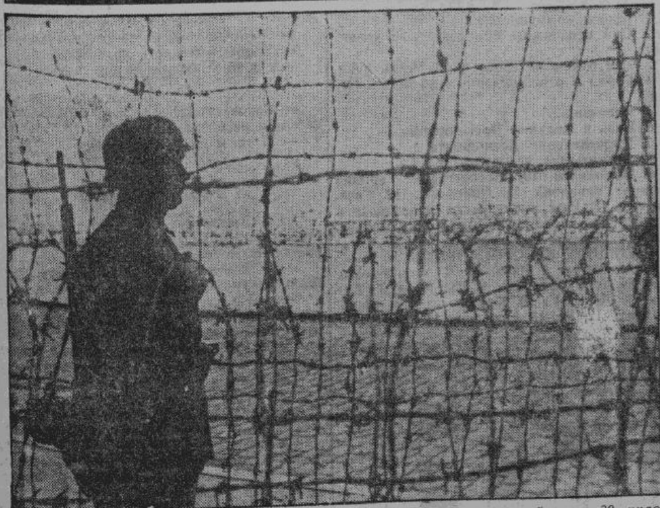
Англия от Европы отделяет узкий пролив Ламанш, местами имеющий всего 30 километров в ширину. Англичане уже неоднократно пытались через него переправиться, но после последнего поражения у Дьеппа, этого больше не повторится. Германцы сделали все возможное, чтобы обеспечить европейское побережье от попыток английского вторжения. На снимке — проволочные заграждения и германский часовой на побережье Ламанша