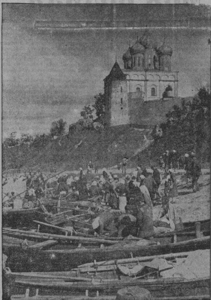
На псковском рынке царит такое оживление, что торговля происходит не только на суше, но и на воде. На снимке — красиво расположенный рыбный ряд псковского рынка на берегу реки Великой.