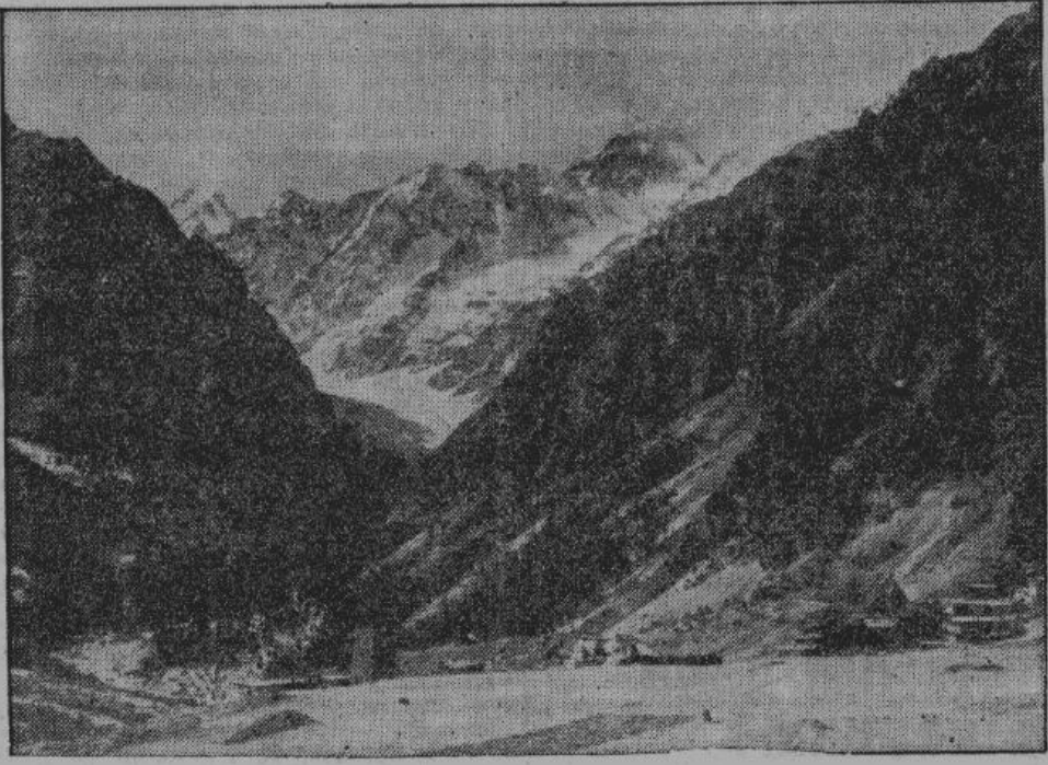
Типичный горный пейзаж Центрального Кавказа. На переднем плане — склон горы Верхний Цей, за ней в центре — снеговая вершина Адай Хох с Цейским глетчером.