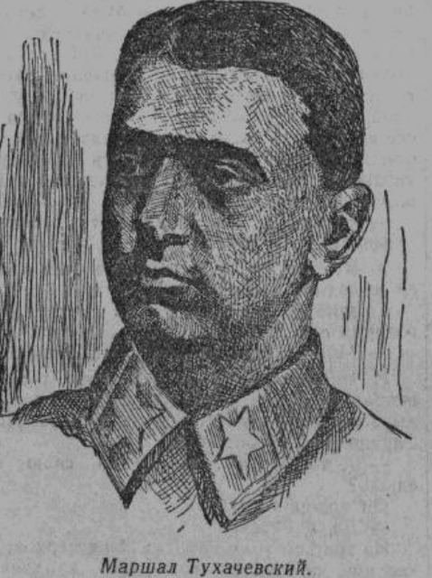
Маршал Тухачевский.

Заправили советской печати Главное оружие, которым борются иудеи с прочими народами всего мира, есть пресса. Пресса дает им возможность «обрабатывать» или «организовать» общественное мнение... Еврейская пресса доминирует в демократических государствах. В Советском Союзе