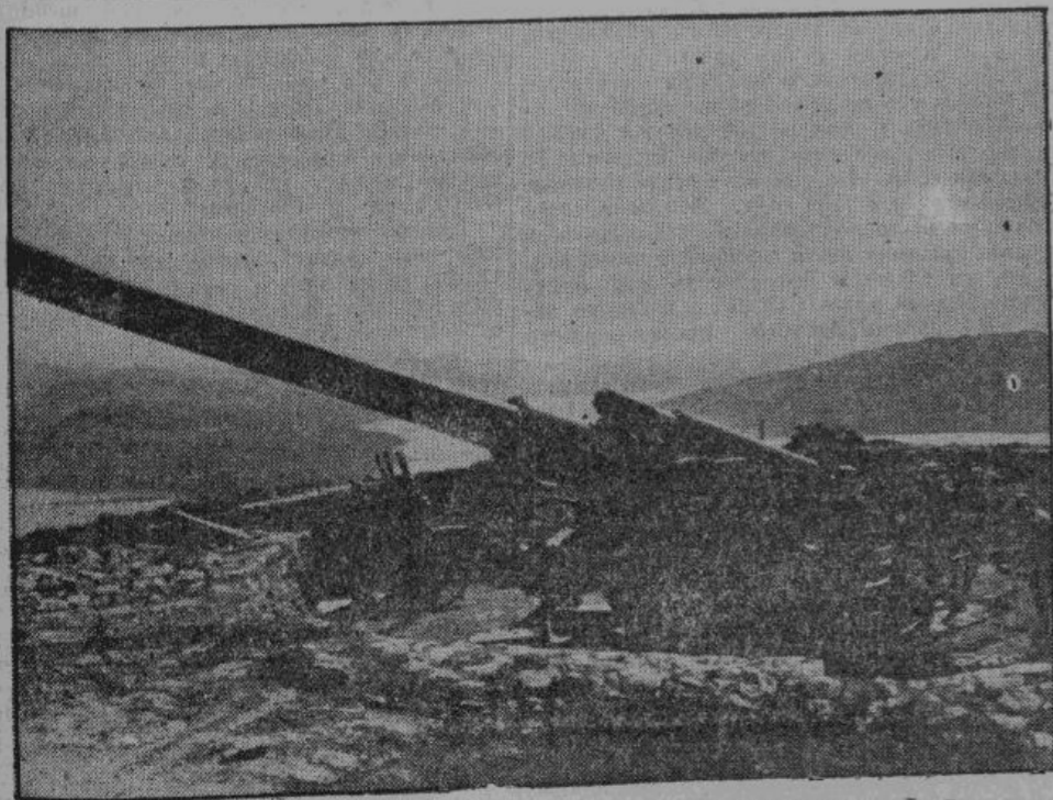
Германская батарея за полярным кругом. Германская армия охраняет берега Европы от Северного Ледовитого океана до солнечного Средиземного моря включительно. Англичане пытались прорвать этот оборонительный пояс, но эти попытки кончились их печальным поражением. На снимке — германская тяжелая батарея на одиноком пустынном острове в Северном Ледовитом океане.