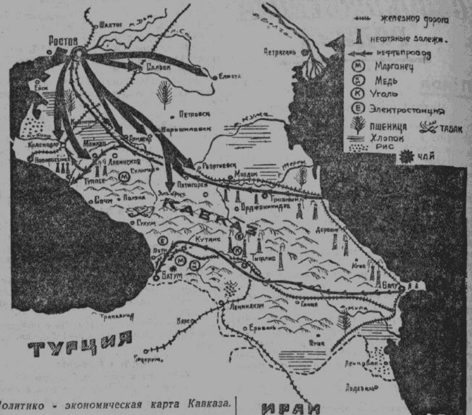
Политико-экономическая карта Кавказа. Стрелки, расходящиеся из Ростова, показывают направление главного удара германской армии.