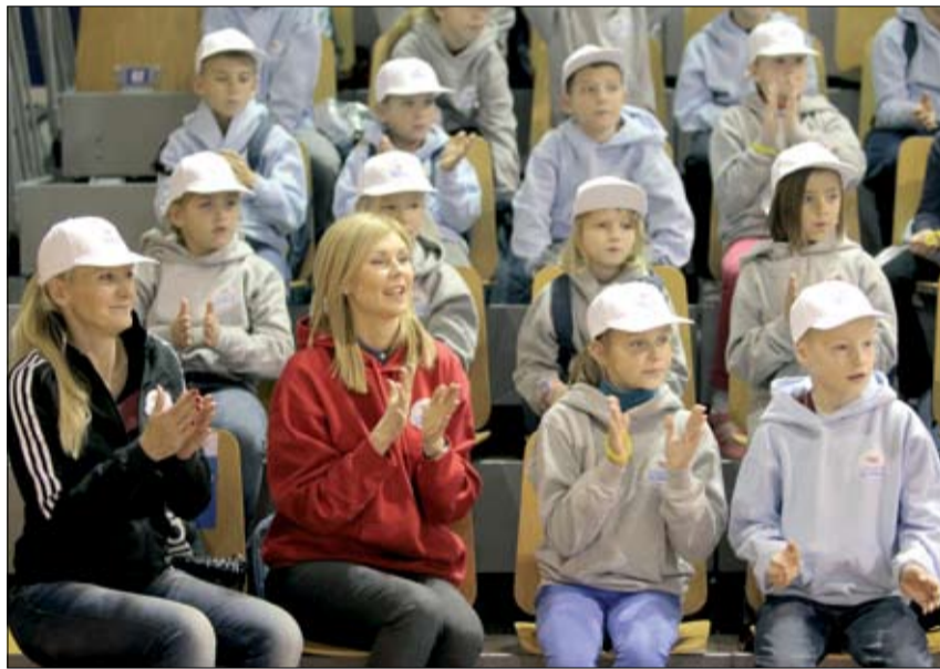
4. vidusskolas sporta klasi visa gada laikā pieskatīs bijusī vieglatlēte Ineta Radeviča, kura ir 2010. gada Eiropas čempione, 2011. gada bronzas medaļas ieguvēja, Atēnu un Pekinas olimpisko spēļu dalībniece, kā arī trīs gadus atzīta par Gada sportisti Latvijā.

Jelgavas 4. vidusskolas 3.c klase šogad olimpiskās skolotājas Inetas Radevičas uzraudzībā kļūs par Latvijas Olimpiskās komitejas (LOK) jaunā projekta «Sporto visa klase» dalībnieci. Projekts paredz iesaistīto skolu 3. klašu skolēniem katru nedēļu nodrošināt kvalitatīvu un metodiski atbilstošu trīs fakultatīvo sporta nodarbību iekļaušanu mācību programmā papildus tām divām sporta nodarbībām, kas paredzētas obligātajā izglītības programmā.