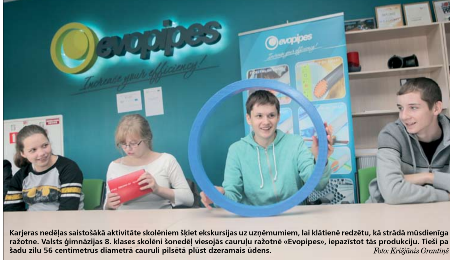
Karjeras nedēļas saistošākā aktivitāte skolēniem šķiet ekskursijas uz uzņēmumiem, lai klātienē redzētu, kā strādā mūsdienīga ražotne. Valsts ģimnāzijas 8. klases skolēni šonedēļ viesojās cauruļu ražotnē «Evopipes», iepazīstot tās produkciju. Tieši pa šādu zilu 56 centimetrus diametrā cauruļi pilsētā plūst dzeramais ūdens.