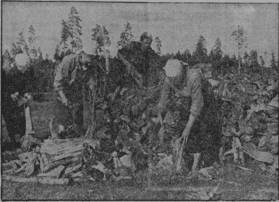
... большой горн наполняется доверху сосновыми корневищами. На снимке — рабочие разрабатывают корневища.

Возобновление работ на этой маленькой фабрике является опять таки доказательством того, что германские власти всецело стараются всюду восстановить хозяйство и устранить вред, нанесенный повсюду русской промышленностью Советами, вследствие их бессмысленной мании разрушения.