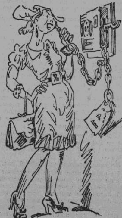
— Жюка? Здравствуй и прощай! Рис. автор.

срок приготовиться к эвакуации пешком. Рекомендовали «не увлекаться вещами» и по возможности, обеспечить продовольствием, но с таким расчетом, что его придется нести на себе.