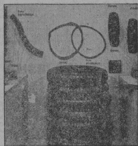
Автомобильные шины, изготовленные из искусственной резины «Буна», стираются значительно медленнее, чем шины, изготовленные из обыкновенной резины.

искусственного шелка, и, в особенности, впоследствии, искусственной шерсти. Искусственный шелк и искусственная шерсть родственны потому, что сырье — растительная целлюлоза, другими словами, дерево, солома и др. — одно и то же. Химический процесс изготовления почти тоже одинаков. Отличие состоит только в дальнейшей меха-