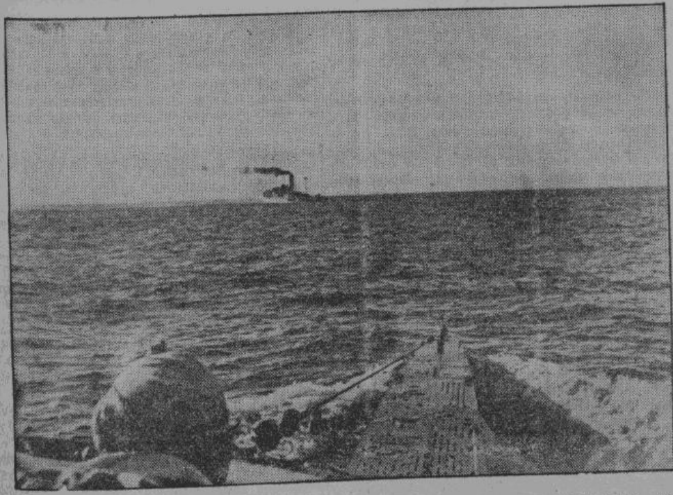
Еженедельные германские специальные сообщения гласят о вновь потопленных су- дах и каждый раз упоминают о судах, потопленных вблизи американского побережья. На снимке — германская торпеда попала в американский пароход. Подводная лодка исплавает на поверхность океана