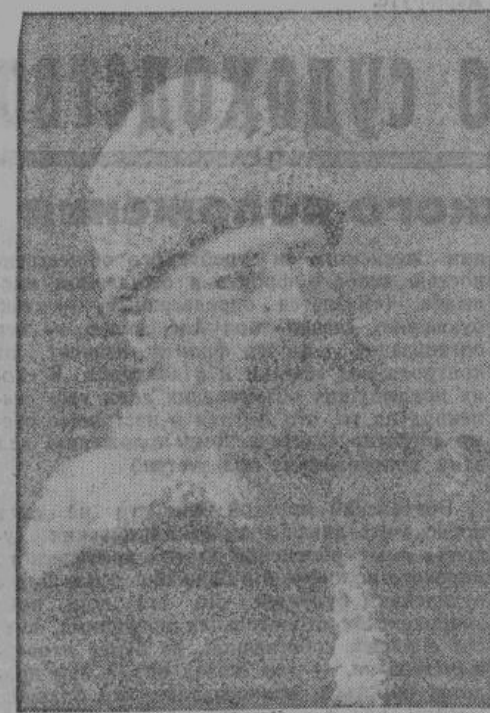
В. В. Верещагин.

В своих произведениях Верещагин всегда умел найти совершенно новый, никем до него не тронутый материал, темы культурного интереса. Один из замечательнейших