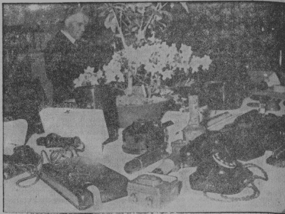
Телефонный аппарат, электрическая сушилка (надево) и целый ряд других предметов из пресовойной искусственной смолы.

Германские химики открыли много сортов искусственного каучука: буну С, пербулан, левулкан и другие. Каждому из этих видов присущи свои качества: они различно подвержены влиянию температуры, износу, трению, изоляции, действию бензина,