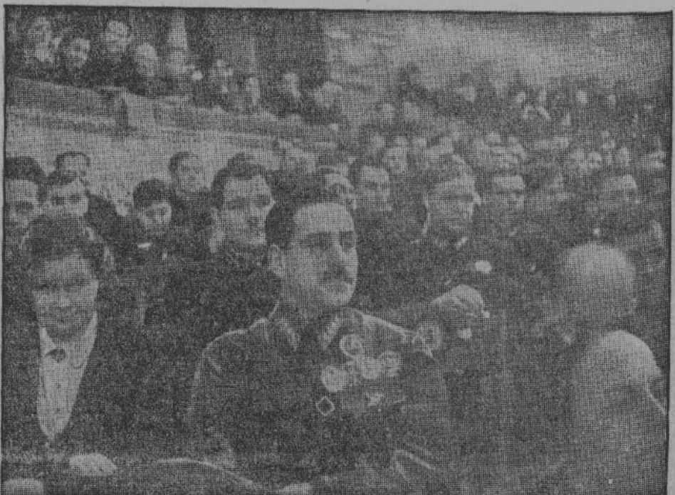
Главком на Дальнем Востоке, Блюхер, в большом театре в Москве