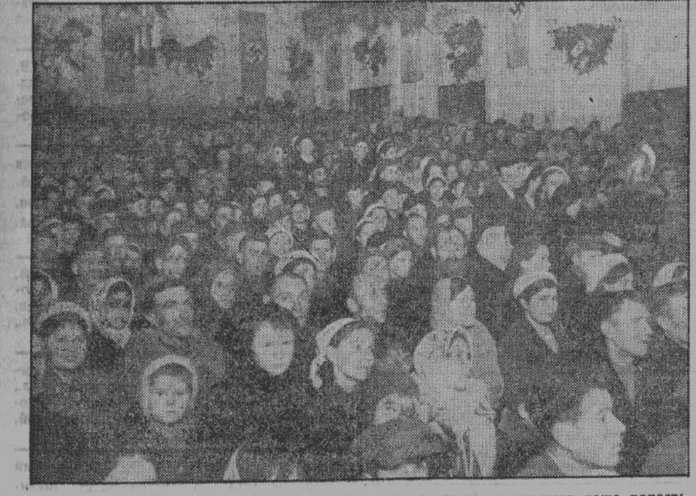
Зал был настолько переполнен, что многие желающие не могли туда даже попасть.

Все участники праздника жатвы в Острове остались довольны этим приятно и радостно проведенным днем и многие уже сегодня спрашивают, состоится ли такое же празднество в будущем году.