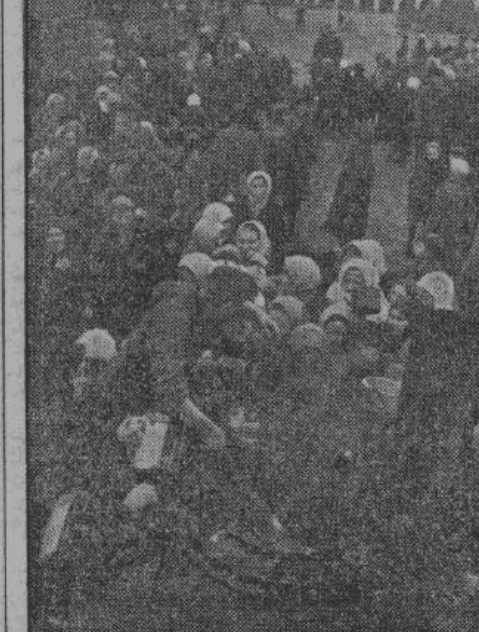
На базарной площади бесплатно выдавался обед из 5-ти походных кухонь...

тчение двух войн выдал много стран, над которыми пронеслась война, однако нигде он еще не видел такого количества разрушений, такой нищеты и бедноты населения, как та, которая была оставлена большевизмом, отогнанным германской армией. Вождь и главнокомандующий германской армией велел непосредственно за фронтом принять-