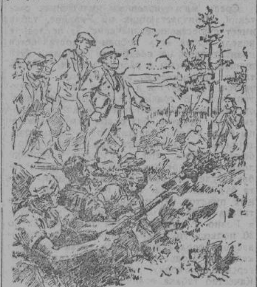
... нас в один из дней отправили за город рыть окопы

руками. Все со страхом и надеждой ждали немцев. И вот, 13 августа 1942 г., в Кисловодске вошли немцы. А через несколько дней я со своей подругой Михеевой — тоже ленинградской студенткой, получили пропуск в Псков к родным. Я не мечтала встретить родителей в городе, который, по словам большевиков, полностью разрушен немцами, а жители которого, якобы, все расстреляны. Какая же была наша радость, когда мы увидели свой город. Домик моих родителей стоял таким же, каким я его оставила полтора года тому назад. С замирающим сердцем подошла я к нему и постучала в знакомую с детства дверь. — Войдите, — услышала я дорогой мне голос матери. Я не выдержала: — Мама, — воскликнула я и бросилась в комнату, — мама милая... ты ли это... Мы плакали обе. Плакали от невыразимого счастья, от радости, что я снова дома у своих родителей. Вечером вернулся с работы отец. Он также, как и мать, не думал меня увидеть. Теперь я уже шесть дней как в Пскове. Присмотрелась к городу, собираюсь поступить на работу. Не могу сидеть дома, когда нужны рабочие руки, и когда все трудится. В. Блюм