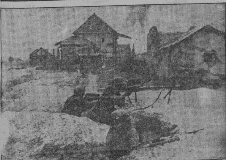
Центр Сталинграда и крупные промышленные предприятия уже находятся в германских руках. Бой еще происходит за отдельные кварталы и за отдельные дома, в еще занятых небольших пригородных районах. На снимке — картина боев в одном из сталинградских пригородов, где каждый дом превращен в крепость.