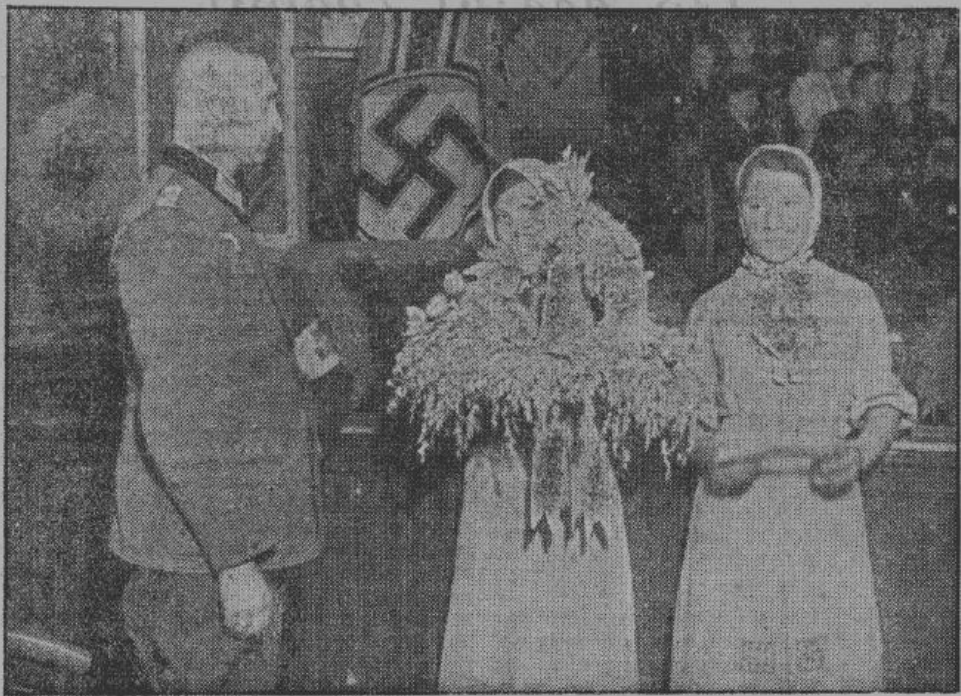
...две девушки подошли к германскому начальнику хозяйственной части и предложили ему урожайный венок

за восстановление хозяйства. Предпосылки для этого сегодня уже созданы германской армией. Необходимо однако работать с полным напряжением сил, для того, чтобы русское население могло добиться желаемого улучшения своих жизненных условий.