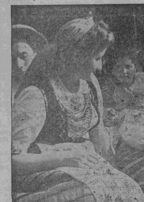
Группа участников в белорусских национальных костюмах на празднествах по случаю освобождения Белоруссии от большевиков