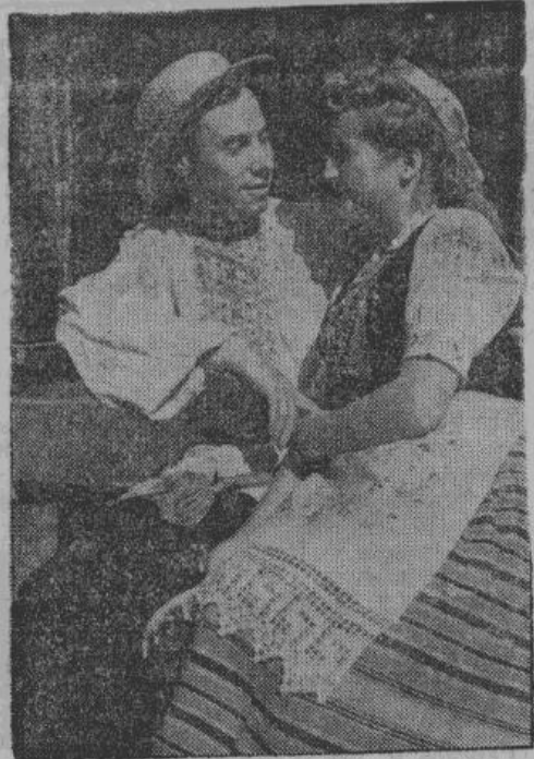
— Прямо не узнать тебя, как хороша ты в своем новом наряде...

девушек — полотенцем с узористыми концами, обвязанным вокруг головы в виде венка и концами свали. Часто девушки никакого головного убора не имеют, как признак девицества. Зато они часто вышивают на разнообразных цветах белорусских полей, а разноцветные бусы украшают их грудь.