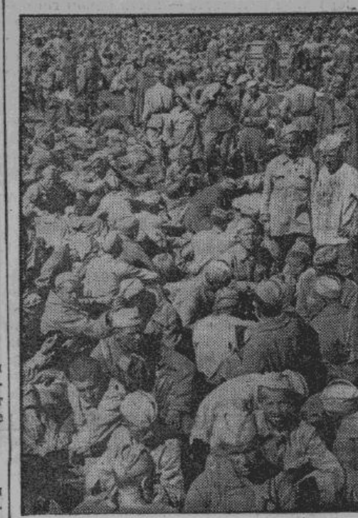
Они спасены от смерти. Число советских пленных растет со дня на день

Московский корреспондент «Таймса» делится впечатлениями, в связи с большим разочарованием большевиков, вызванным безуспешными переговорами Сталина с Черчилем. Настроение в Москве, — продолжает американский журналист, — подавленное и напряженное. У газетных киосков толпятся люди в ожидании новых вестей, так как