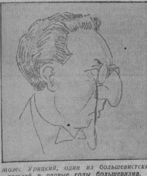
Мозес Урицкий, один из большевистских вождей в первые годы большевизма.