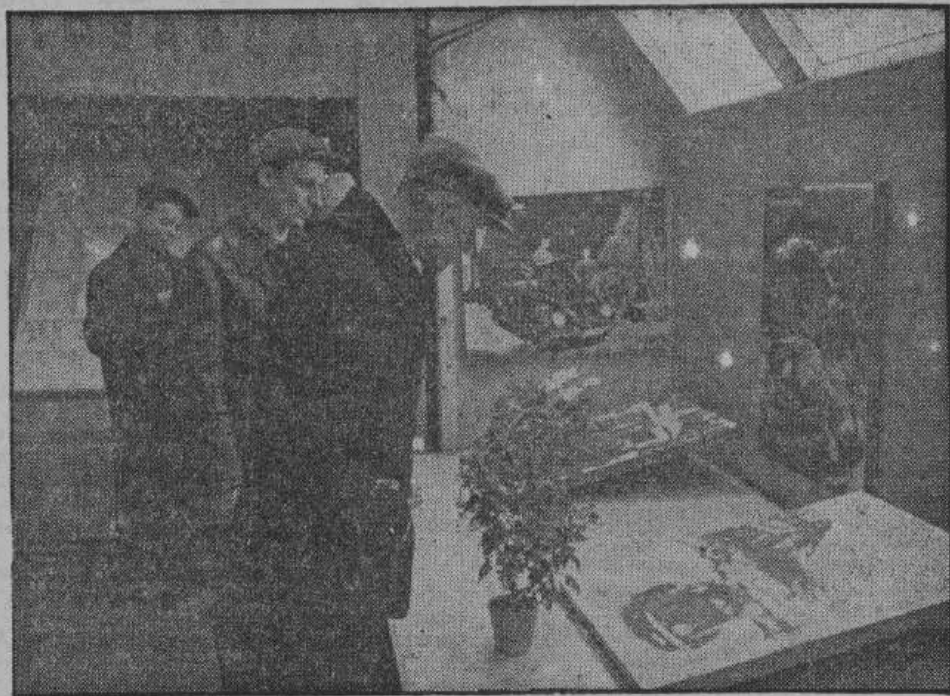
Русские крестьяне осматривают снимки, сделанные в Германии