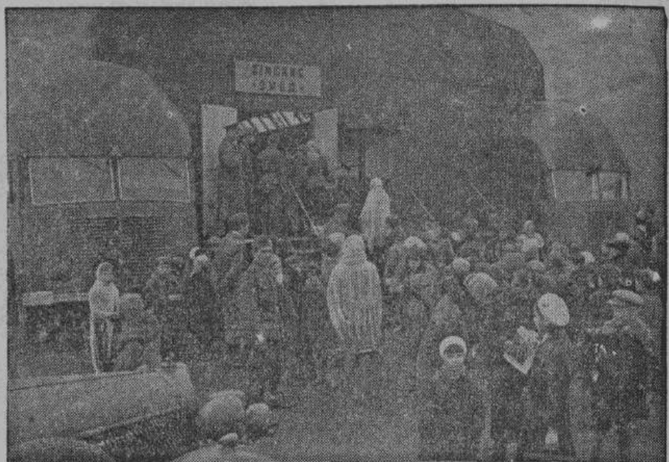
Тотчас же после открытия выставки, являющейся грандиозным обозрением, к ней устремляются массы взрослых и детей

Германская архитектура, театр, спорт, художественные ремесла, игры — все эти экспонаты напоминают какую-то волшебную сказку. И сознаешь с горячкой, заливающей сердце, радостью: теперь и мы — какая-то частица этого чудного мира!