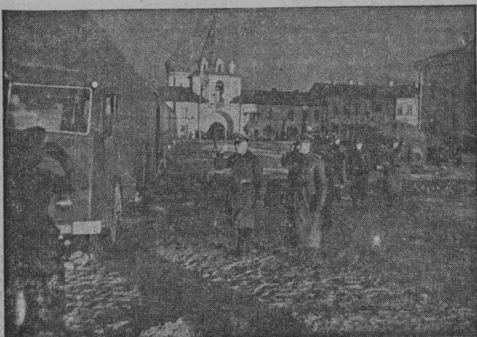
Грандиозная передвижная выставка прибыла в Псков. В момент прибытия она была встречена германскими властями, чтобы на следующий день широко открыть двери для осмотра русским населением.