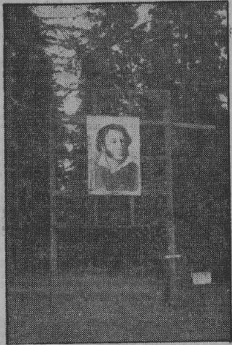
Арка, увенчанная декоративным портретом Пушкина, — главный въезд в усадьбу

«Вышел из лицея — читаем в его воспоминаниях — я тотчас уехал в псковскую де-