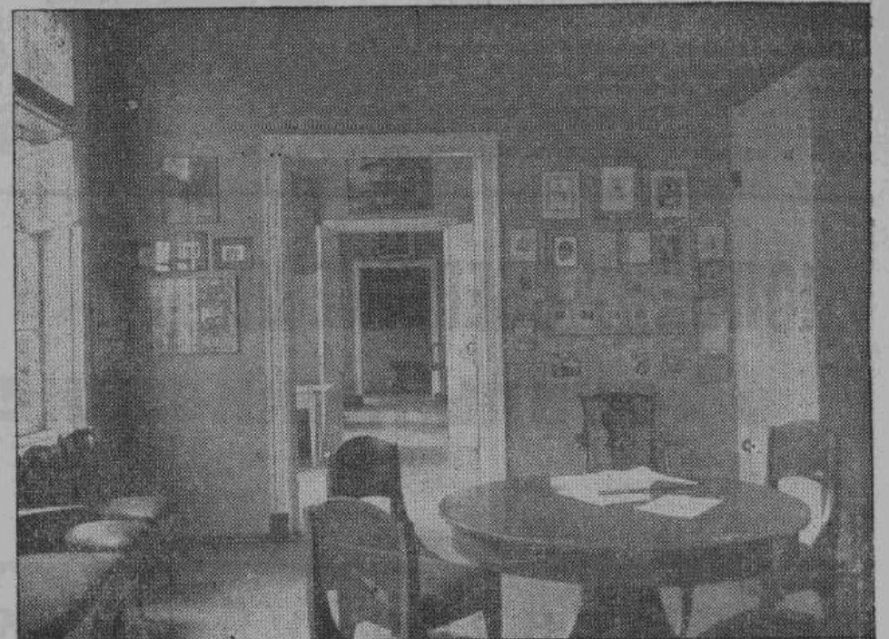
Пушкинский литературный музей в с. Михайловском. Экспозиция к элегии 1835 г. «Вновь я посетил». На правом простенке ближайшие сотрудники пушкинского «Современника»