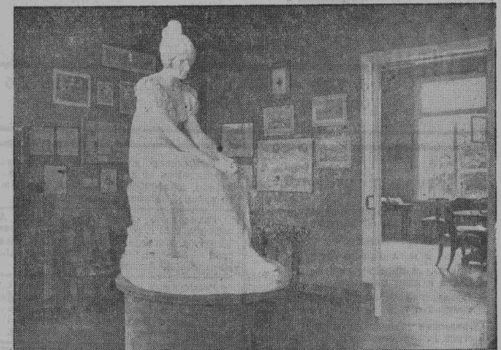
Пушкинский литературный музей в с. Михайловском. В центре зала — «Татьяна Ларина» — скульптура Дилона. На стенах экспозиция к написанной в Михайловском народной драме «Борис Годунов»

(Все снимки музея сделаны летом нынешнего года).