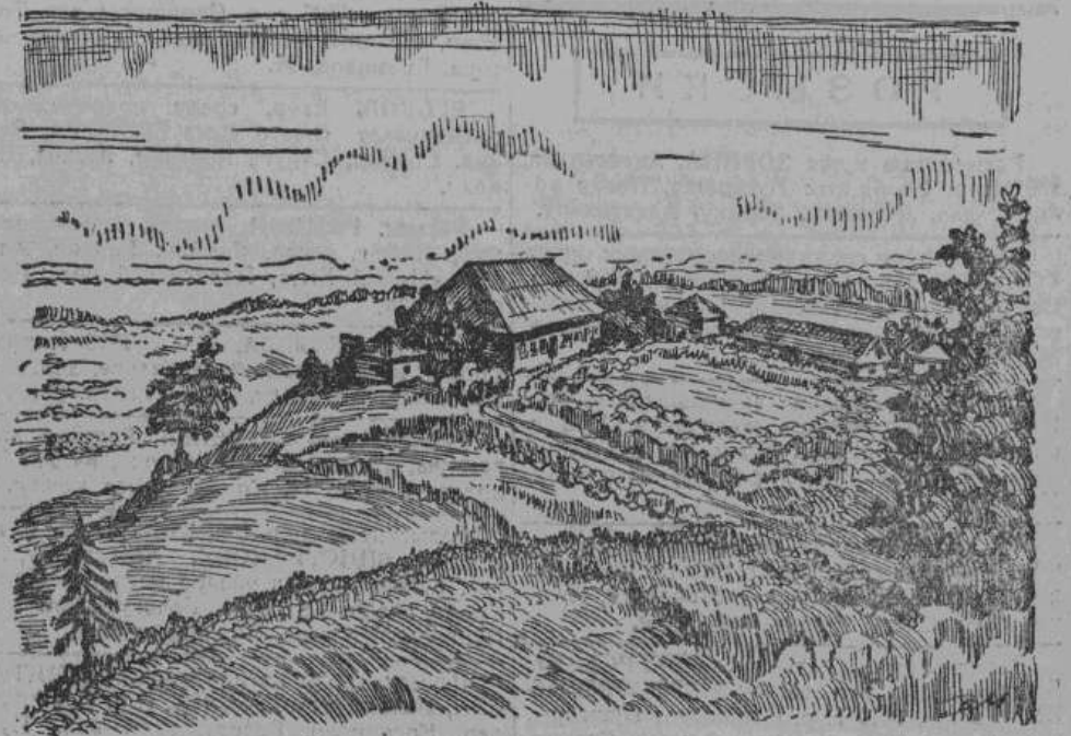
Общий вид сельца Михайловского 30-х годов прошлого века, с литографии Иванова.