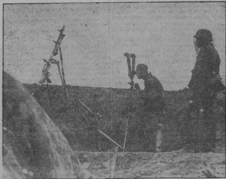
Атаки большевиков, предпринятые между Ржевом и Ильменским озером, разбились о стойкость германского фронта. На снимке — германский наблюдательный пункт на железнодорожной насыпи в районе Ильменского озера