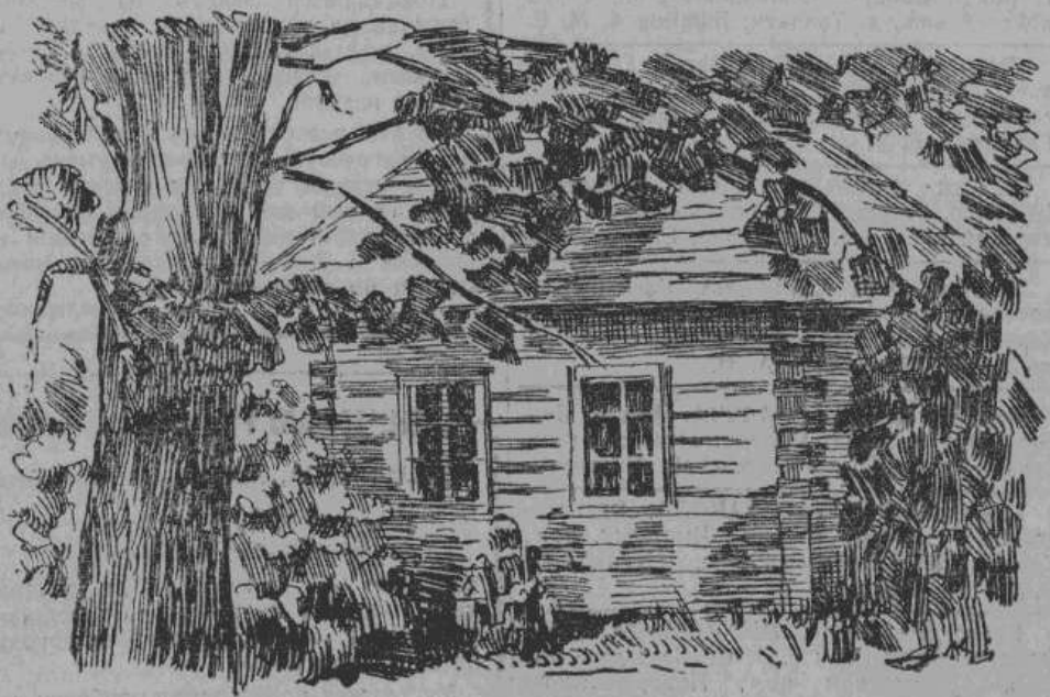
Домик няни Пушкина — единственный мемориальный памятник пушкинских времен, сохранившийся в Михайловском. Рис. Максимова

(Все снимки музея сделаны летом нынешнего года).