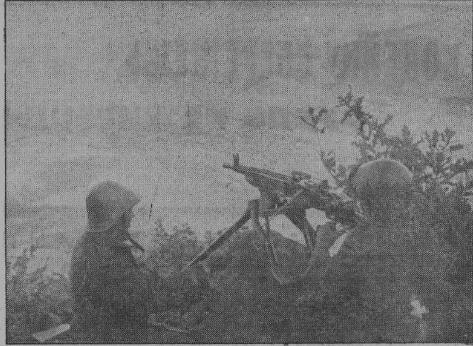
Румынские пулеметчики на передовых позициях фронта