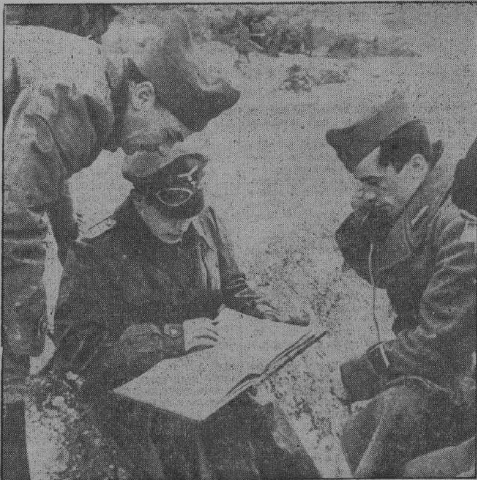
На командном пункте испанских добровольцев на восточном фронте. Командир роты принимает донесение и отдает приказание