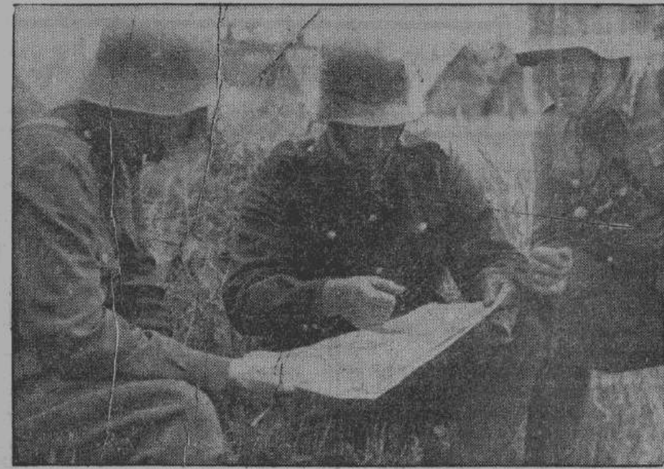
Командир батальона датских добровольцев дает своим ротным командирам боевую задачу