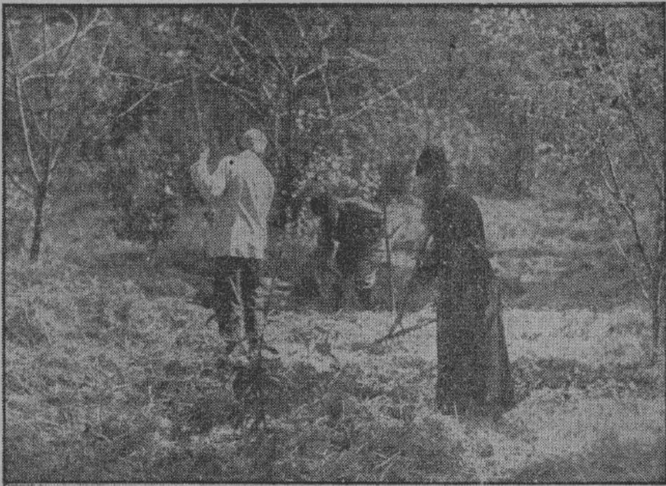
Монахи в черных подрясниках работают в монастырском саду.