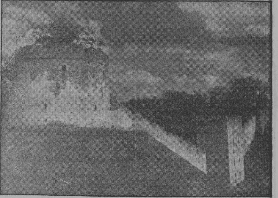
Укрепленная стена и вид на долину, где стоит массивная башня, под которой оставлен небольшой проток для ручейка.