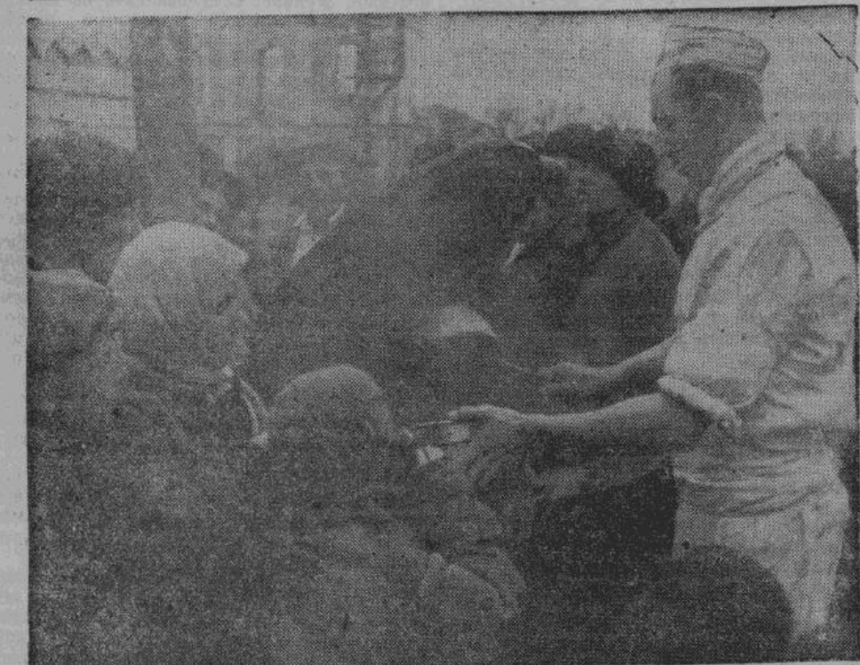
Гражданское население, бежавшее от большевиков, получает помощь и питание со стороны германской армии. Солдаты германской освободительной армии докладываются каждому случаю, чтобы помочь русскому населению.