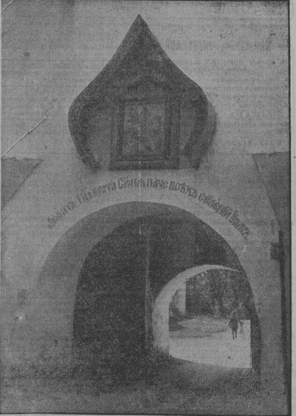
Башня у главного входа в древнерусском стиле с иконой Богородицы с Младенцем