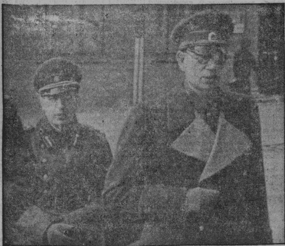
Генерал-лейтенант А. А. Власов в сопровождении своих офицеров совершает поездку по освобожденным областям России