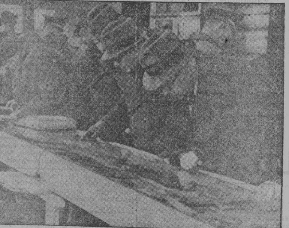
Бесчисленные предметы, необходимые для установления личности и собранные здесь под стеклом, облегчают работу соответствующих учреждений в Катынском лесу.

Метя и почувствует глубокое возмущение, увидя приводимые нами снимки Катынского леса под Смоленском, где были убиты 12.000 польских офицеров. Жидовские гаври карательных отрядов безжалостного НКВД зверски расправились с ними и как «козелшную скотину» побросали в ямы. Мы, русские, знаем, что это преступление, о котором одна из распространеннейших европейских газет пишет, что открытие могил ставит человечество перед решительным вопросом — не является ли самым большим, и ужасным в списках расправ НКВД, совершенных чекистами над безоружным населением. История страданий нашего народа за последние 25 лет приводит много примеров преступ-