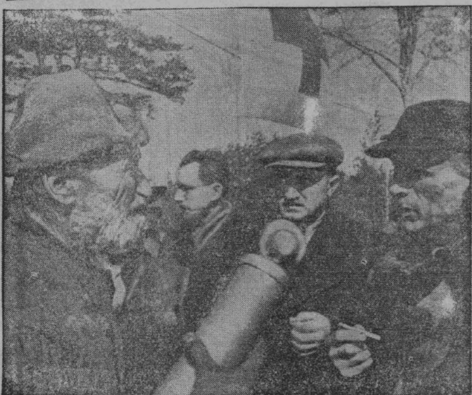
Русский крестьянин, давший первым показания об убийстве 12.000 польских офицеров, передает в микрофон свои впечатления, находясь непосредственно на месте этого преступления