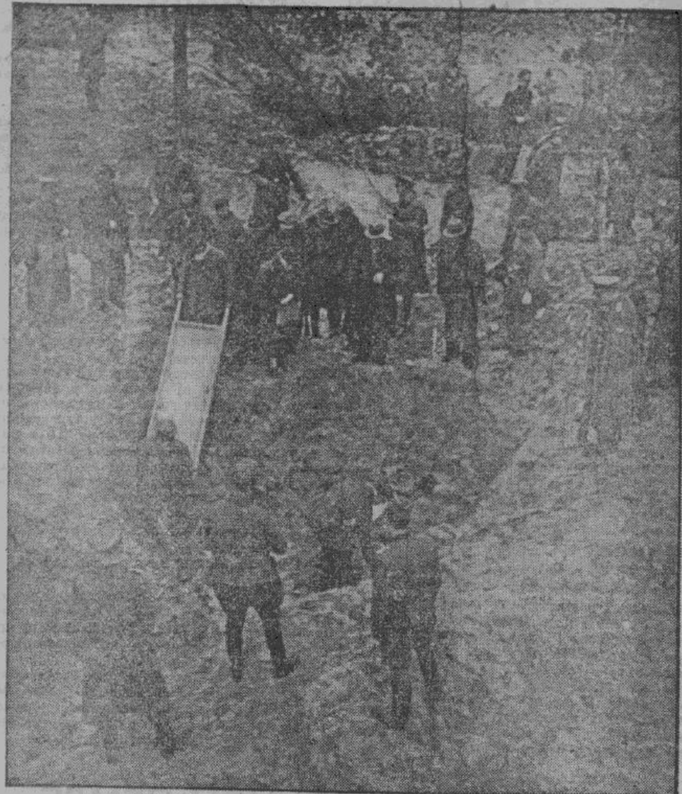
Трупы убитых поднимаются на поверхность земли

Люблин, 4/5. В Люблине, где проживал известный польский генерал Смравинский, опознанный среди жертв Катынского леса, известие о нахождении тела этого офицера вызвало понятное возмущение. Потрясающее действие это известие произвело на жену и обоих детей генерала, 18-летнего сына и 20-летнюю дочь, которые до сих пор надеялись, что муж и отец все же вернется домой после войны. Один из люблинских служащих полиции был вместе с убитым генералом в плену, но потом, при обмене пленными, спасся таким образом от верной смерти. Он рассказывает, что с генералом Смравинским находился сначала в лагере для военнопленных в Талице, где насчитывалось 16.000 человек, а после у финской границы, в бывшем монастыре у Осташкова. В этом монастыре, находящемся на маленьком острове, условия жизни и питания были настолько ужасны, что при посещении его маршалом Буденным, генерал Смравинский выступил из ряда выстроившихся для осмотра военнопленных и подал жалобу о невыносимых условиях. После этого в лагере устроили примитивную баню и дезинфекционный пункт, а потом офицеры были отделены от солдат. 18 декабря 1939 года генерала Смравинского, вместе с другими офицерами, исключая только вышеупомянутого жандармского офицера, перевезли в Козельск.