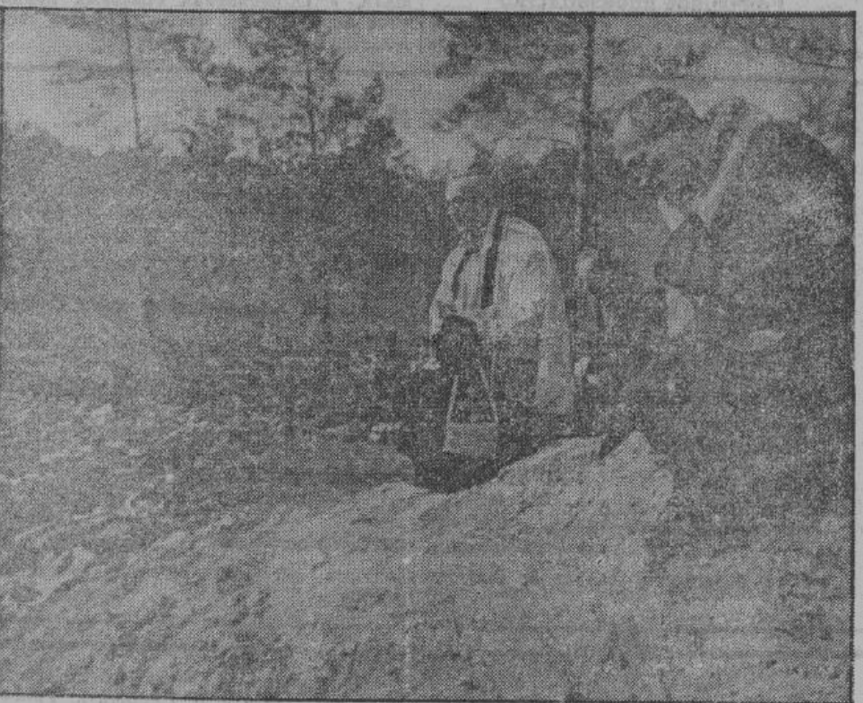
Бесконечных рядов убитых возносятся могилы.