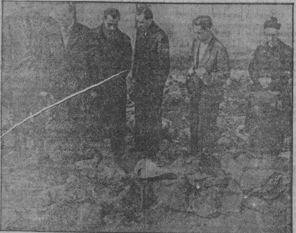
Комиссия по установлению личности расстрелянных за работой.