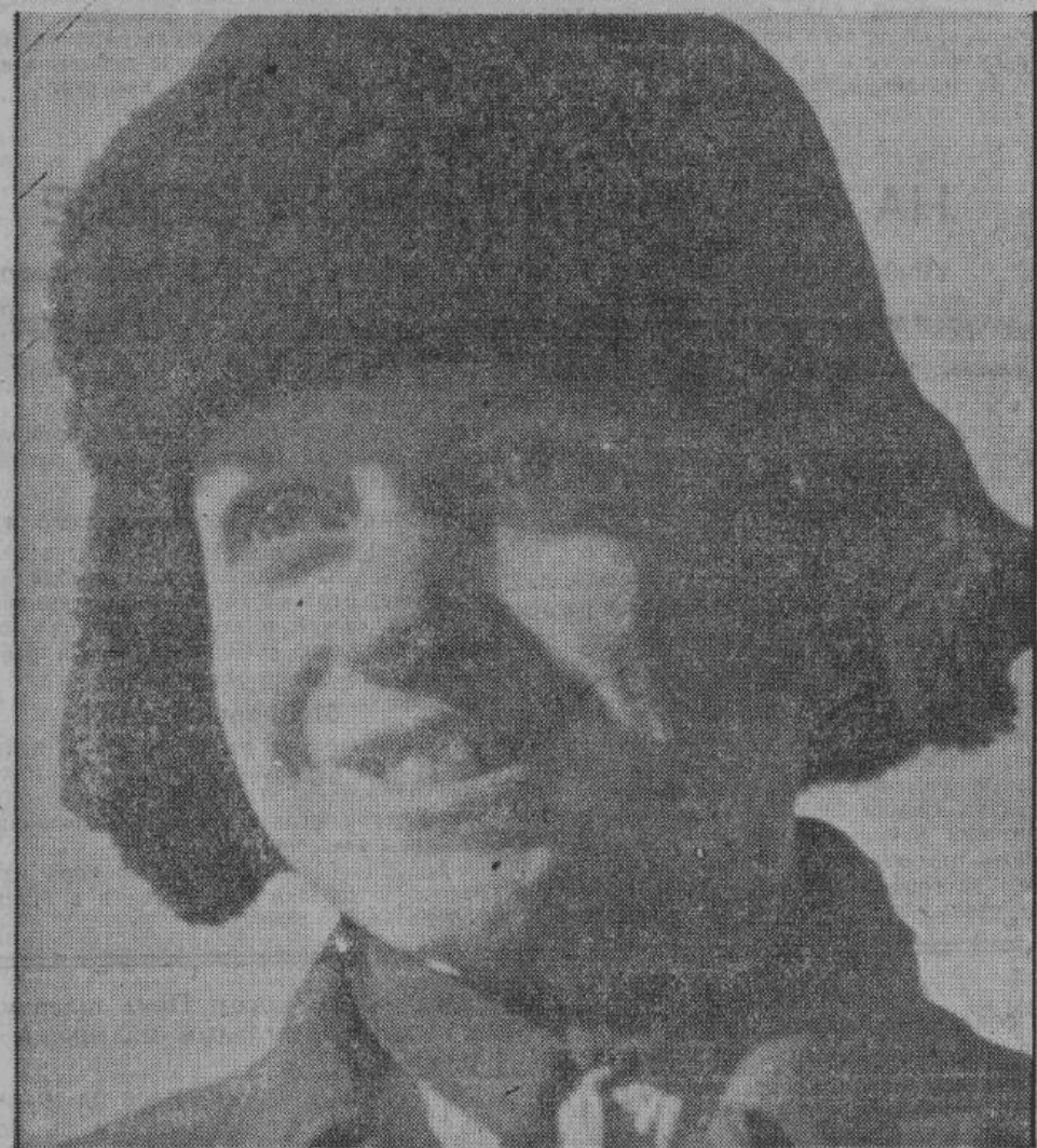
Русская крестьянская молодежь освобожденных областей