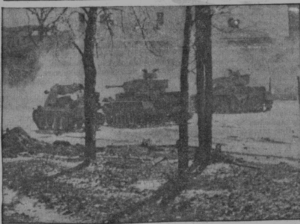
Танки из своих орудий обстреливают дом, превращенный в крепость. Этим они освобождают дорогу штурмовым отрядам, которые медленно продвигаются вперед, беря с боя каждый дом и улицу. Их действия поддерживаются с воздуха штурбом.