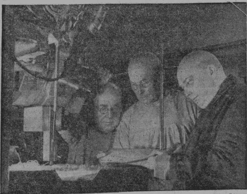
Германия в борьбе с большевизмом сконцентрировала все свои силы в военной промышленности, чтобы нанести этим сокрушительный удар по мировому врагу. Тысячи людей, вышедшие уже в пенсию, вновь стали на работу, чтобы этим помочь в титанической борьбе с большевизмом. Трех специалистам, на снимке, в общей сложности 216 лет, но, несмотря на такой преклонный возраст, они сочли своим долгом принятись снова за работу и своим трудом облегчить победу над Сталиным