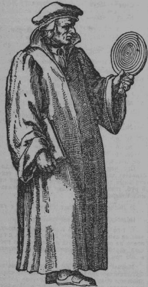
Николай Коперник учил, что не солнце движется вокруг земли, а земля вокруг солнца. (Гравюра Теодора де Бри 1580 год).

В прошлом году весь мир праздновал торжество, посвященное памяти великого итальянского естествоиспытателя Галилео Галилея. Теперь, 24 мая 1943 года, будет отмечено 400-летие со дня смерти великого германского астронома Николая Коперника.