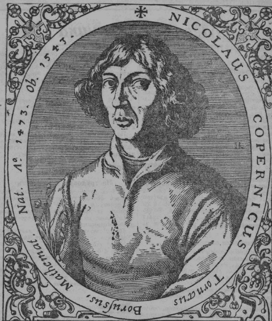
Николай Коперник (современная гравюра).

Вернемся теперь из долины По в Эрмланд, омываемый прозрачными водами Балтийского моря. Равнина простирается далеко на север; в воде отражается великое спокойствие звездного неба, к которому Коперник так часто обращал свой взор, пока он, наконец, не пришел к убеждению, что земля вертится вокруг солнца. Это убеждение противоречило церковному учению того времени. Поэтому великого астронома многие преследовали издевательскими, но он остался верен своему открытию и на все обвинения неизменно отвечал, «а все таки она вертится».