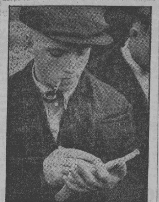
Автор статьи И. В. Баролин

Рабочий зарабатывает в месяц от 240 до 400 марок. В сравнении с существующими ныне в Германии ценами на товары этот заработок во много раз выше заработка советского рабочего. Вот для примера некоторые цены: костюм мужские от 42 до 75 марок, пальто мужское от 46 до 80 марок, ботинки от 14 до 18 марок, хлеб один килограмм — 32 пфеннига, сахар 1 килограмм