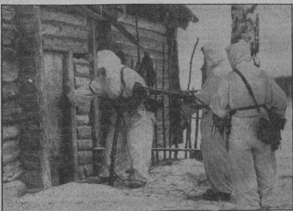
В виду коварных и подлых методов, применяемых большевиками в бою, надо соблюдать величайшую осторожность. На снимке: германский ударный отряд внимательно осматривает каждый занятый дом.