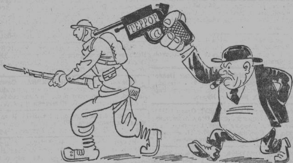
Лавры Сталина не дают покоя Черчиллю