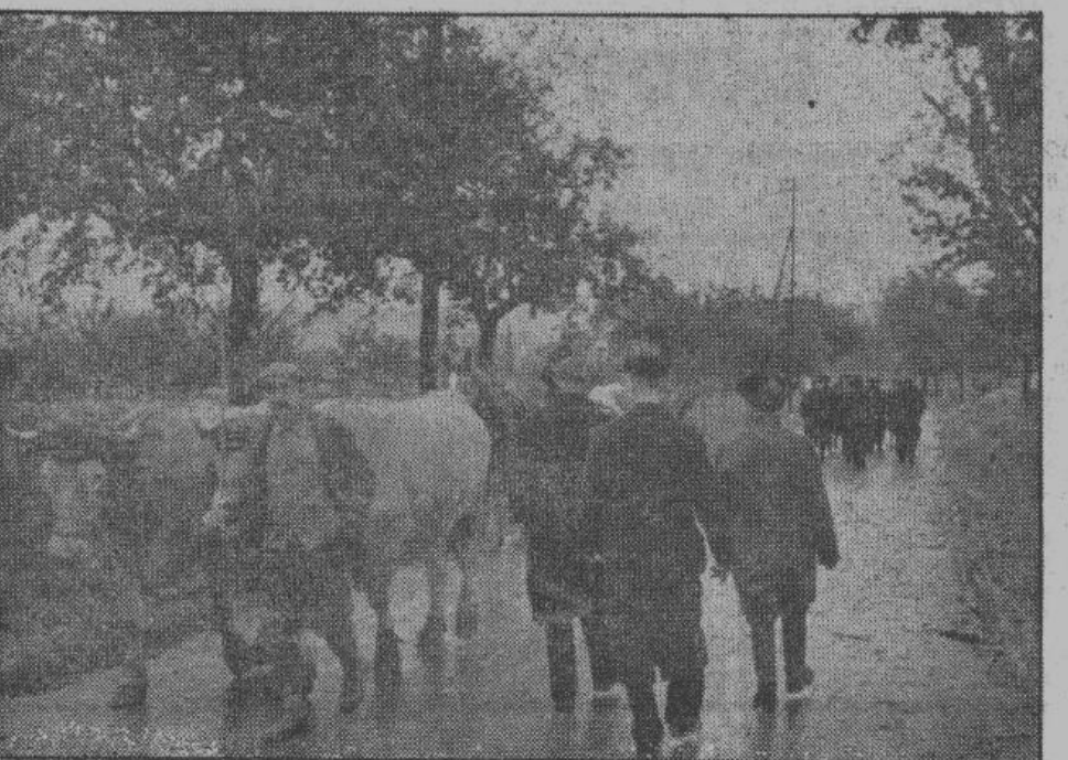
«Германия — это страна садов, железных дорог и первоклассных шоссе дорог, обсаженных фруктовыми деревьями». — На снимке — русская крестьянская делегация на дороге встречается с немецкими крестьянами, идущими на полевые работы.