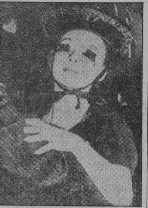
Сумасшествие — самое главное! Эта танцовщица вместо ресниц приклеила себе спички. У нее в Америке много последователей

ский трест» — жестоко, совершенно не американское мероприятие, выдуманное правительством! Неслыханное вмешательство в нашу хозяйственную жизнь! — воскликнул мистер Уиллики. Представители крупного капитала и крупной промышленности поддержали мистера Уиллики с энтузиазмом и от имени 17 электрических трестов был начат процесс против правительства, обвиненного капиталистами в незаконных действиях... Процесс вызвал колоссальный интерес. А обвинительная речь Венделя Уиллики произвела огромное впечатление.