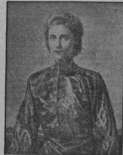
Клер Бус — жена миллионера и издателя американских журналов «Лайф» и «Тайм», прославившаяся своими интригами и политическими выступлениями