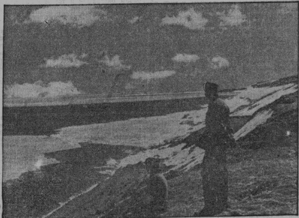
Бойцы Русской Освободительной Армии у Ильменского озера. Здесь раньше находились их зимние советские позиции, откуда они перешли на сторону германских войск, для борьбы против Сталина. Теперь они снова здесь, чтобы с оружием в руках, под знаменами РОА бороться с большевическими притеснителями — врагами русского народа.