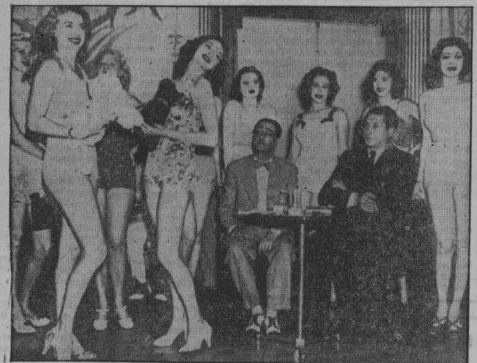
Не искусству, а низким инстинктам служит американский фильм. Американские жида — руководители фильмой промышленности, по системе конвейера производят «художественные картины»

(Восьмое продолжение следует 11-го июня)