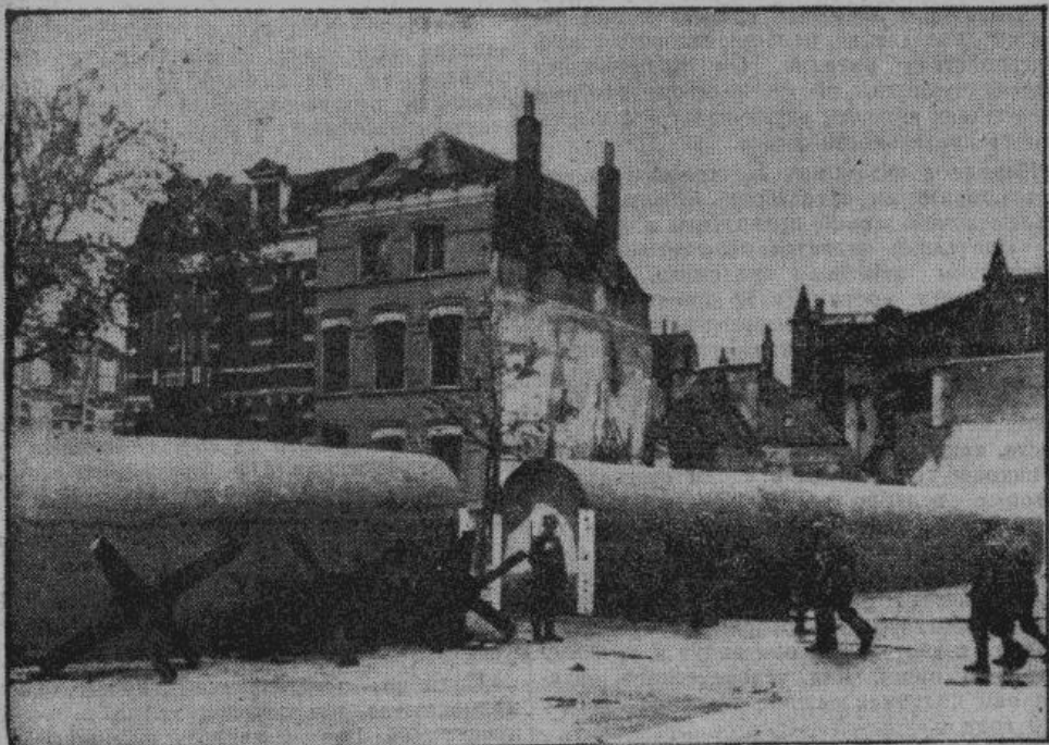
Неустанной работой побережье Европы превращено в неприступную твердыню, о которую разобьются все попытки десанта англо-американских плутократов. На снимке — противотанковые заграждения в порту одного из городов на побережье Ламанша.