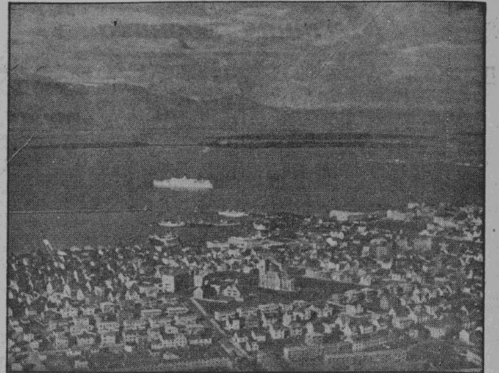
Порт и залив Рейкьявика — столицы Исландии, оккупированной с июля 1941 года войсками США. С этой страной американцы обходятся не лучше, чем с эксплуатируемой колонией.