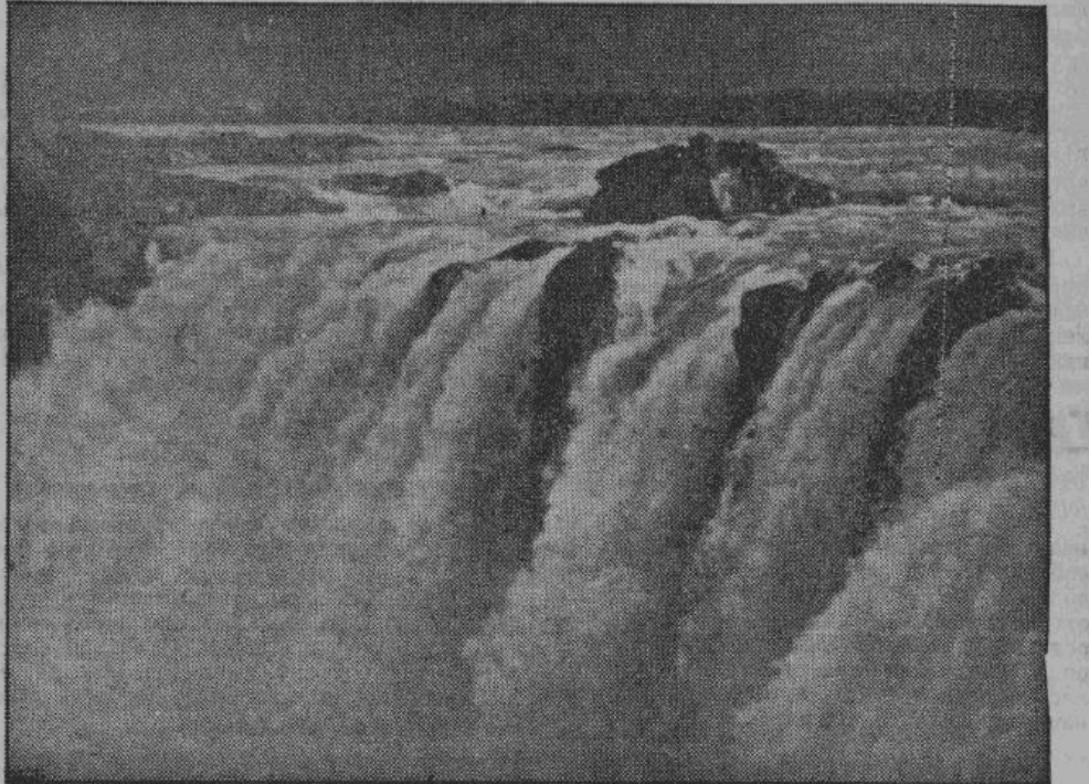
Годфосс — «Божий водопад» — один из прекраснейших и величайших водопадов Исландии. Наряду с гейзерами, многочисленные водопады являются характерной достопримечательностью пейзажа