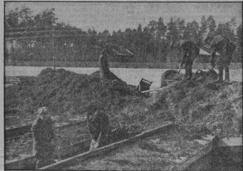
В сельскохозяйственной школе в Черныковичах на практических занятиях по овощеводству.