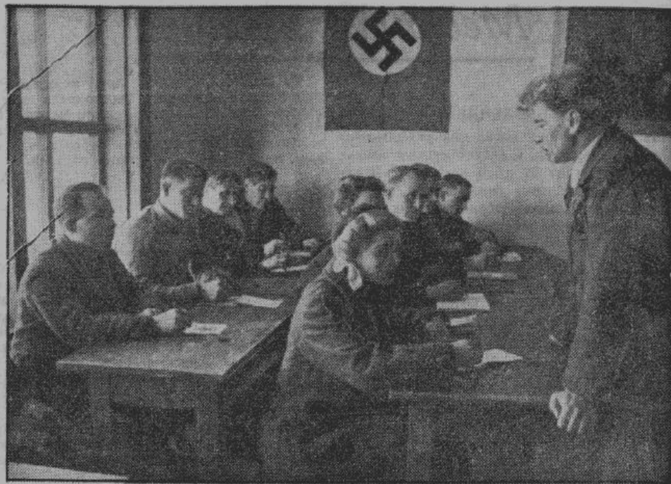
Слушатели Бесседовской сельскохозяйственной школы записывают лекции преподавателя.