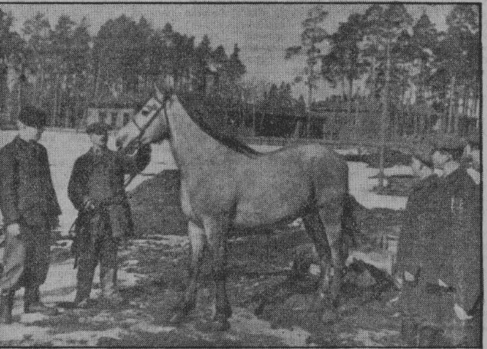
Слушатели Черныковичской сельскохозяйственной школы осматривают жеребца-производителя.