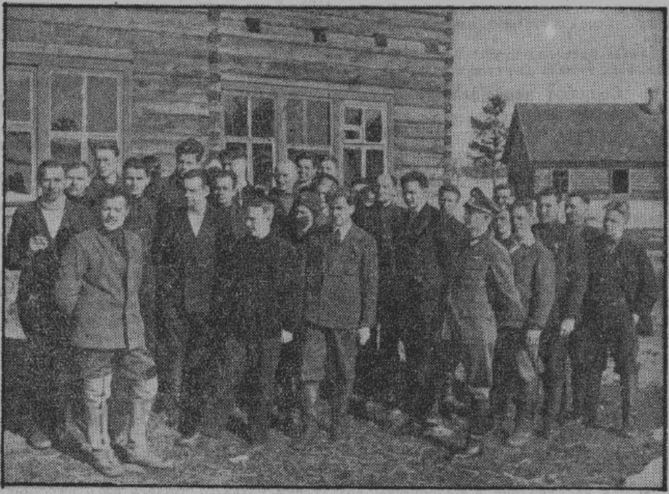
Первокурсники сельскохозяйственной школы в Бесседе со своими преподавателями.