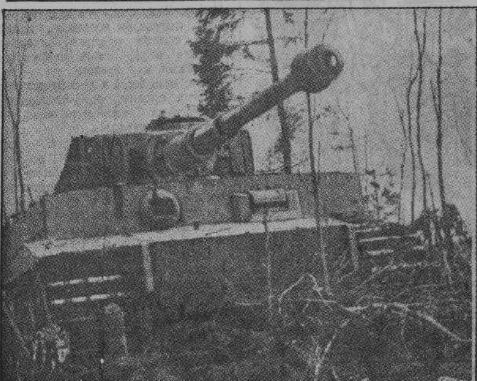
Новый могучий германский танк «Тигр» доказал на Восточном фронте свое превосходство. Для него не существует преград. Он с легкостью преодолевает все препятствия; стены домов, деревья и другие преграды рвутся под его мощным натиском. Огнем своих орудий «Тигр» уничтожает большевицкие танки, огневые точки и наводит ужас на неприятеля.