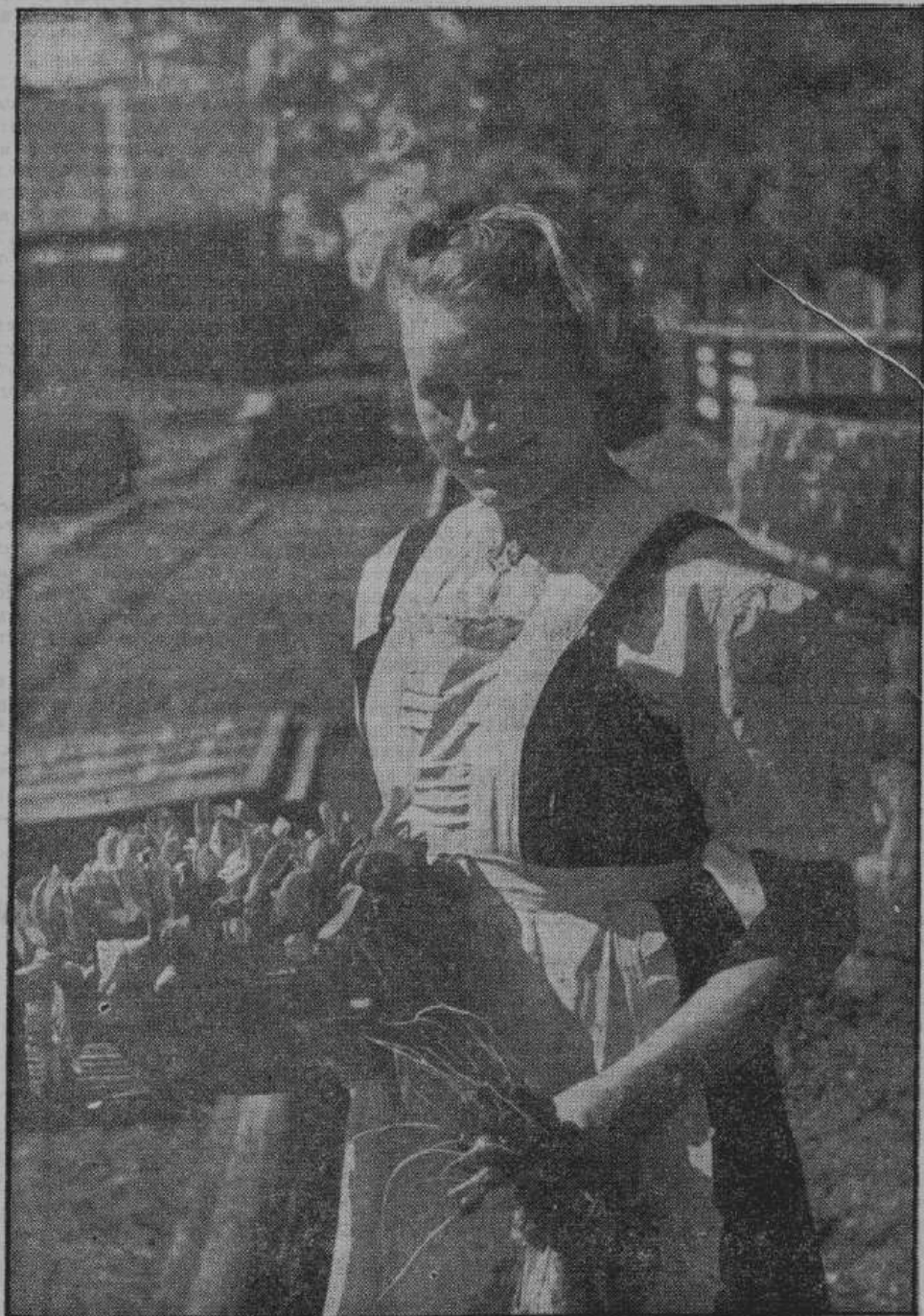
Заботливый уход за парниками щедро вознаграждает хозяев ранними овощами. На снимке — молодая огородница с первым редисом и салатом в одном из пригородных хозяйств Пскова.