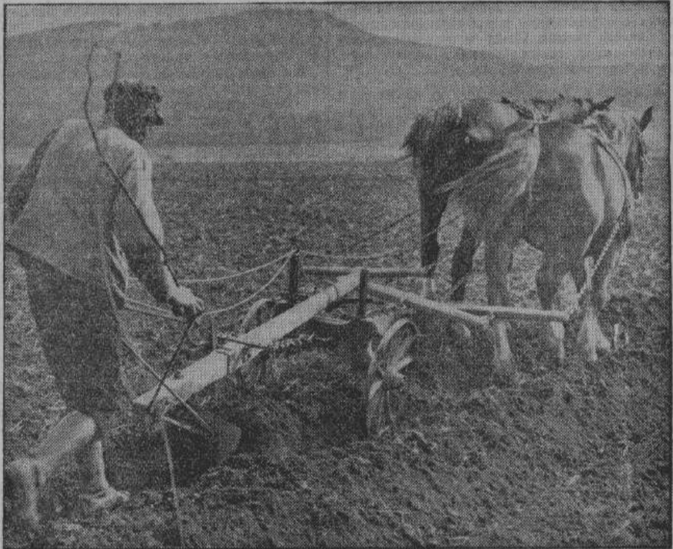
Русский крестьянин — самостоятельный хозяин на собственной земле