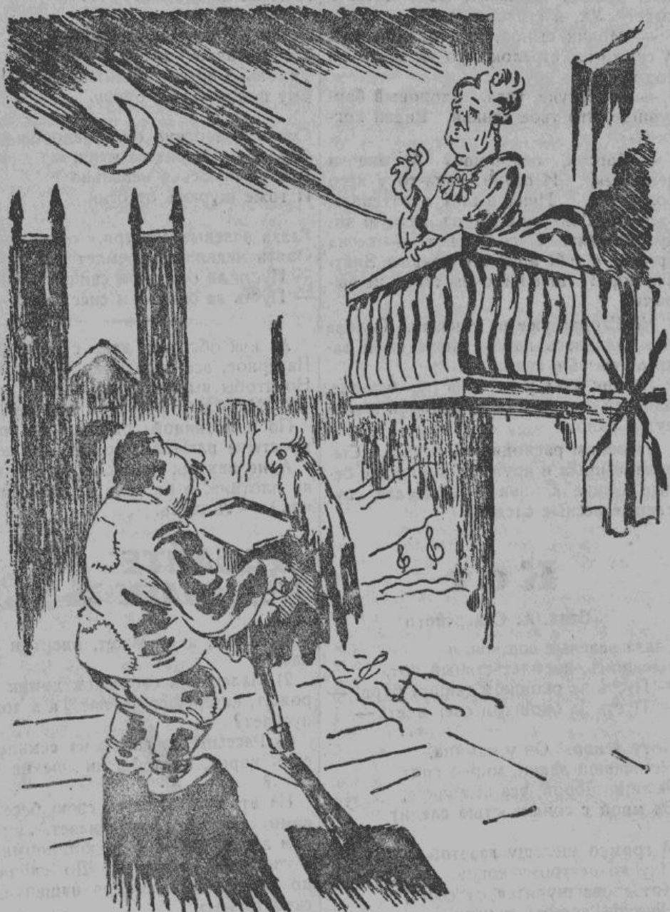
Сталин (Черчилль): «Зачем ты, безумная, губишь того, кто увлекся тобой...»