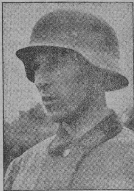
Один из многих русских добровольцев, борющихся теперь в рядах германской армии за освобождение русского народа от большевизма