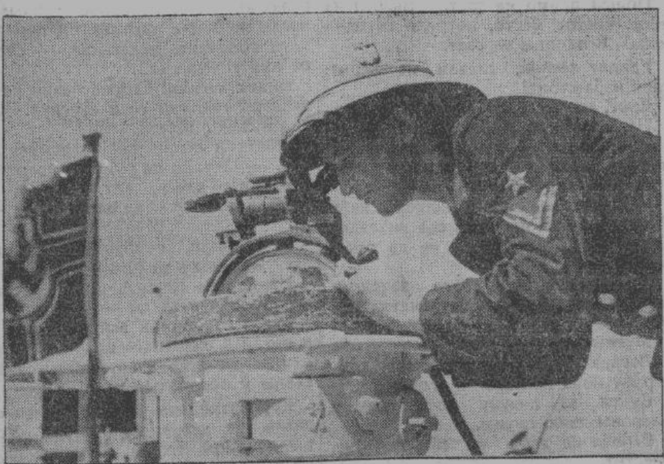
Многие месяцы продолжают рейсы германских подводных лодок по всем морям и океанам в поисках вражеских кораблей. На снимке — недалеко от африканского побережья, помощник штурмана германской подводной лодки с помощью пинцета определяет ее местонахождение