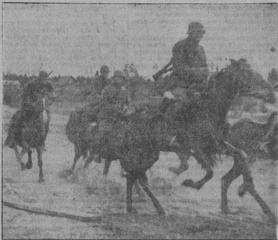
Отряды конницы русских добровольцев находятся на фронте вместе с германскими солдатами и солдатами других европейских народов, чтобы с оружием в руках способствовать полной победе над большевизмом