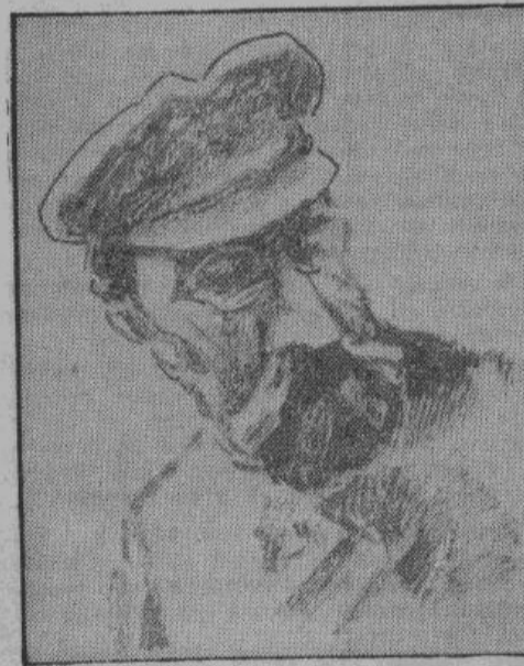
Лейба Каменев (Розенфельд)

Сталин был всегда «смеющимся третьим». Ему всегда удавалось получить большинство голосов при производимых им в партии перегруппировках личного состава тем, что он шел навстречу то «правой», то «левой» и в незначительных политических вопросах поддерживал то ту, то другую. Каждый раз то «правые», то «левые» думали, что Сталин приспосаблиется к их требованиям и в будущем пойдет с ними. На-