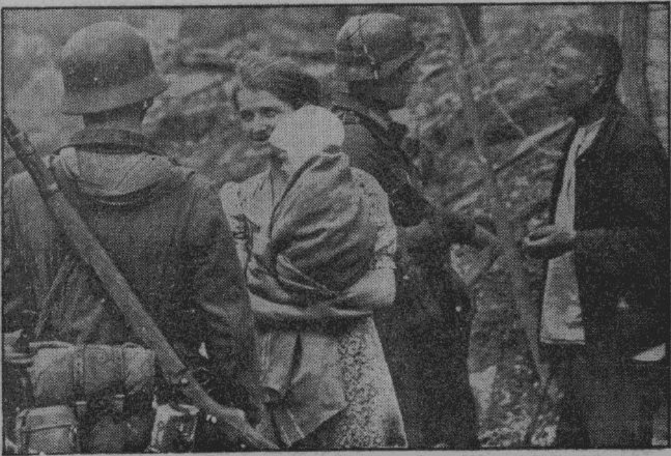
Население Новороссийска радостно приветствует своих освободителей

Салоники, 12 сентября. Согласно сообщению из Багдада, бывший багдадский губернатор Джелаль Халид был арестован в здании министерства финансов, сразу же после того, как он был принят министром. Джелаль Халид принадлежит к той руководящей группе иракских националистов, которая играла значительную роль при Рашиде Али Аль-Гайлани. Вместе с ним арестован ряд высокопоставленных государственных чиновников.