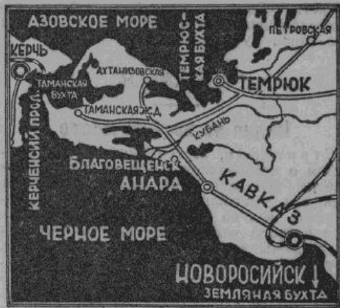
После окончания боев Таманский полуостров очищен от большевиков

Берлин, 12 сентября. В операциях под Сталинградом германские войска добились нового крупного успеха. В то время, как германские танки уже несколько дней назад прорвались к Волге, севернее Сталинграда, германским передовым частям теперь удалось достигнуть Волги также и в южном