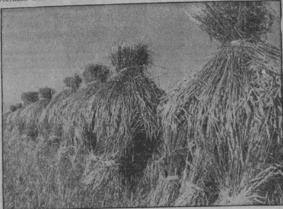
«...Проходим по полю, густо установленным «бабками» ржи. Промераем средний сноп — высота 7 четвертей. Добрая рожь!»

Крестьяне рассказали, что в прошлом году, при бегстве, руководители советской машинно-тракторной станции испортили все машины, приобретенные на народные средства. Как пришли немцы, сразу же присту-