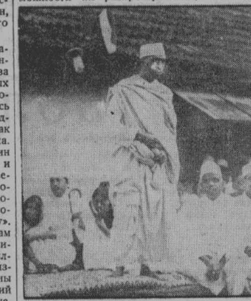
Пандит Неру, один из национальных вождей Индии. Теперь арестован англичанами.

роться. В интересах Англии — не давать Индии оправиться, чтобы не утратить своей власти над страной. Для Англии важно держать народы Индии в таком состоянии, чтобы возложенные ею работы выполнялись. Знаменательно, что по всей Индии нет совершенно больничных касс. «Свободный крестьянин» не в состоянии был бы делать туда взносы, ибо его дневной заработок в среднем, составляет от 40 до 50 пфеннигов, которых только только хватает на прокормление семьи, обыкновенно очень многочисленной. Конечно, и на борьбу с болезнями у него не остается ни одного пфеннига. Поэтому большинство индусов, заболев, может только предоставить себя судьбе. На 50.000 жителей в Индии приходится один врач. При большом числе разных эпидемий и легкой возможности их распространения, в Индии,