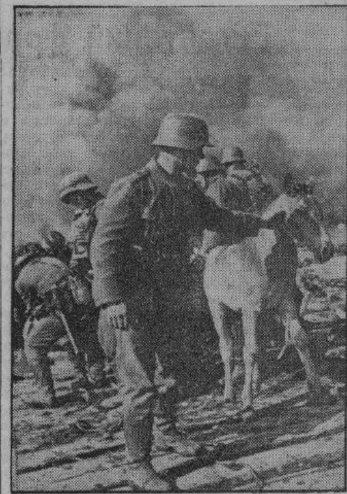
После боя германский солдат отводит брошенного большевиками жеребенка

В Берлине стали известны некоторые подробности боев к югу от Новороссийска. Продвигающиеся все дальше вперед, германские и румынские части заняли несколько важных высот. Советские позиции были хорошо укреплены и обнесены проволокой и заграждениями. Преодоление этих укреплений потребовало от германских и румынских солдат максимального напряжения. В настоящее время идет уничтожение отдельных, отрезанных, большевистских групп и проводится чистка занятой территории от остатков противника. В гористом районе к востоку от Новороссийска большевики были