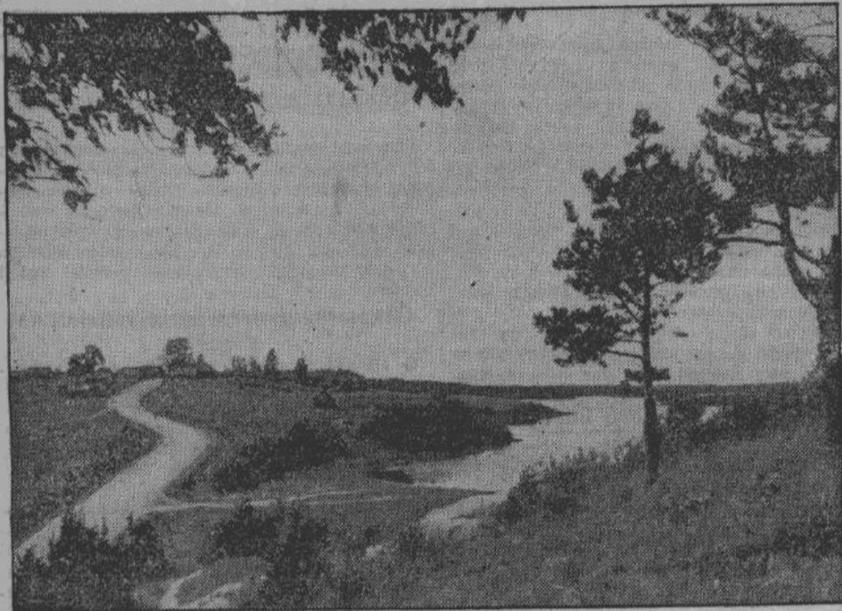
«...Дорога лежит среди широких полей, на которых сегодня не видно ни души — крестьяне отдыхают.»