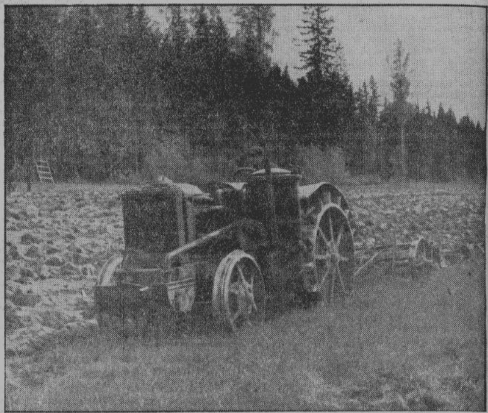
Русский крестьянин снова трудится на своей земле