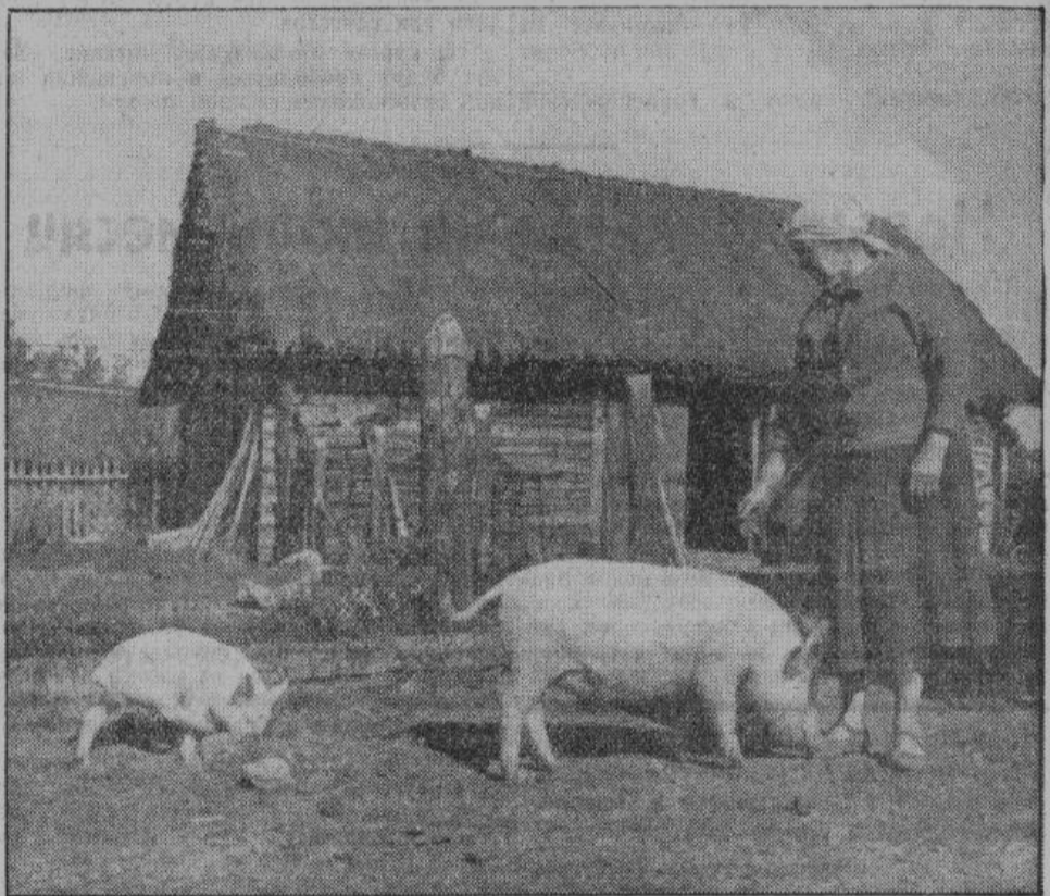
Русская женщина опять полная хозяйка в своем доме