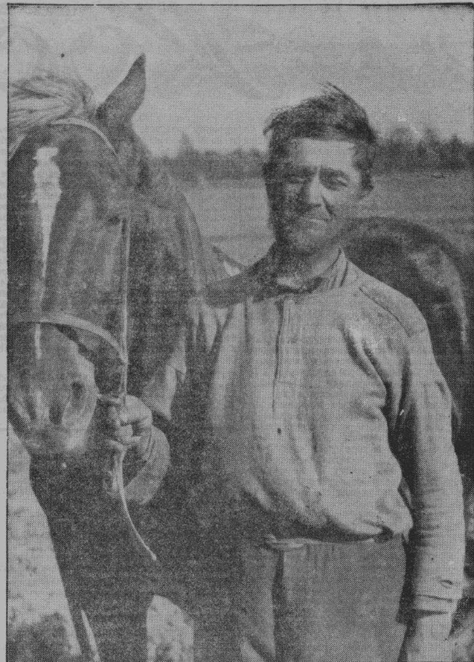
Во всех районах освобожденных областей крестьянам, ведущим образцово свое хозяйство и выполняющим нормы по поставкам, выделены хутора и предоставлена тягловая сила. На снимке — крестьянин-хуторянин со своим конем, полученным от Хозяйственной Комендатуры.