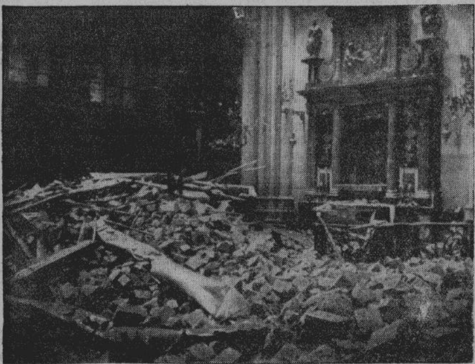
Как уже неоднократно сообщалось в сводках германского верховного командования, английские летчики бомбардируют мирные города. Недавно, во время одного из таких налетов, был разрушен Кельнский собор, являющийся древним памятником немецкого зодчества. На снимке — разрушенный алтарь собора с черной статуей Божией Матери, которая осталась невредима, так как ее каждый вечер уносили в надежное бомбоубежище.