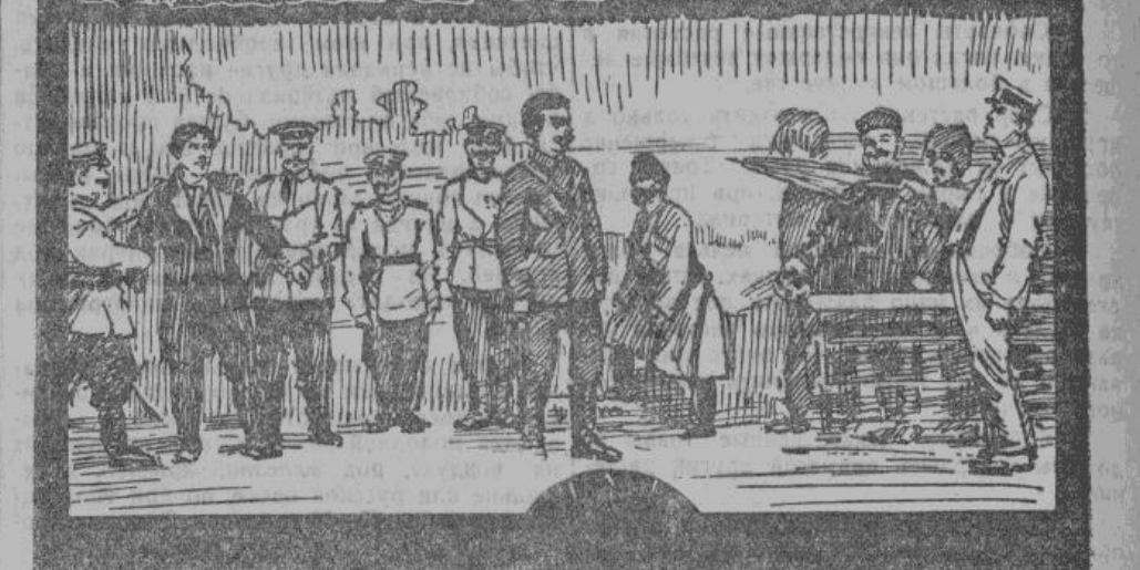
Судья Бутс (I) в «веселительном саду» на Неве, зонтиком указывает на Раскольникова, отдавая этим приказ городовым об аресте «опасного бунтовщика». (рис. с фототрафии).

Но Соия неумолима: она настаивает на необходимости искупить тяжелый грех. Здесь-то происходит та сцена, которая всего сильнее «пробирает» публику. Соия с своей младшей сестренкой читают молитву (!). И Раскольников, до того неумолимый, непреклонный в своем безверии, побежден,