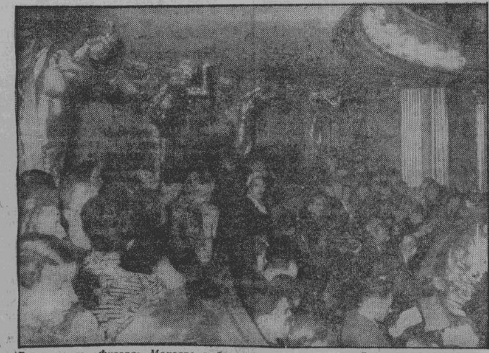
Делегаты на «Фигаро» Моцарта в большом оперном театре Берлина. В 1941 году этот театр был сожжен английскими летчиками. Ныне же он восстановлен и работает, как прежде