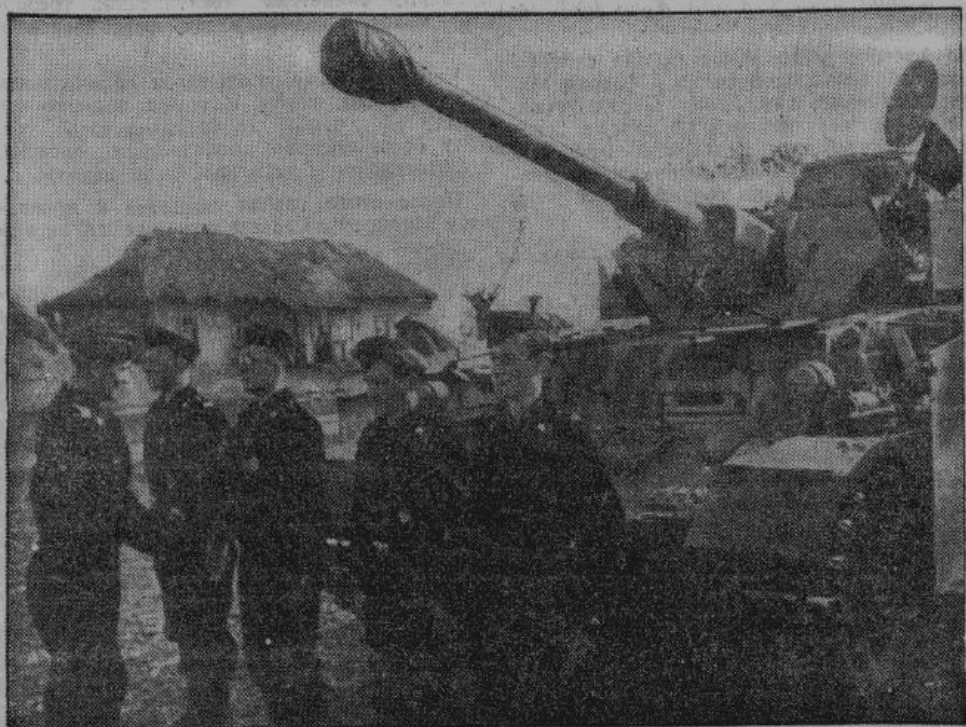
Днем и ночью на фронт идут бесконечные эшелоны с оружием, танками, боевым снаряжением и т. д. На снимке — на фронт прибыл новый германский танк. Командир соединения экипажу новой машины желает боевых успехов