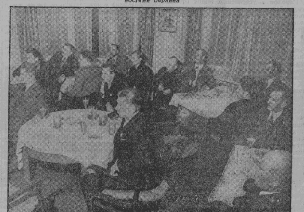
В Берлине состоялась встреча делегатов с официальным представителем Министерства Пропаганды. На снимке — делегаты слушают речь представителя