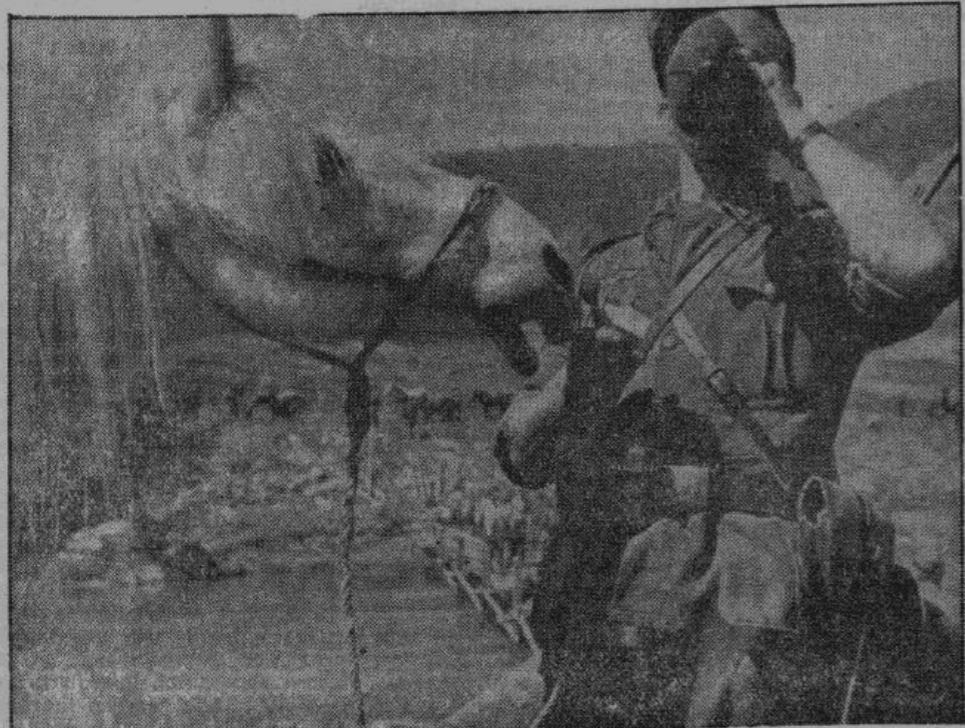
Нешадно палят солнце. Утомились люди и кони. Глоток из походной фляжки и кусок хлеба быстро восстанавливают силы. Верный товарищ солдата — лошадь тоже проголодалась и не хочет упустить возможности полакомиться.