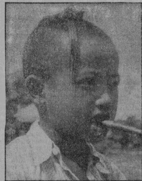
Прическа этого мальчика очень своеобразна. Удивляет нас также, что он держит в руках сигару. Однако, в Бирме и то и другое обыкновенное явление

Завоевание уже в 1937 году в отношении управления отделимой от Индии, но находящейся под британским владычеством страны увенчалось победоносным продвижением японских армий в южной части Восточной Азии. Обладание Бирмой было важно для Японии по трем причинам. Отделимая от Индии высоким горным хребтом, Бирма представляет собой естественную границу, отделяющую японскую сферу влияния от британской. С другой стороны, расположенные Бирмы у Бенгальского залива делают ее прекрасной наступательной позицией для борьбы за владычество в Индийском океане и для вторжения в самую Индию. Однако, важнейшей причиной, побудившей японцев к завоеванию Бирмы, является пересекающая последнюю шоссеная дорога. Этот окруженный легендами внутренне-азиатский путь сообщения связывает враждебный Японии Чунцинский Китай с азиатскими владениями Британской империи. Прекращение движения военных транспортов по бирманской дороге, благодаря ее захвату, является величайшим достижением японского главного командования за эту войну. Вместе с морским опорным пунктом Шонань (Сингапур), основные позиции в Бирме создают предпосылку к владычеству Японии в Юго-Восточной Азии. Англо-американцы, в свою очередь, только снова завоевав Бирмой, могут думать о восстановлении потерянных ими в Восточной Азии