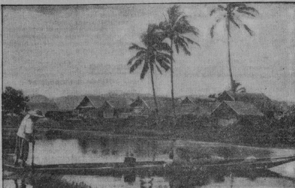
Разведение риса в особенности распространено в южной части Бирмы. В период половодья крестьянин развозит по своим полям на лодке. После занятия страны японцами, 90 процентов рисовых полей снова засеяны