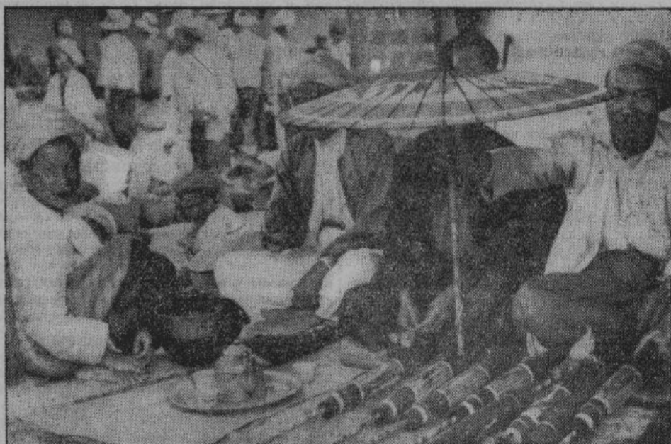
Слишком яркое солнце? Да, действительно, в Бирме солнечного света и тепла так много, что по соображениям здравоохранения приходится от него защищаться