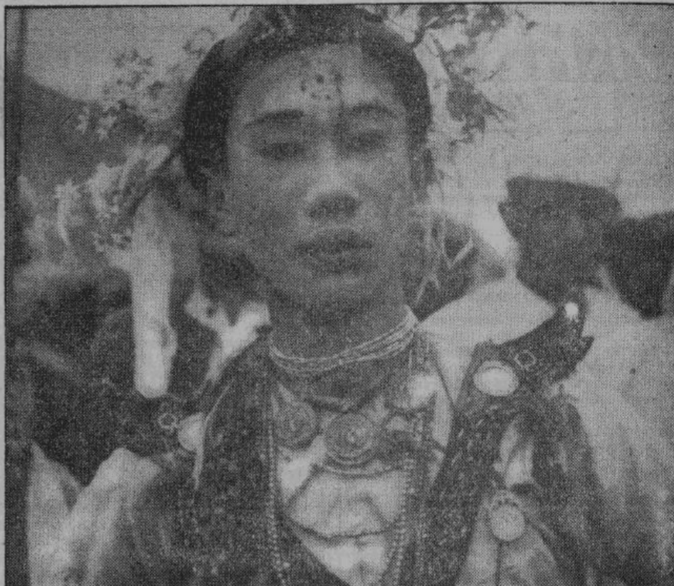
Бирманская танцовщица с украшениями, предусмотренными в древних обрядах и обычаях