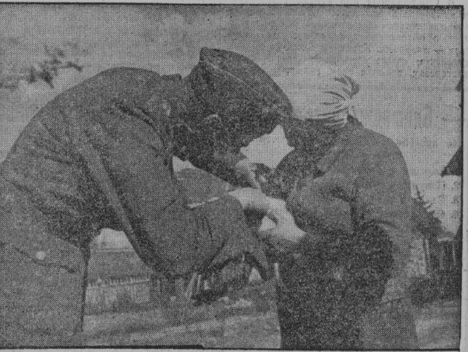
Очень часто крестьянки освобожденных областей обращаются к германским специалистам за той или иной помощью по хозяйству. На снимке — германский специалист дает указание крестьянке Опочечкого района, как нужно ухаживать за поросенком, заболевшим бронхопневмонией