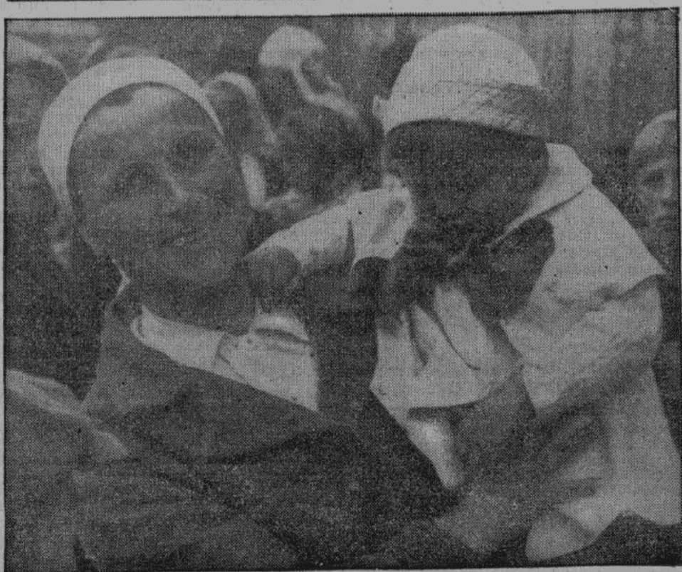
В освобожденных областях России мать теперь снова имеет право лично воспитывать своих детей. На лице матери после прошедших лет большевицкого террора снова сияет счастливая улыбка