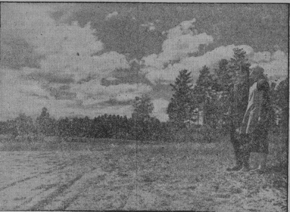
Крестьяне Опочечкого района получили хутора и отруба. На снимке — крестьянин Н., получивший отруб, показывает своей жене границы отведенного ему земельного участка