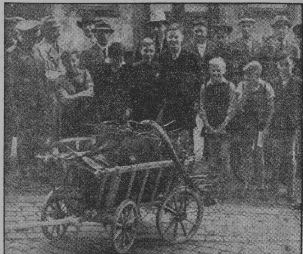
Повстречавшиеся в Халле сборщики металлического лома, после оживленной беседы, пожелали сняться с русскими делегатами, на память

В Германии культура и цивилизация расчленили свои дары и достижения равно-