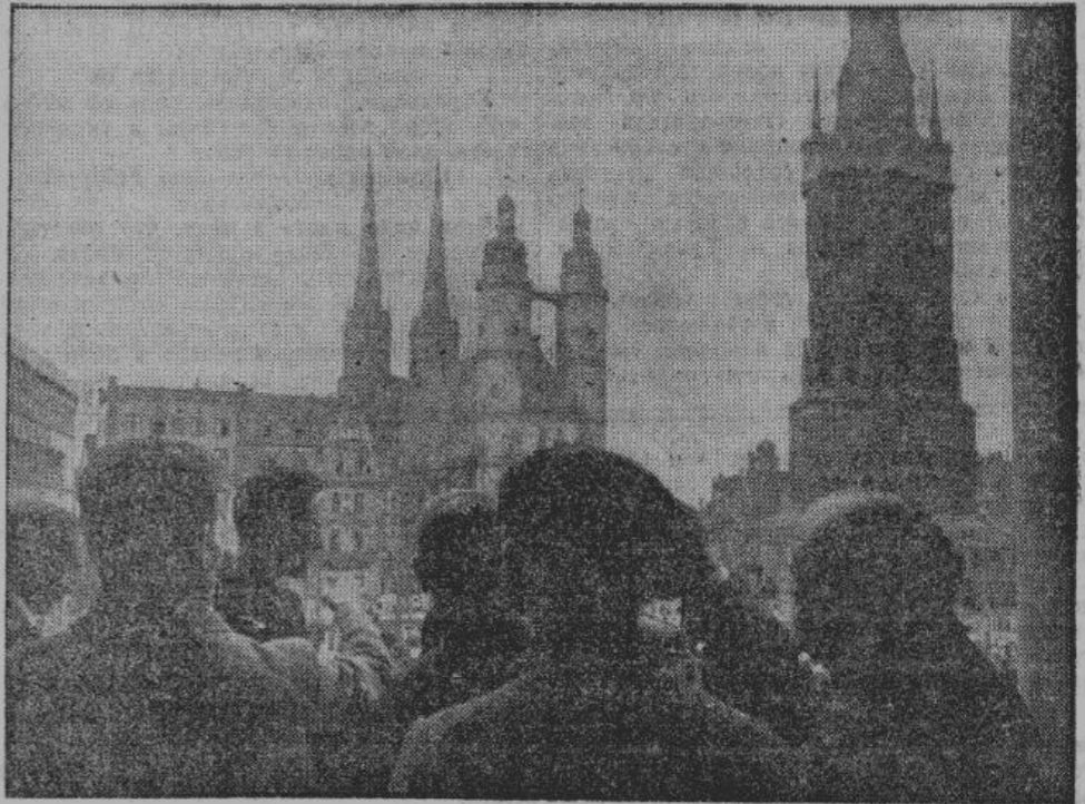
Делегаты на балконе городской ратуши в Халле

распределение их среди гражданского населения.