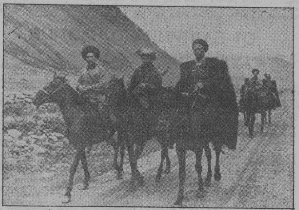
Молодые и старые горцы записываются в ряды добровольцев, чтобы начать борьбу против большевизма.