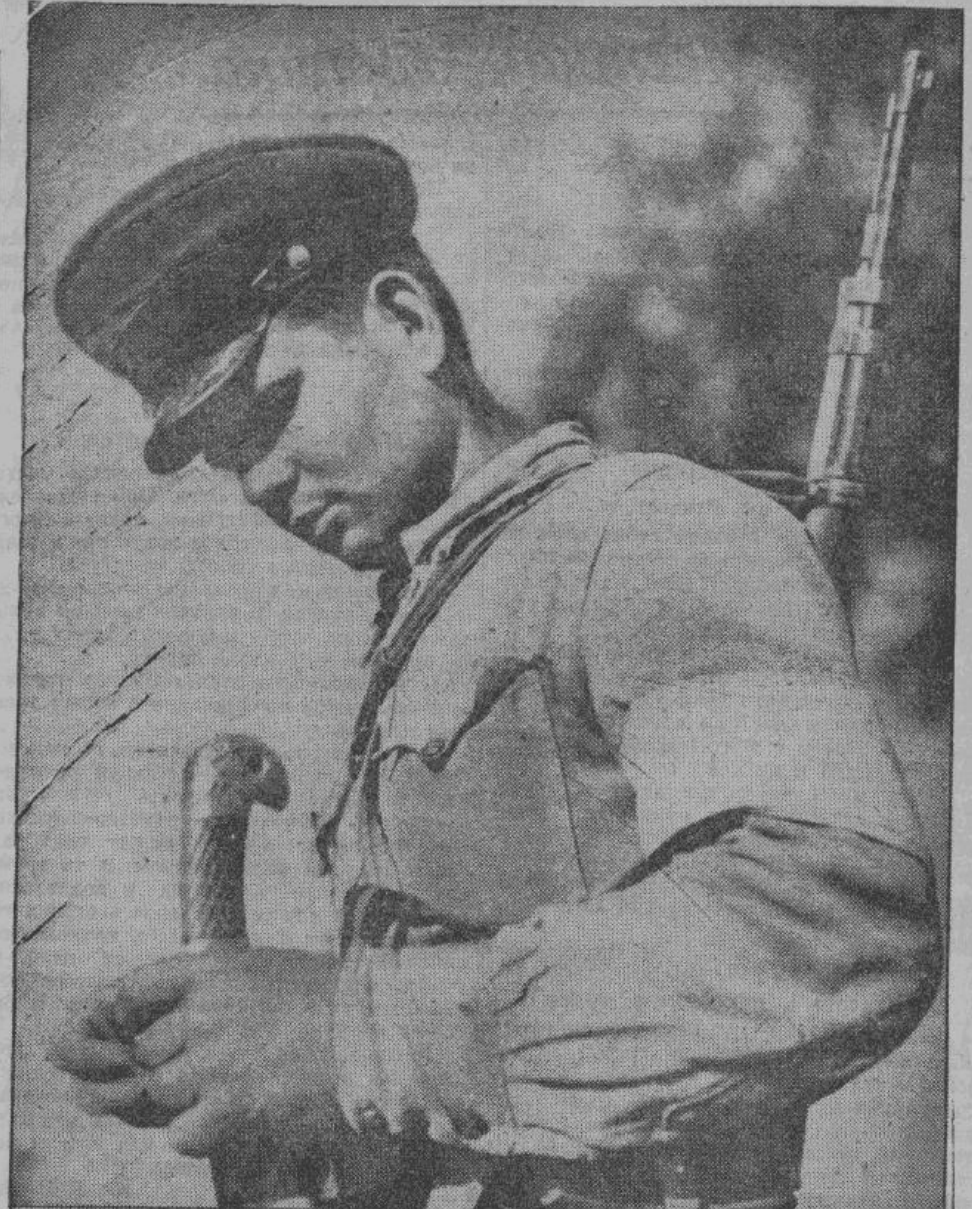
Ликуя по поводу освобождения своей родины от большевизма, молодой казак с тяжелой шапкой и пояса отправляется на обучение. На нем еще старая форма, но белая лента на рукаве свидетельствует о том, что он, подобно сотням и тысячам других, вступил в ряды германской армии, чтобы в качестве добровольца начать борьбу против большевизма.