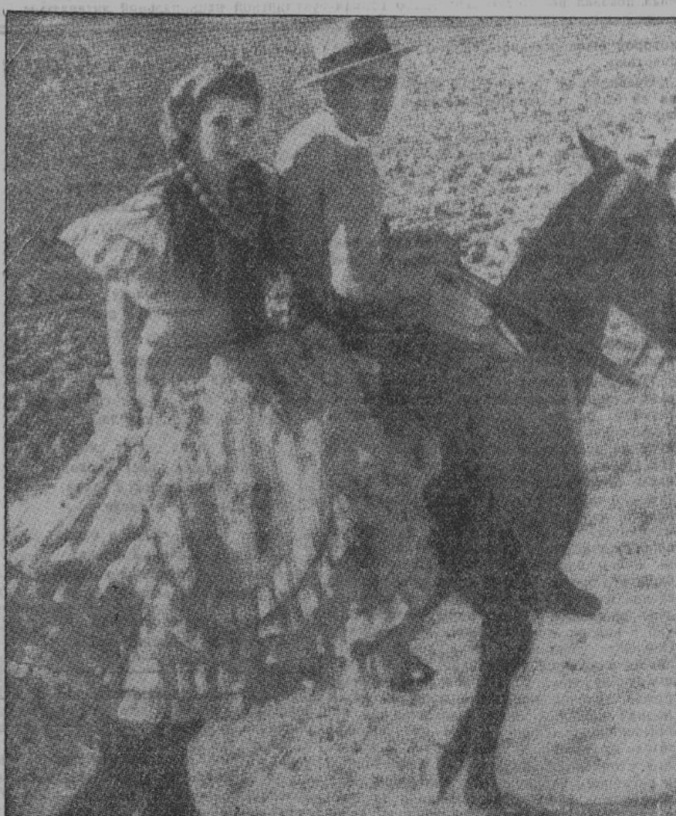
До сих пор еще испанки выезжают на народные праздники, сидя на крупах лошадей, позади своих кавалеров