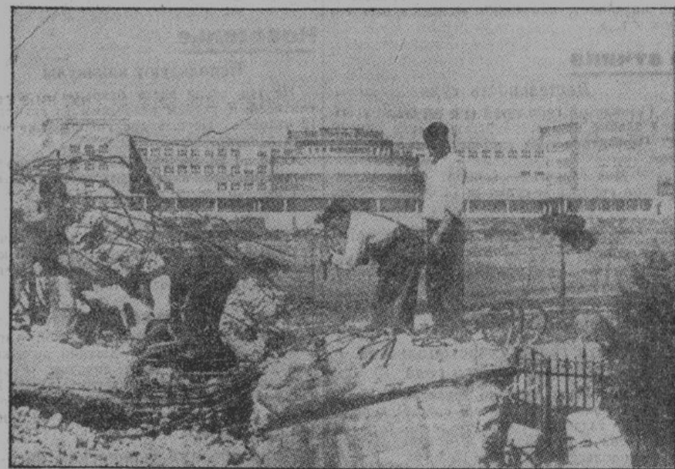
За развалинами возникает новая жизнь. Величественное здание Мадридского университета