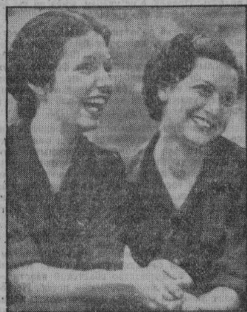
Испанские девушки всегда веселы и добры

Этот процесс достиг в настоящее время той фазы, которая уже допускает некоторый оптимизм. Наблюдение показывает, что в стране царит трудолюбие, и бодрое настроение, не исключающее готовности дружно встать на защиту родины, если этого потребуют обстоятельства. В течение десятилетий, или же столетий, продолжались безуспешные и поэтому напрасные попытки правительства оздоровить хозяйственную жизнь Испании. Поэтому неудивительно, что испанский рядовой обыватель вначале относился сдержанно и недоверчиво к первым попыткам авторитарного режима оздоровить хозяйственную жизнь и ко всему, что с этим было связано. Раньше, в то время, как другие европейские народы переживали эпоху общественного расцвета и основывали могучие государства, испанский народ принужден был оставаться безучастным свидетелем жуткого благополучия. Испанское государ-