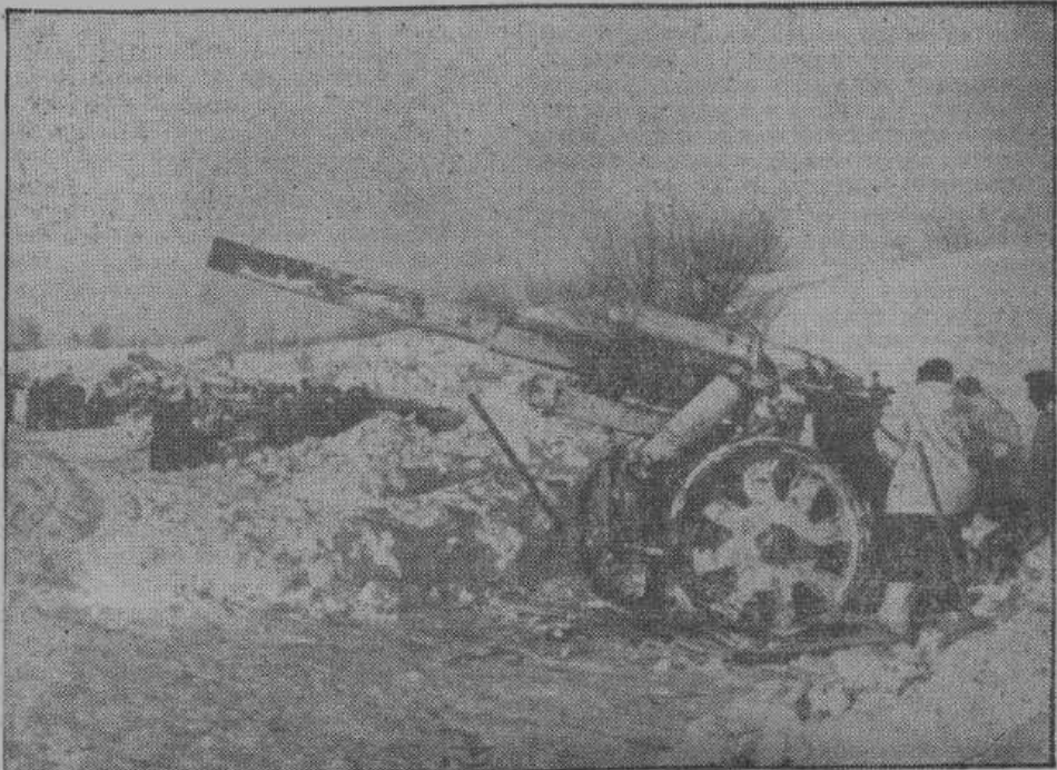
Атаки большевиков большей частью отбиваются огнем германской артиллерии. На снимке — германская батарея на северном участке фронта готова отразить большевистскую атаку