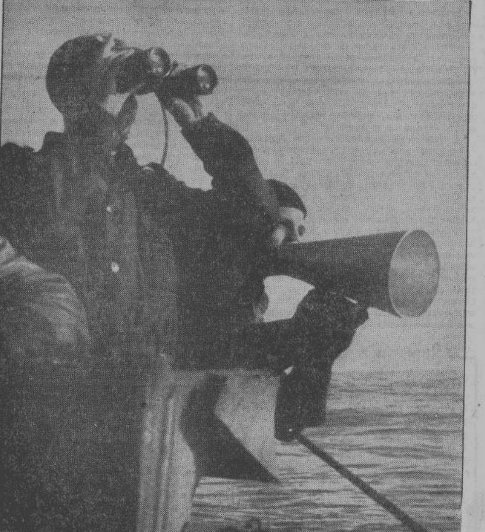
На морях всего мира теперь господствуют германские подводные лодки, которые днем и ночью наблюдают за движением кораблей противника и заботятся о том, чтобы неприятельские караваны транспортных судов не достигли своей цели. Верховное командование германских вооруженных сил в специальных сообщениях очень часто оповещает о новых успехах подводных лодок. За один только 1942 год германские лодки потопили общей сложностью 9,9 миллионов брт. неприятельских судов. На снимке: командир подводной лодки в бинокль наблюдает за горизонтом.