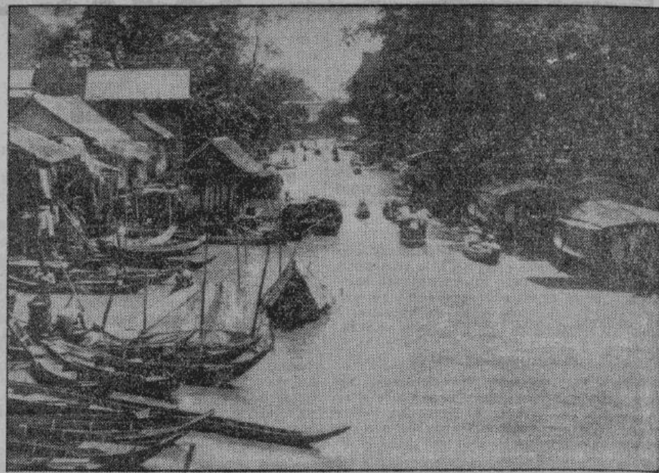
Характерный для Бирмы ландшафт — дорога в одном из городов страны

Любопытно в Бирме смешение старых привычек с проявлениями современной жизни. Сильная воля, большая жизненность, акробатическая подвижность, тонкое понимание искусства в соединении с дисциплинированностью и уважением порядка, позволяют возлагать самые лучшие надежды на будущее бирманского народа.