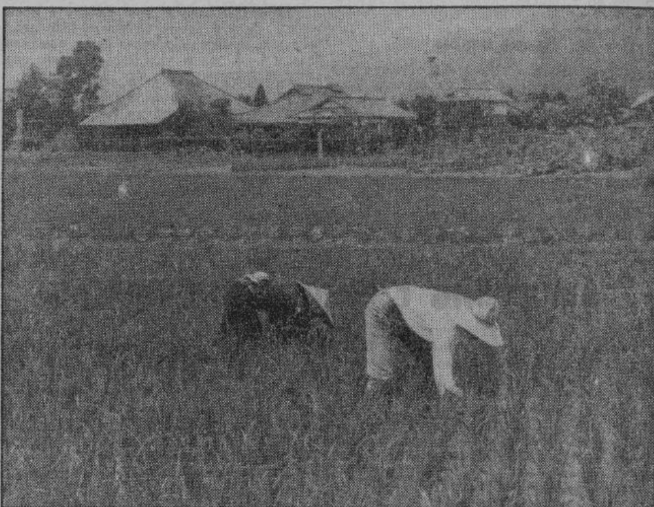
Рисовые поля — богатство населения. Бирма — один из самых крупных экспортеров риса