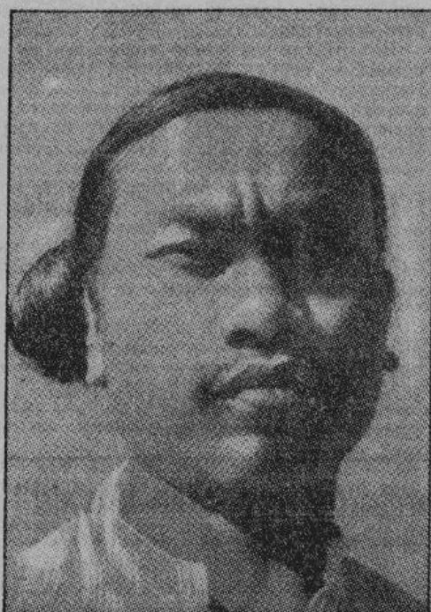
Бирманцы — темпераментный народ с тонким восприятием. Мужчины носят длинные волосы, завязанные узлом

Несколько дней тому назад, бирманское государство, находившееся, в течение десятилетий, под гнетом Англии, снова стало независимым. Бирма примет активное участие в созидательной работе, начатой по инициативе Японии в великом Восточно-Азиатском пространстве.