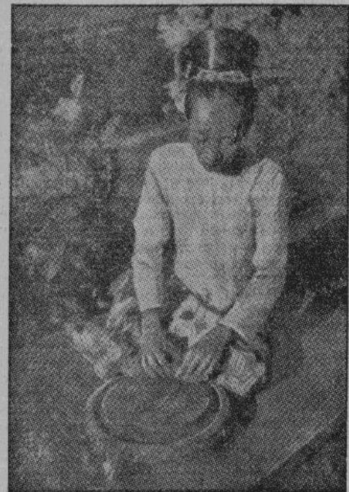
Эта бирманка занята изготовлением косметической мази, растирая кусок дерева о мокрый песчаник. Мазь — секрет замечательной кожи азиатки

60 лет тому назад, в Бирме еще происходили борьба и восстания — теперь же дети и внуки тогдашних борцов за свободу строят новую жизнь. Нет сомнения, что ненависть к англичанам, — крепнувшая в течение столетия, — одно из основных чувств, воодушевляющих теперешних бирманских политиков. Антибританская установка была той основой, на которой бирманцы заключили союз со своими японскими освободителями. Многие предки теперешних политических руководителей Бирмы провели десятки лет в английских тюрьмах. В числе этих жертв британского террора — отец теперешнего премьер-министра Ба Мавы. До прихода японцев в Бирму, о стремлении страны стать независимой, кое-что уже было известно. Однако, стихийное присоединение народа к японской армии и взрыв ненависти к Англии поразили людей незнакомых с местными обстоятельствами. Английская печать утверждала, что стремление бирманского населения к независимости, — даже лондонская пропаганда не могла скрыть этого факта, — было лишь