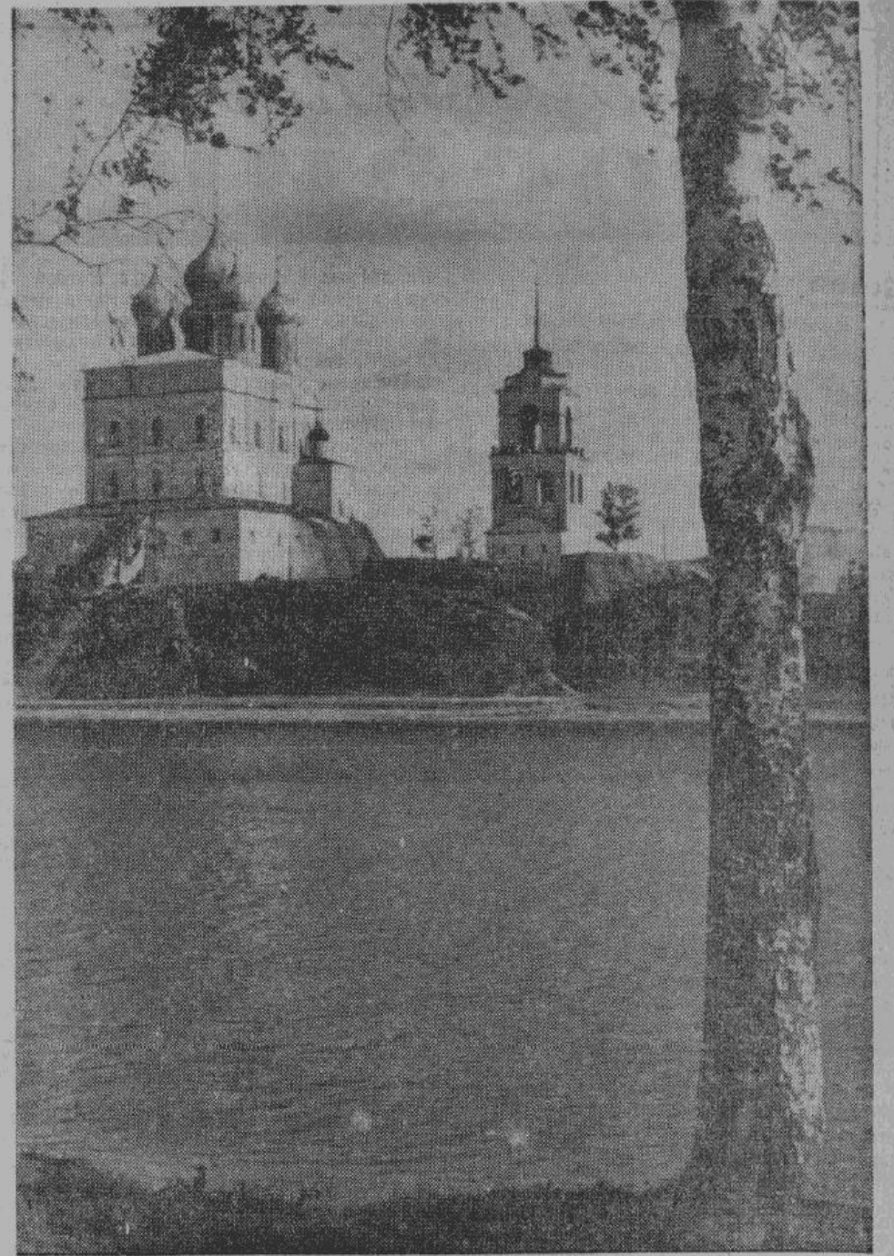
Величественный собор Св. Троицы во Пскове. В нем с древних времен хранились значительные исторические и художественные ценности, выкраденные большевиками в первые годы революции. Высота собора по зволяет видеть его в ясную погоду на расстоянии 30-ти километров.

Спать он уходит после одиннадцати часов, а в три часа утра опять на работе. И в этом кропотливом труде он видит своеобразный отдых и залог своего благополучия. С. Назаров.