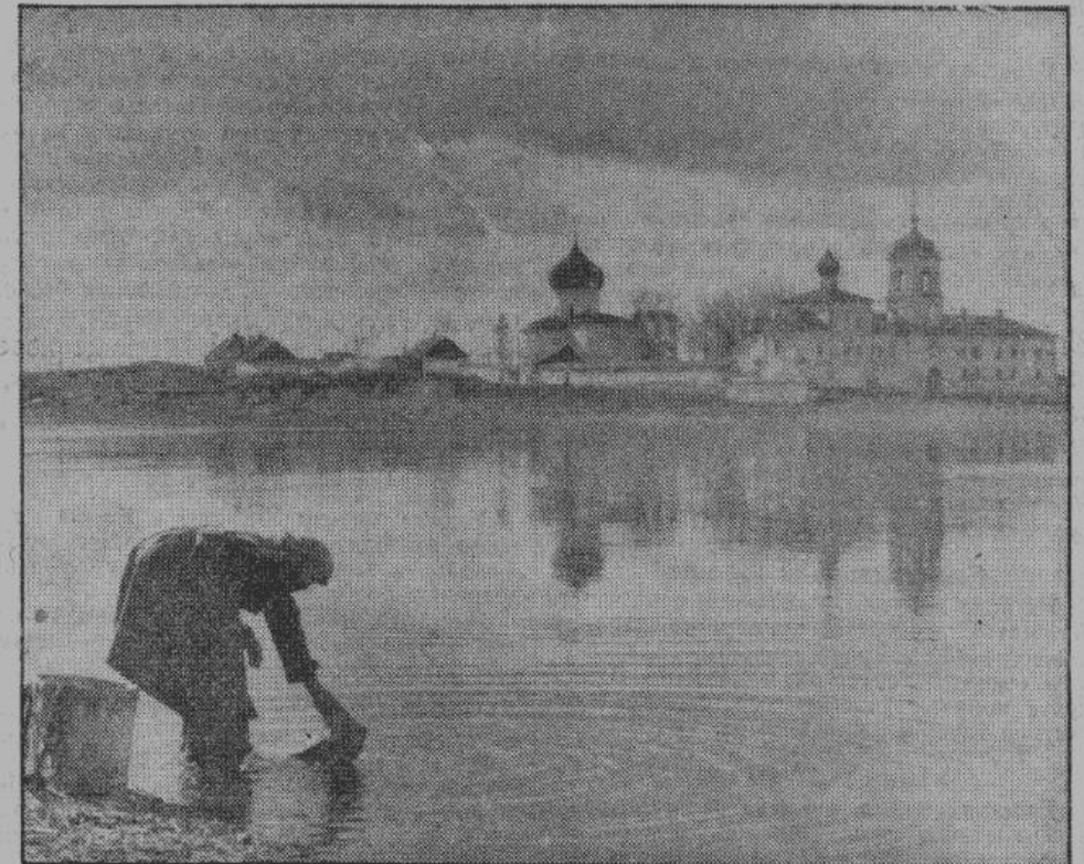
Древний Спасо-Мирожский монастырь, основанный в XII веке. Отсюда артиллерия польского короля Стефана Батория обстреливала в свое время Покровскую башню.