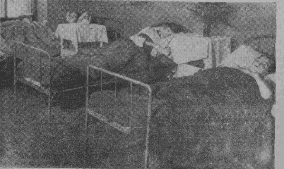
Во всех освобожденных областях нашей Родины немцы для нужд гражданского населения открыли больницы и лазареты. Больные размещены в светлых, чистых комнатах. Уход и лечение быстро восстанавливают их силы, чтобы они снова могли приступить к своей работе.