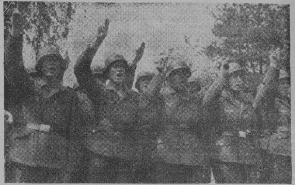
На днях были приведены к присяге новые отряды добровольцев Эстонии, Латвии и Литвы. В борьбе против большевизма они готовы жертвовать своей жизнью.