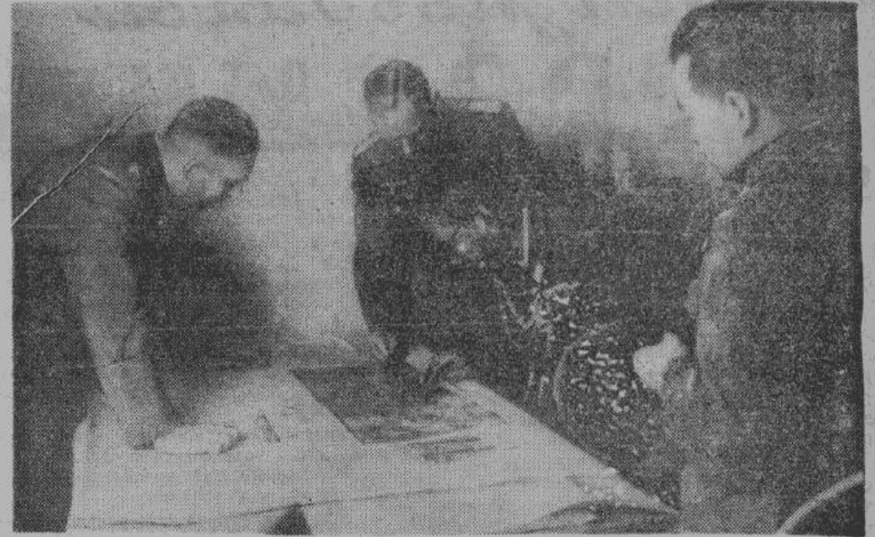
Японская военная миссия посетила театр военных действий на Восточном фронте. Офицеры германского генерального штаба японским гостям поясняют стратегическое положение.