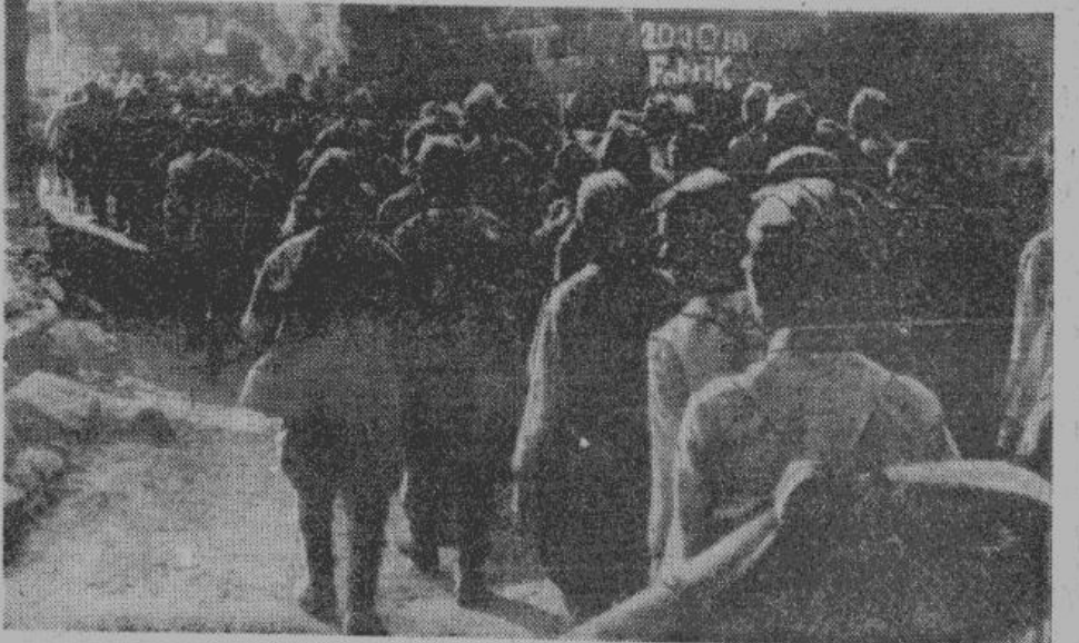
Колонна красноармейцев, взятых в плен у Белгорода и Орла, направляется в тыл. Бывшие советские бойцы на пути к новому, лучшему будущему.