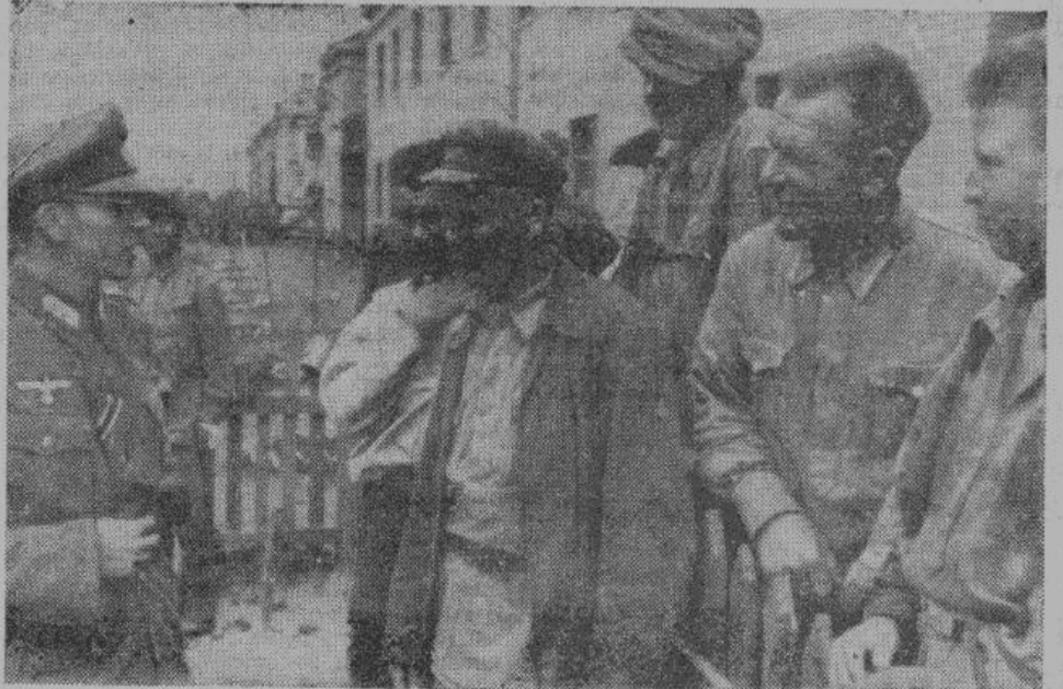
В лагере перебежчиков. Появ всю безнадёжность положения большевиков, бывший красноармеец перешел на немецкую сторону. Они беседуют с германскими офицерами о своем будущем. Довольные лица перебежчиков выражают радость по поводу освобождения от сталинского ига.