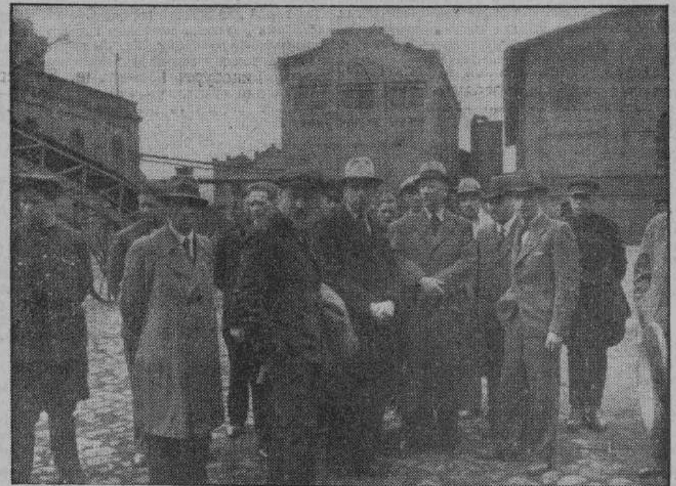
Члены делегации, под руководством заводской администрации, осматривают один из «самых грязных» дворов газового завода.