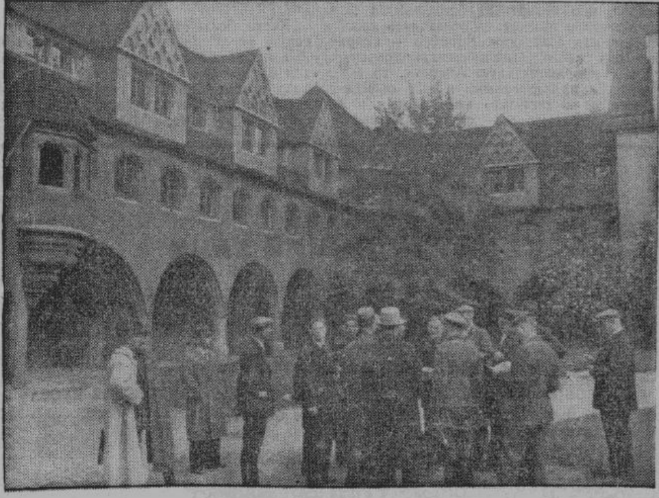
Во дворе одного из старейших зданий города Галле — родины композитора Генделя