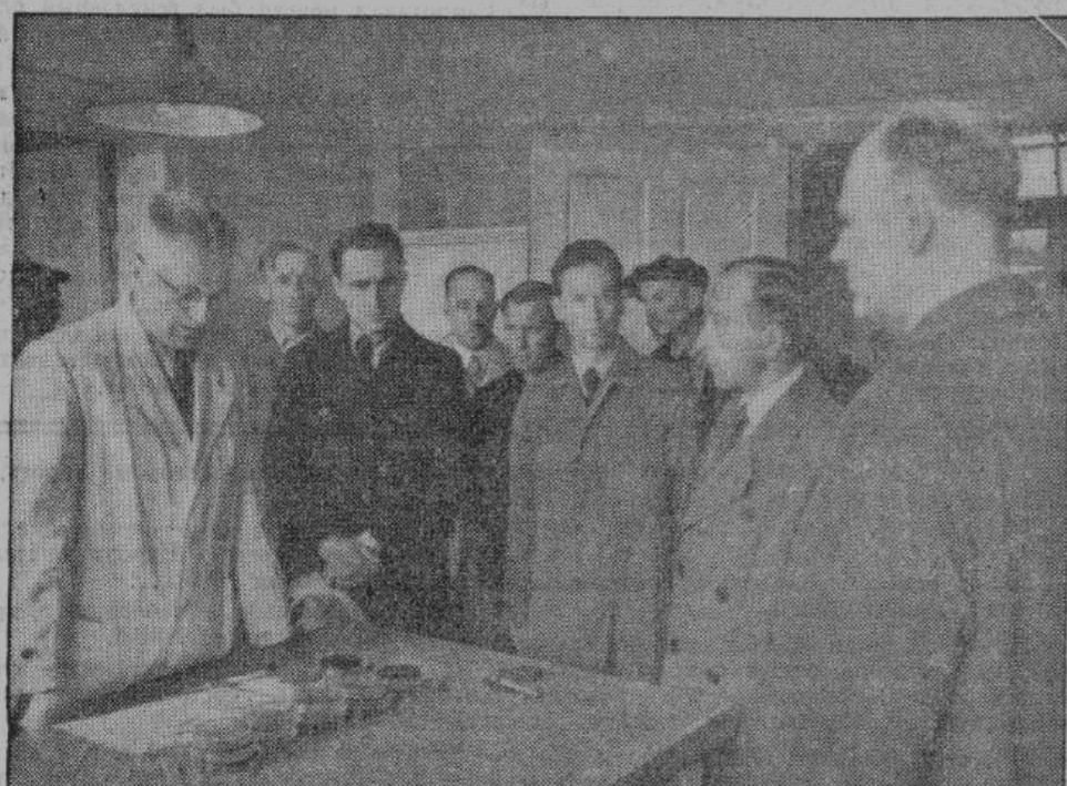
Делегаты слушают пояснения старшего сотрудника контрольной лаборатории бойни