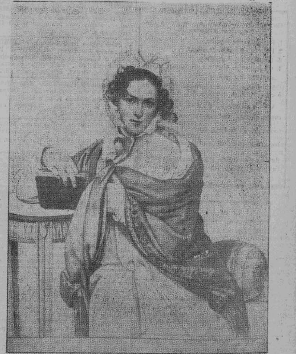
Портрет княгини Щербатовой. Карандашный рисунок Кипренского, сделанный им в 1819 году.