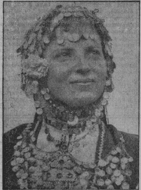
Молодая болгарка в национальном уборе