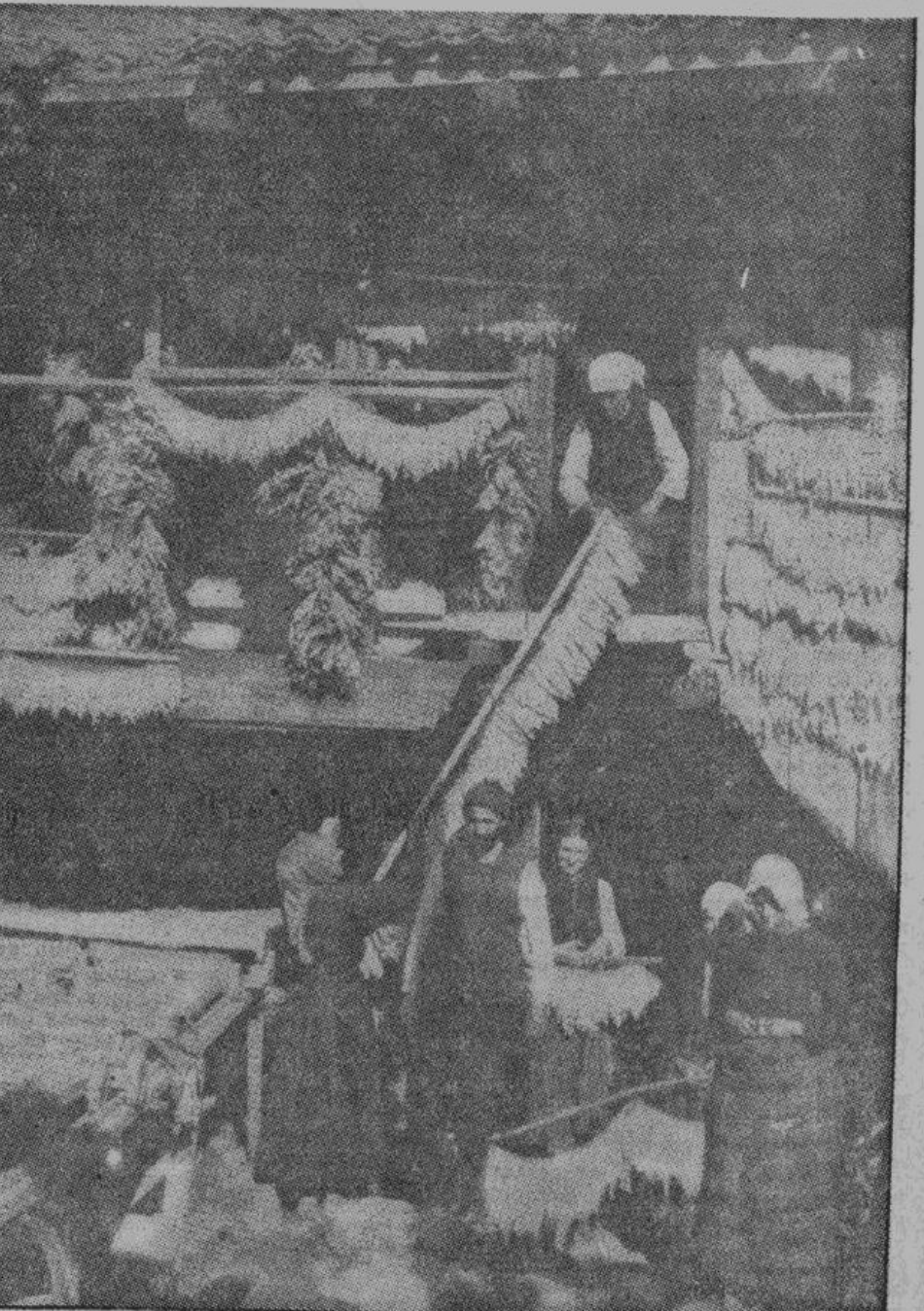
Табак — одно из главных богатств Болгарии

Цена отдельного номера 50 коп., месячная подписка 12 рублей.