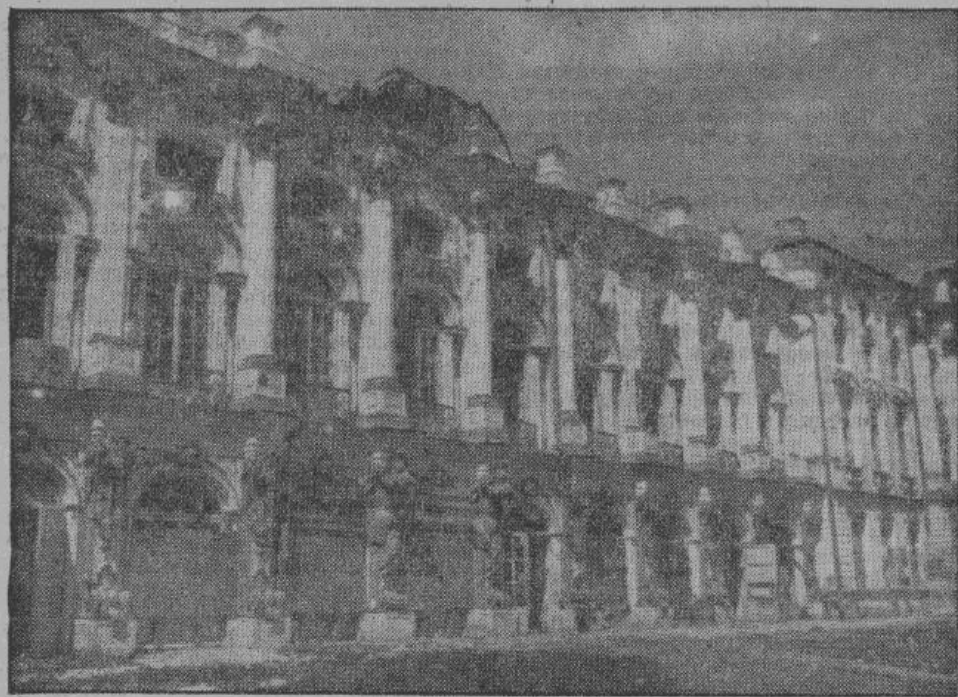
Остатки летнего украшения главного фасада Екатерининского дворца сильно пострадавшего от артиллерийского обстрела.

встречали: тогда государыню императрицу, а теперь — Анну Александровну Луначарскую.