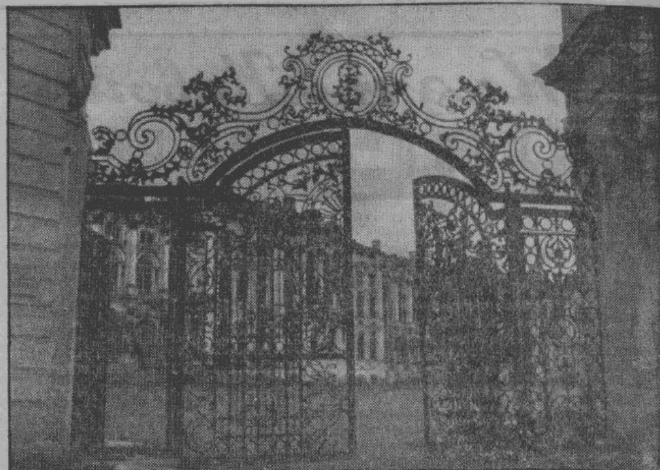
Вид на главный фасад Екатерининского дворца в Пушкине через сохранившиеся ворота этого огромного дворца-музея.

В магазинах и складах происходили драки из-за «права» на обладание тем или иным предметом.