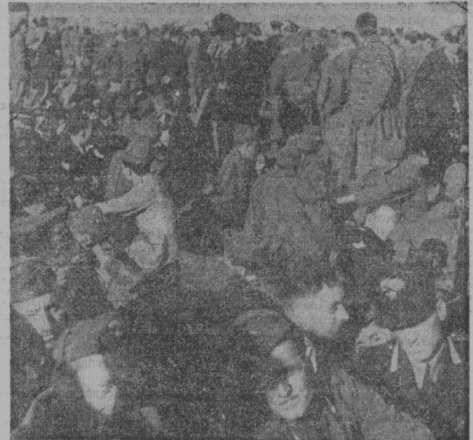
Разоруженные солдаты армии предателя Бадолье.