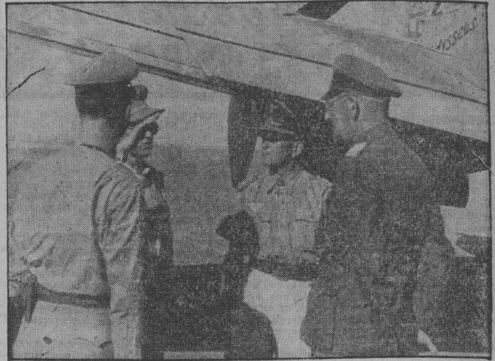
Германский летчик - разведчик вернулся с полета над позициями противника. Командир эскадрильи принимает его доклад.