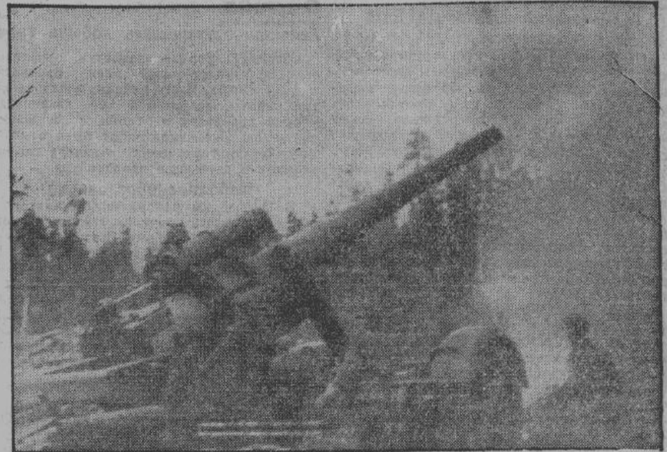
Германское дальнбойное орудие при обстреле Ленинграда.