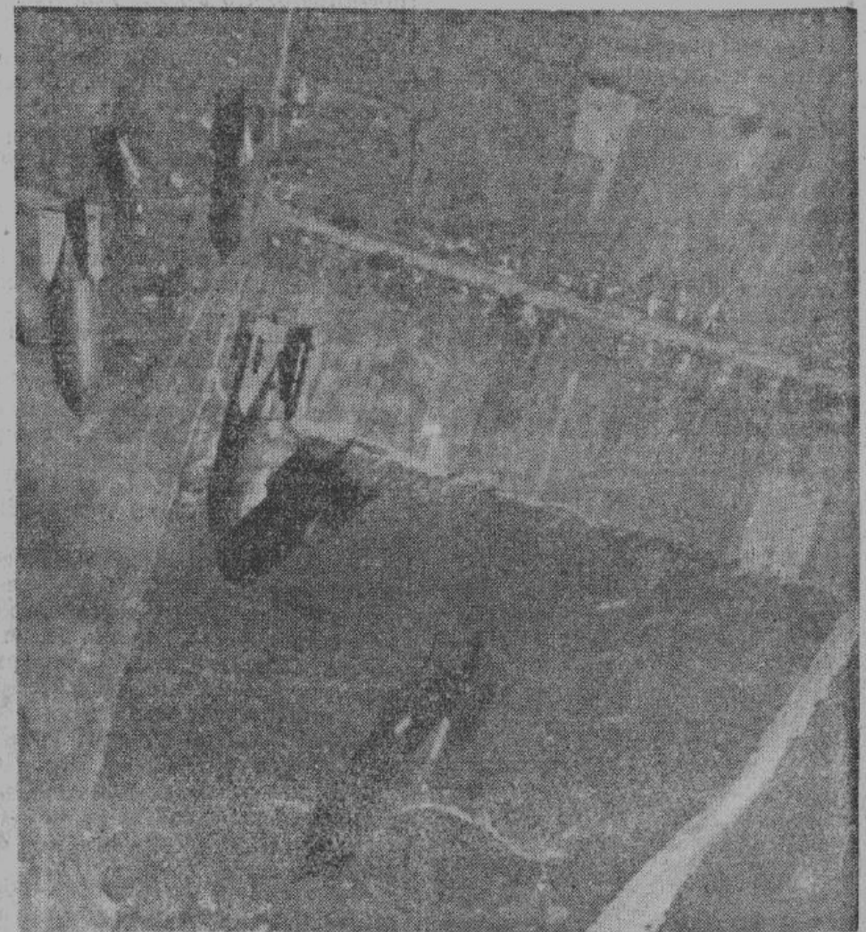
Каждый день германская авиация сбрасывает сотни тонн бомб на пути сообщения неприятеля.